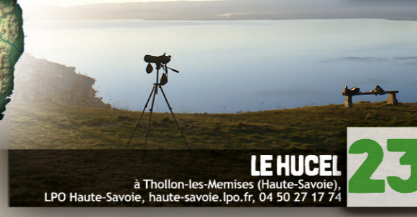
23 LE HUCHEL à Thollon-les-Memises (Haute-Savoie), LPO Haute-Savoie, haute-savoie.lpo.fr, 04 50 27 17 74