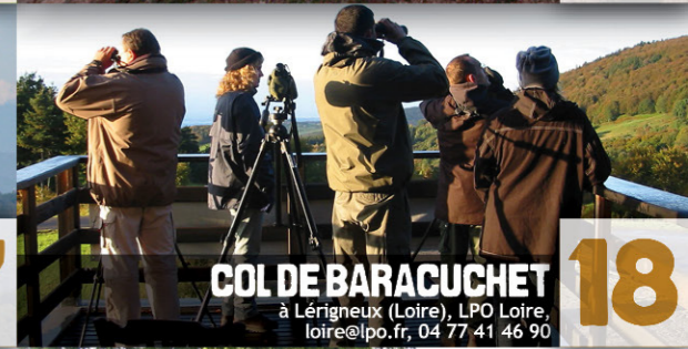
18 COL DE BARACUCHET à Lérigneux (Loire), LPO Loire, loire@lpo.fr, 04 77 41 46 90