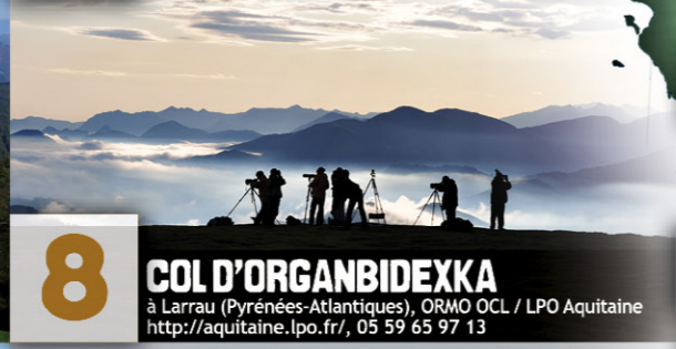
8 COL D'ORGANBIDEXKA à Larrau (Pyrénées-Atlantiques), ORMO OCL / LPO Aquitaine http://aquitaine.lpo.fr/ , 05 59 65 97 13