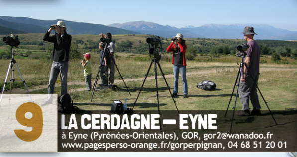
9 LA CERDAGNE - EYNE à Eyne (Pyrénées-Orientales), GOR, gor2@wanadoo.fr www.pagesperso-orange.fr/gorperpignan , 04 68 51 20 01