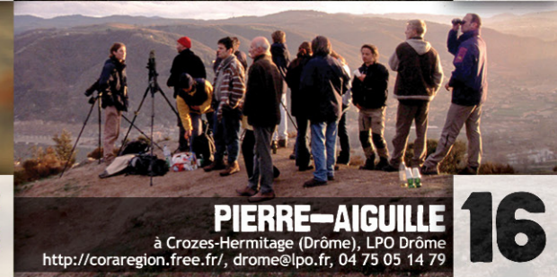
16 PIERRE-AIGUILLE à Crozes-Hermitage (Drôme), LPO Drôme http://coraregion.free.fr/ , drome@lpo.fr, 04 75 05 14 79