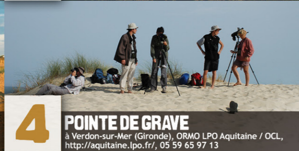
4 POINTE DE GRAVE à Verdon-sur-Mer (Gironde), ORMO LPO Aquitaine / OCL, http://aquitaine.lpo.fr/ , 05 59 65 97 13