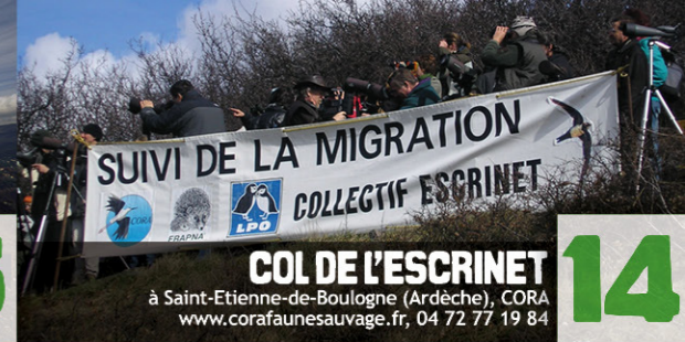
14 COL DE L'ESCRINET à Saint-Etienne-de-Boulogne (Ardèche), CORA www.cora-faunesauvage.fr , 04 72 77 19 84