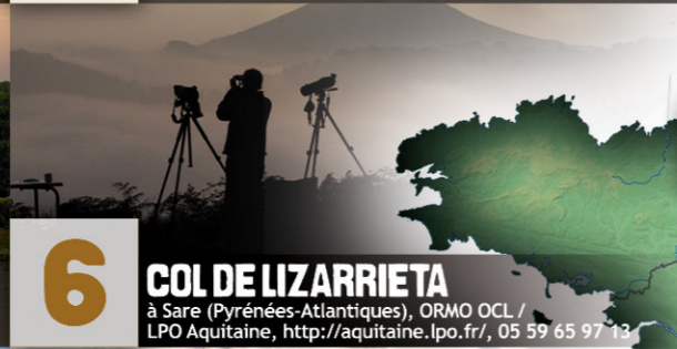
6 COL DE LIZARRIETA à Sare (Pyrénées-Atlantiques), http://aquitaine.lpo.fr/, 05 59 65 97 13