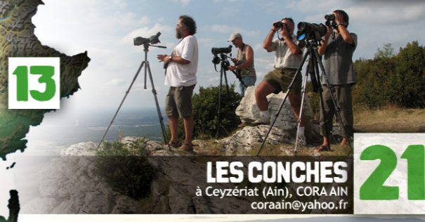
21 LES CONCHES à Ceyzériat (Ain), CORA AIN coraain@yahoo.fr