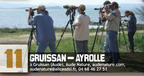
11 GRISSAN - AYROLLE à Grissan (Aude), Aude Nature, audenature.com, audenature@aliceadsl.fr, 04 68 46 27 51