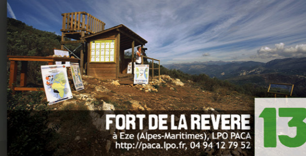
13 FORT DE LA REVERE à Eze (Alpes-Maritimes), LPO PACA http://paca.lpo.fr , 04 94 12 79 52

Retrouvez toutes les informations utiles sur www.migraction.net