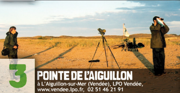
3 POINTE DE L'AIGUILLON à L'Aiguillon-sur-Mer (Vendée), LPO Vendée, www.vendee.lpo.fr , 02 51 46 21 91