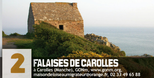
2 FALAISES DE CAROLLES à Carolles (Manche), GONm, www.gonm.org, maisondeoiseaumigrateur@orange.fr, 02 33 49 65 88