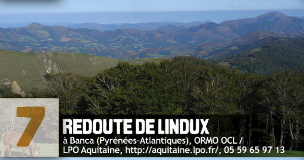
7 REDOUTE DE LINDUX à Banca (Pyrénées-Atlantiques), ORMO OCL / LPO Aquitaine, http://aquitaine.lpo.fr/ , 05 59 65 97 13