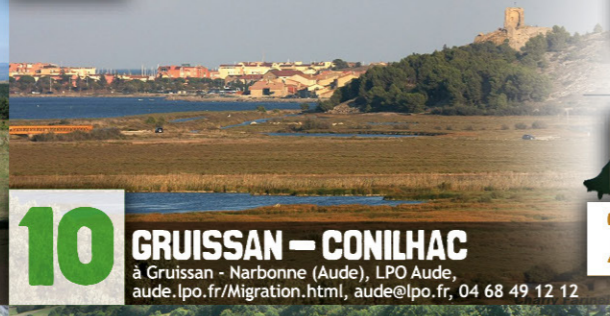
10 GRISSAN - CONILHAC à Grissan - Narbonne (Aude), LPO Aude, aude.lpo.fr/Migration.html, aude@lpo.fr, 04 68 49 12 12