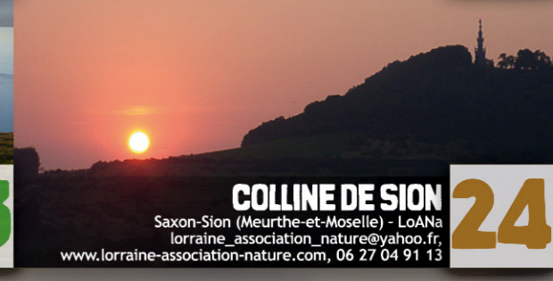
24 COLLINE DE SION Saxon-Sion (Meurthe-et-Moselle) - LoANA lorraine_association_nature@yahoo.fr, www.lorraine-association-nature.com , 06 27 04 91 13

SITES PROPOSANT UN ACCUEIL DU PUBLIC, DE 1 A 24 sites de printemps / sites d'automne / printemps et automne