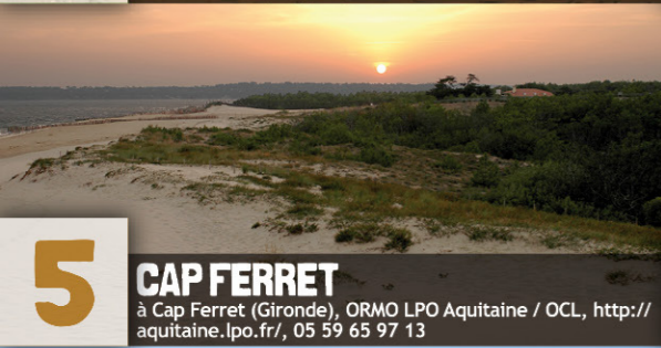
5 CAP FERRET à Cap Ferret (Gironde), ORMO LPO Aquitaine / OCL, http://aquitaine.lpo.fr/ , 05 59 65 97 13