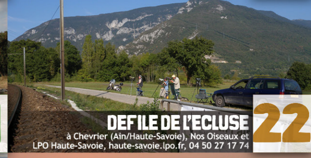
22 DEFILE DE L'ECLUSE à Chevrier (Ain/Haute-Savoie), Nos Oiseaux et LPO Haute-Savoie, haute-savoie.lpo.fr, 04 50 27 17 74