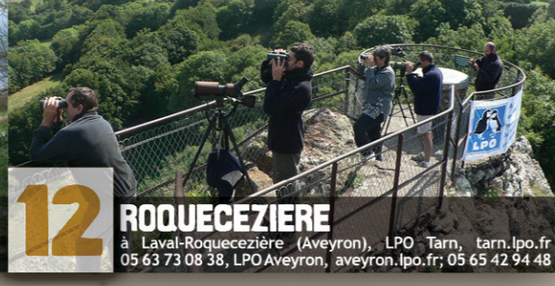
12 ROQUECEZIERE à Laval-Roquecezière (Aveyron), LPO Tarn, tarn.lpo.fr 05 63 73 08 38, LPO Aveyron, aveyron.lpo.fr; 05 65 42 94 48