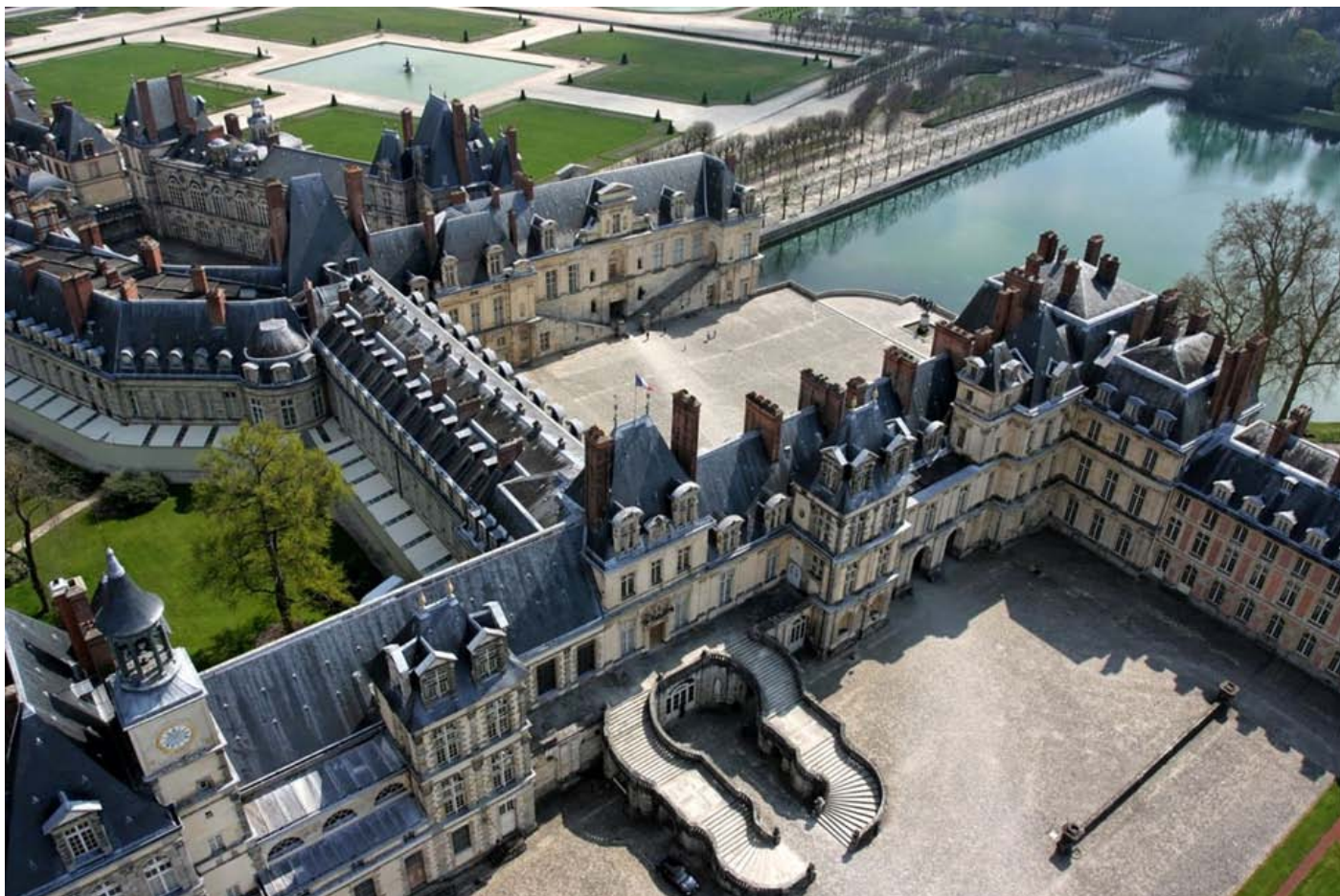
Château de Fontainebleau.