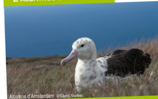
Albatros d'Amsterdam

Parmi les espèces les plus menacées au monde (une cinquantaine de couples reproducteurs seulement), l'albatros d'Amsterdam ne niche que sur une île française du sud de l'océan Indien, l'île Amsterdam.