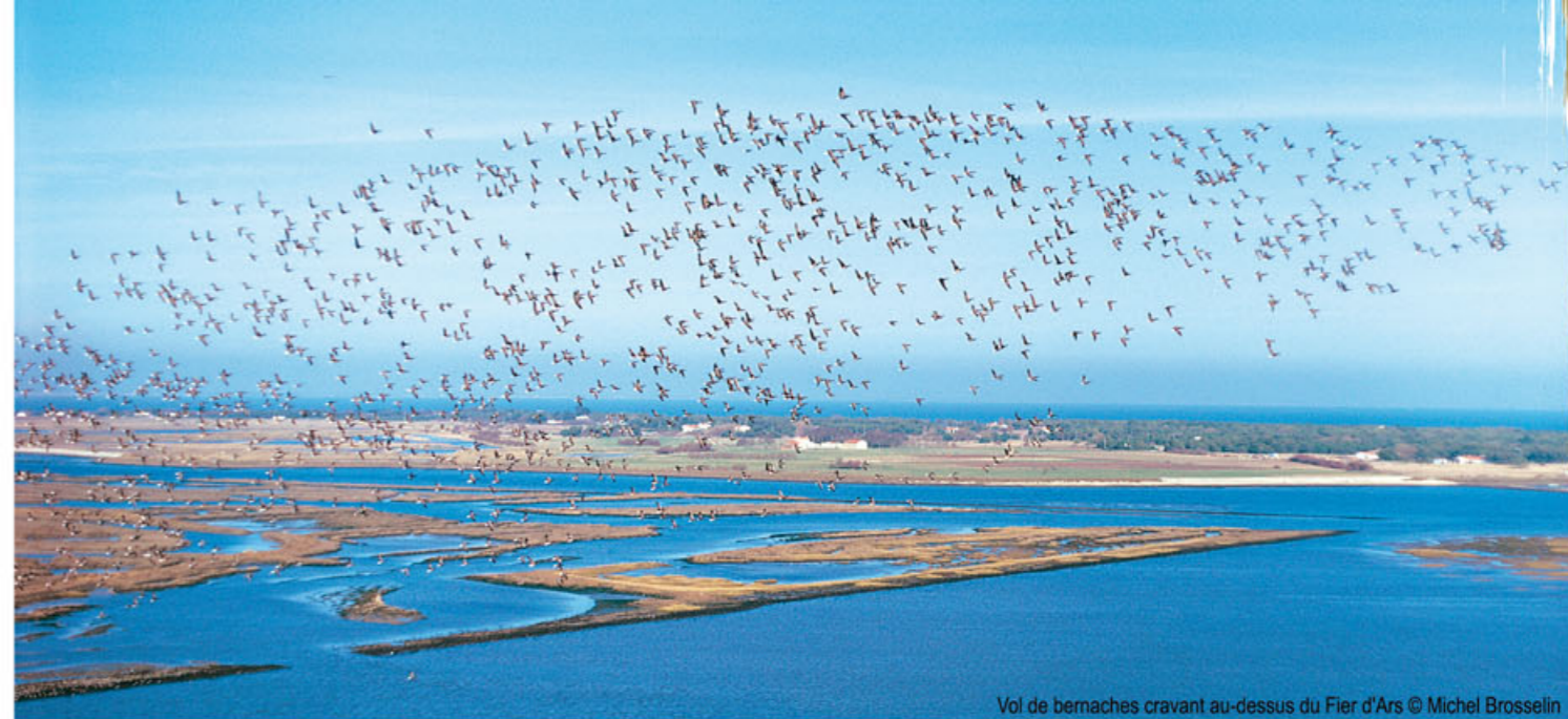
Vol de bernaches cravant au-dessus du Fier d'Arç