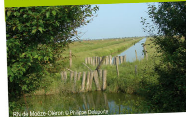
RN de Moëze-Oléron

Alors qu'en moyenne 12 000 limicoles hivernaient entre 1976 et 1985 avant la création de la réserve naturelle (1985), ce chiffre est passé à 70 000 aujourd'hui.