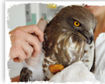
Soins à un circaète

Pour venir en aide à la faune en détresse, et notamment aux oiseaux, souvent victimes des effets néfastes de notre société moderne, la LPO gère 7 centres de sauvegarde, un relais, 2 Unités Mobiles de Soins et coordonne le programme "Oiseaux en détresse". L'année dernière, les centres LPO ont recueilli 5 695 animaux, dont 412 mammifères et quelques reptiles. Plus de 40 % de ces animaux ont pu être relâchés.