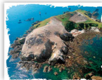
Ile Rouzic, réserve naturelle des Sept-iles