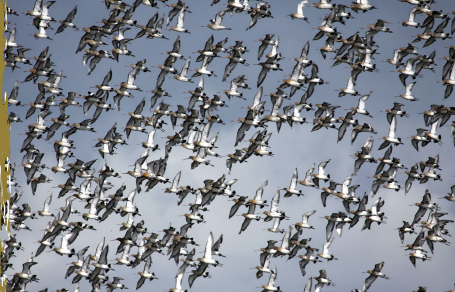
Migration de barges à queue noire