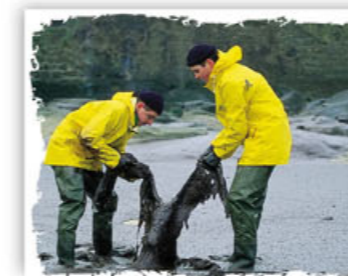
Erika , des pompiers récupèrent le cadavre d'un fou de Bassan

L'événement permet également la reconnaissance des compétences d'une ONG et du travail de 8 000 bénévoles qui se sont mobilisés autour de la LPO pour recueillir, soigner et tenter de sauver 62 000 oiseaux.