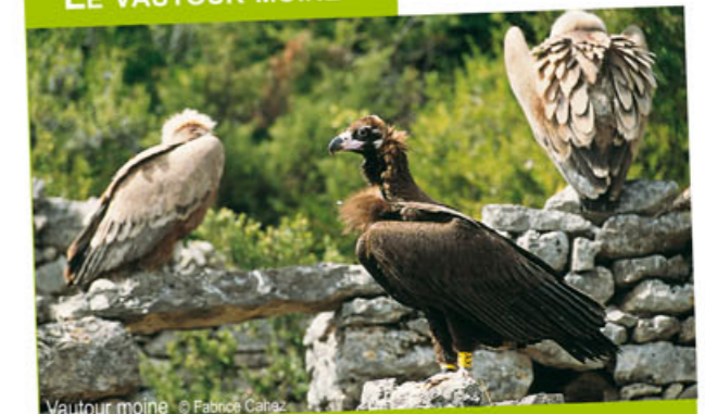
Vautour moine

Cette espèce a disparu de France au tout début du 20 ème siècle et a vu ses effectifs fondre dans toute l'Europe, à l'exception de l'Espagne. Elle a été réintroduite (1 ère mondiale à l'époque) avec succès, par la LPO, dans les Grands Causses à partir de 1992. Cette opération a bénéficié du savoir-faire acquis lors de la réintroduction du vautour fauve, 10 ans plus tôt. La population française de vautour moine est aujourd'hui la plus dynamique d'Europe, avec plus de 25 couples.