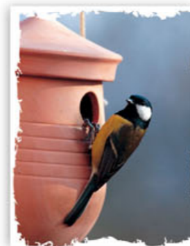
Mésange charbonnière sur nichoir