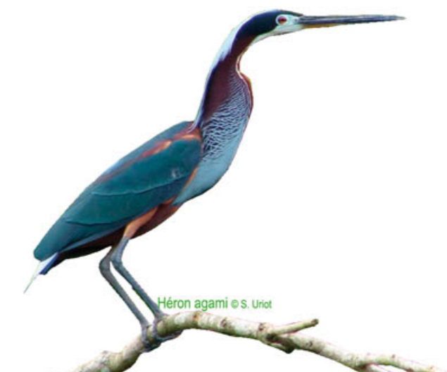
Héron agami