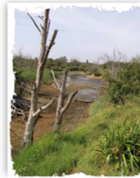
RN d'Yves

Face à la régression des prairies humides du marais Poitevin (40 % mises en culture en 20 ans) et à l'effondrement des effectifs nicheurs et migrateurs consécutifs, la LPO définit à partir de 1989 une stratégie pour la sauvegarde des 100 000 hectares de ces zones humides. Elle lance une campagne en leur faveur et débute ses acquisitions.