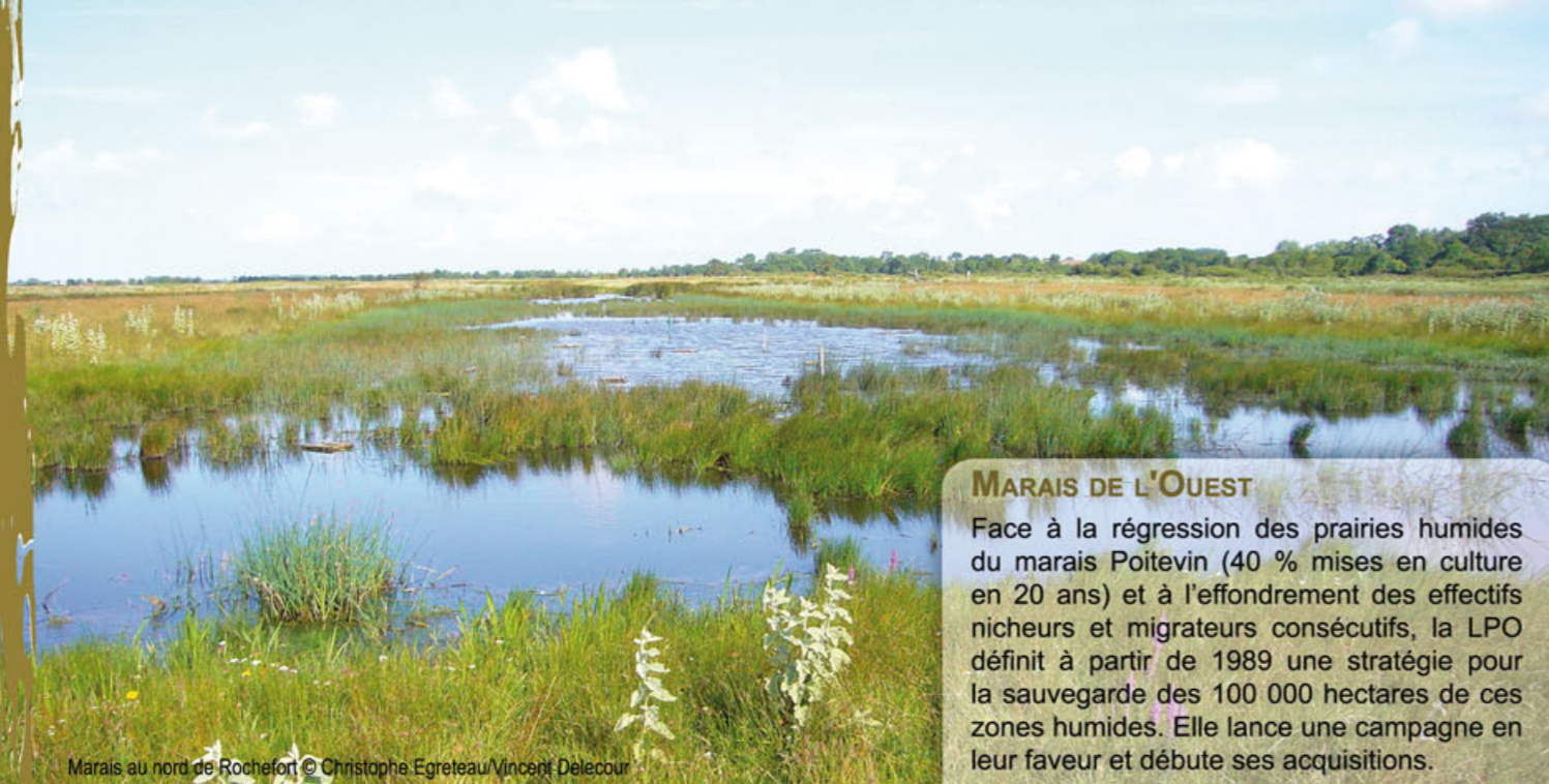
Marais au nord de Rochefort