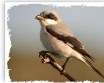
Pie-grièche à poitrine rose