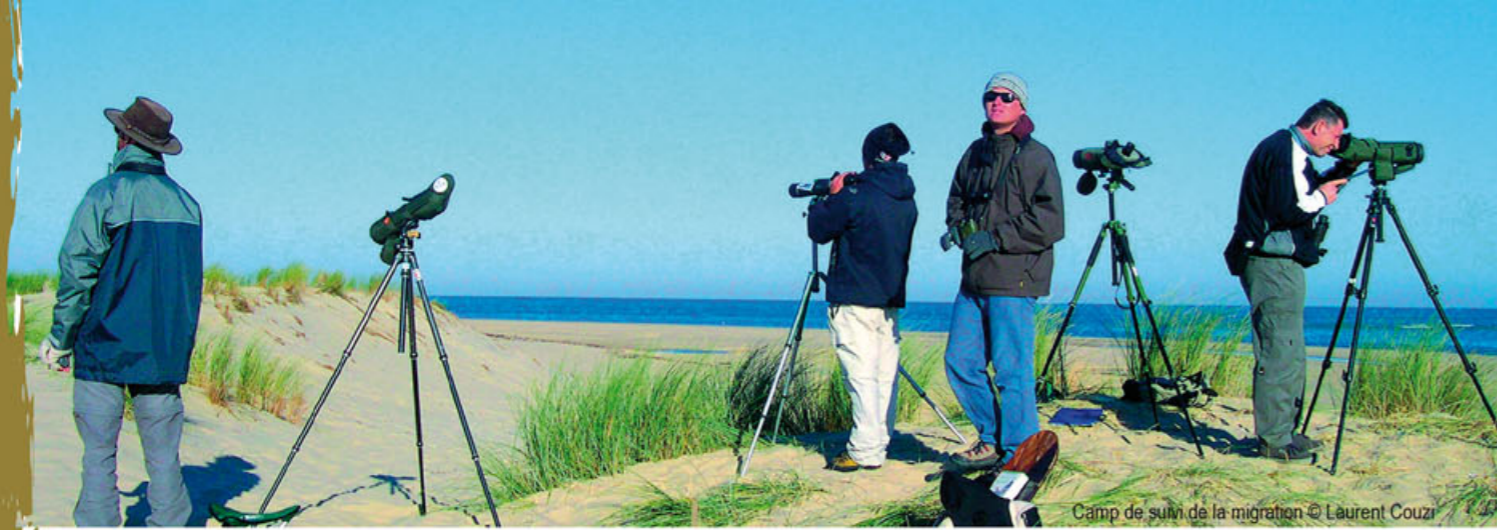
Camp de suivi de la migration