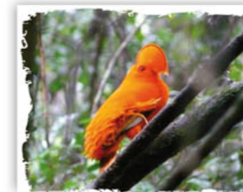
Coq de roche orange

Enfin, cette mission soutient le renforcement du réseau BirdLife dans les pays francophones d'Afrique et le développement des associations naturalistes locales, à travers des projets de conservation de la nature.