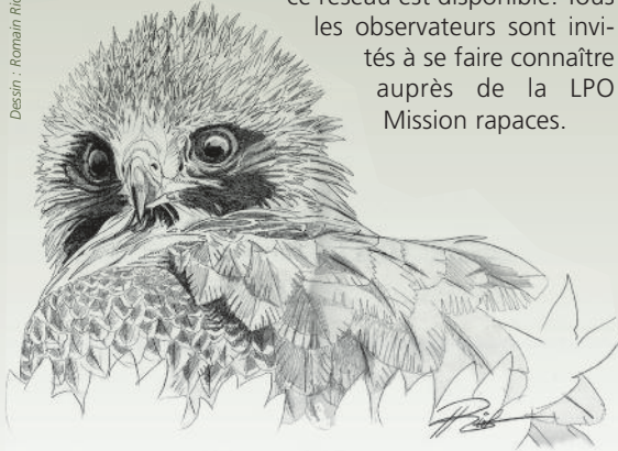
Desin : Romain Riols

Le réseau aigle botté a pour objectif de mieux connaître et comprendre la répartition, les effectifs et la dynamique de l'espèce en France. Le réseau ONF est sollicité pour améliorer ces connaissances générales. Ce réseau souhaite également promouvoir des suivis et des études sur la sensibilité de l'espèce, l'habitat, le régime alimentaire, les causes de mortalité, etc. Le premier bulletin de ce réseau est disponible. Tous les observateurs sont invités à se faire connaître auprès de la LPO Mission rapaces.