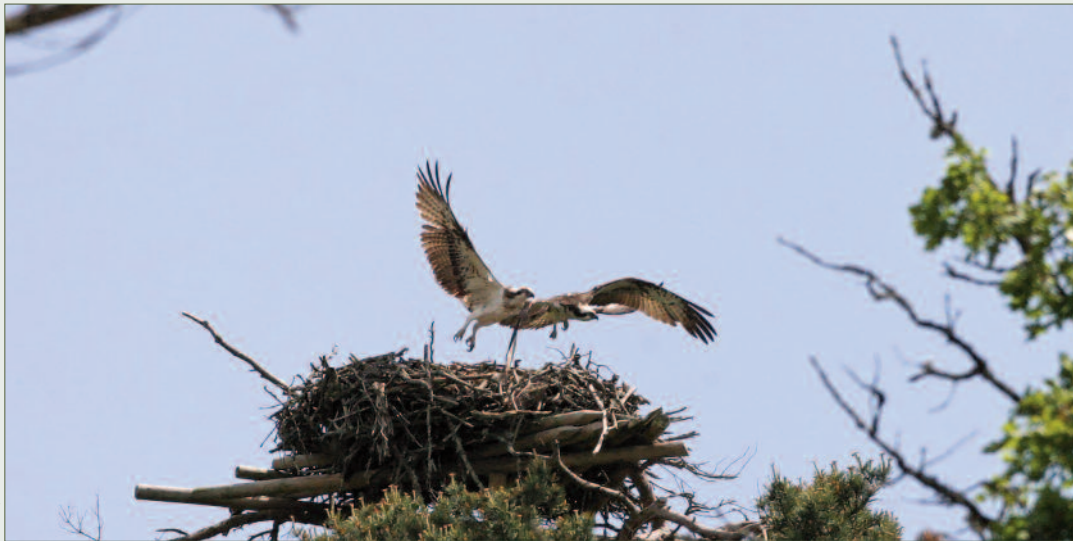
Balbuzards pêcheurs chambourdin

Ce grand rapace cosmopolite, piscivore affirmé, a failli disparaître du territoire métropolitain en tant que reproducteur au début des années 70. Des quelques couples rescapés en Corse, la situation s'y est depuis progressivement améliorée sous la surveillance du PNR Corse et de la Mission rapaces de la LPO.