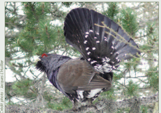
Grand tétras mâle

Anne-Sophie Hesler anne-sophie.hesler@lpo.fr