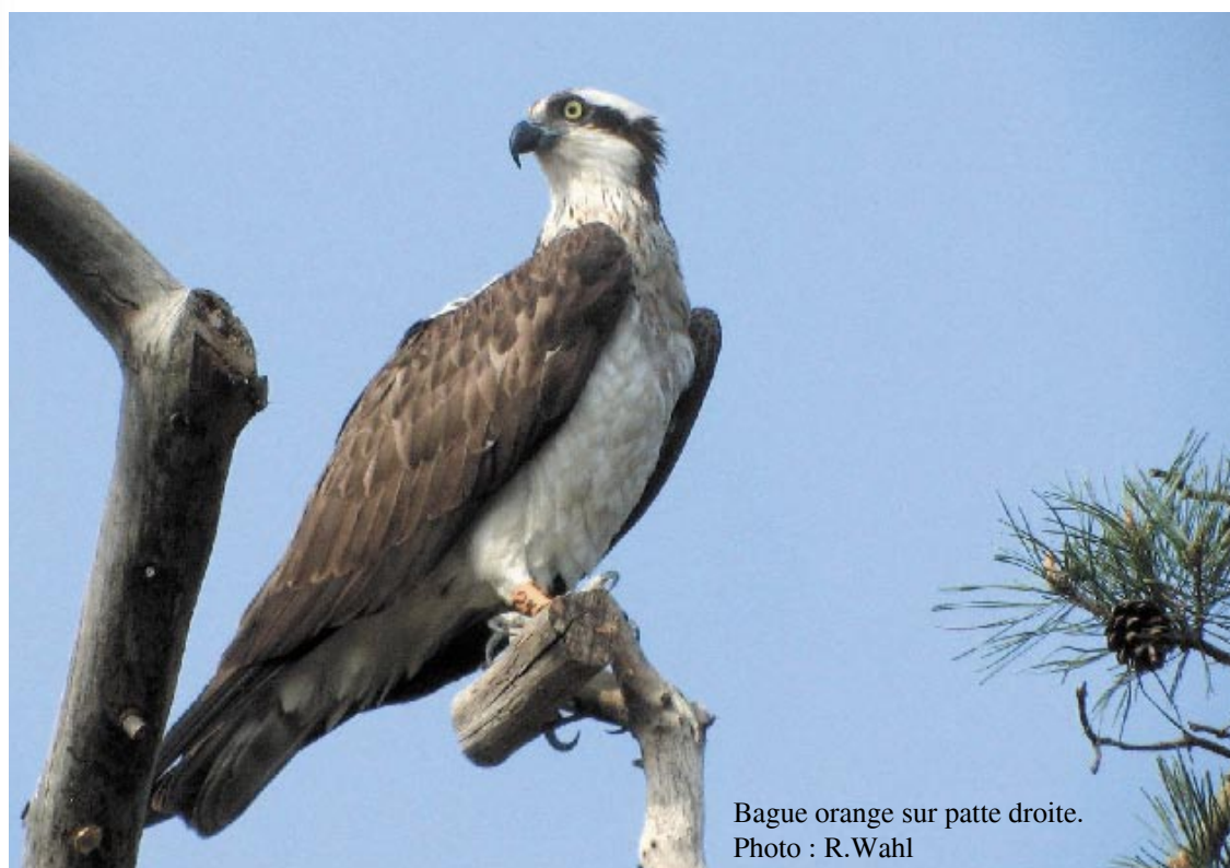
Bague orange sur patte droite.