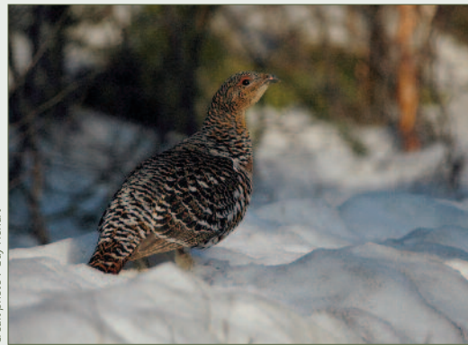
Grand tétras femelle

Oiseau très discret des forêts de montagne, cet oiseau majestueux est présent en France sur les massifs des Vosges, du Jura, des Pyrénées, et des Cévennes où il a été réintroduit dans les années 1970. L'espèce a disparu des Alpes où il était présent en Savoie et Haute-Savoie, dans les années 2000. Ses effectifs et son aire de répartition ont fortement diminué au cours des 30 dernières années, particulièrement dans les Vosges et le Jura. On estime sa population actuelle à 4 500 individus, dont 90 % subsistent dans la chaîne pyrénéenne.