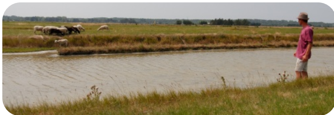
Corentin et ses brebis

- accueil des enfants : une équipe de motivés prendra en charge les enfants pour des occupations ludiques et culturelles en lien avec le thème de la journée