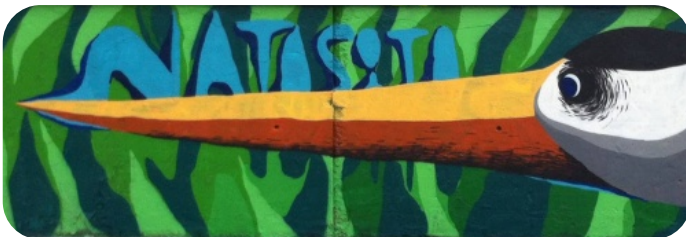
Héron © Natosito

- "street art" : un artiste sera présent pour réaliser une fresque