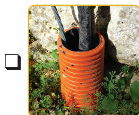
Manchon de protection des jeunes pousses