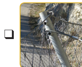
Poteau de filets anti-éboulement, anti-dispersion