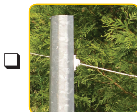
Poteau supportant un fil