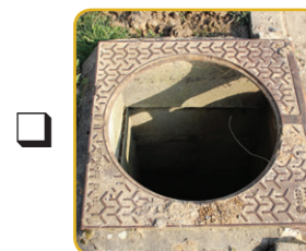
Cavité ou trou au ras du sol