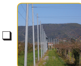
Poteau de plantation