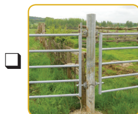
Poteau de clôture