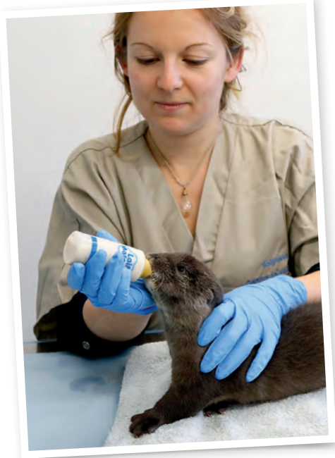
Loutre en soins