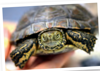
Émyde lépreuse en soins

Entretien des 2 Unités Mobiles de Soins de la LPO qui permettent d'accueillir plusieurs centaines d'oiseaux. Coût: 5 000 € par an