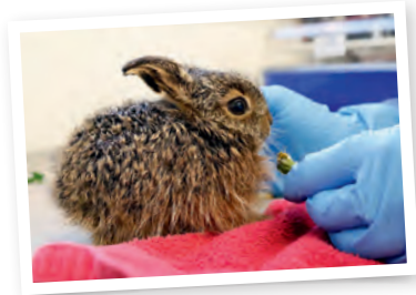
Levreau en soins

Sensibiliser le grand public sur les premiers gestes et les moyens préventifs.