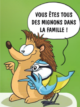
Le hérisson à grandes oreilles (Hemiechinus auritus)