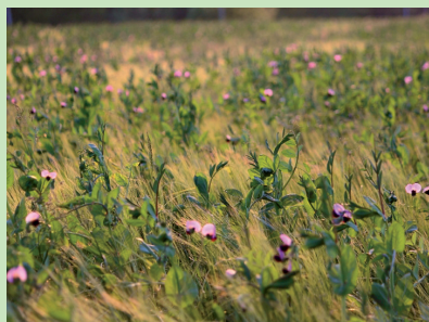
Parcelle de céréales et légumineuses (POIS) en mélange, près de Sourcieux-les-Mines (69210 - Rhône)

Adopter les associations végétales implique une rupture forte par rapport aux pratiques actuelles, elle complexifie les itinéraires techniques. Quels services sont apportés par cette complexification ?