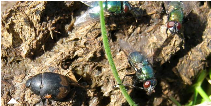
Mouches puis coléoptères (ici un Hydrophile ) : premiers insectes à arriver sur les bouses.

Tout est affaire d'équilibres assez subtils, impliquant de multiples facteurs : milieu, animal, nature et nombre de parasites, type de production, objectifs de l'éleveur, etc. Les réponses ne peuvent pas être univoques. Les traitements systématisés, comme les mesures d'interdiction drastiques, ont des effets pervers à plus ou moins long terme. Quant aux médecines complémentaires, elles ne proposent hélas pas de solutions efficaces. Quelques pistes pour la lutte contre les strongles concernent les plantes à tanins. Certaines huiles essentielles éloignent les diptères. Mais les solutions pratiques pour permettre leur utilisation manquent encore, laissant le champ de la recherche largement ouvert dans ce domaine.