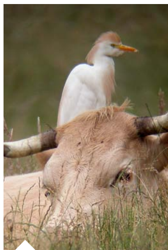
Le héron garde-boeuf, observé souvent près des troupeaux, est perçu comme un agent de lutte biologique contre les parasites du bétail.

Il s'agit de concilier à la fois les intérêts économiques et sanitaires des éleveurs et les intérêts écologiques des milieux naturels dans une démarche commune, avec la mise en place d'une politique de gestion des parasitoses des ruminants d'élevage qui soit durable et globale sur le territoire. Il ne s'agit pas de supprimer le traitement du bétail mais de l'adapter pour en limiter, voire supprimer l'impact. Il convient ainsi de s'interroger sur les pratiques actuelles, en réduisant l'utilisation systématique et préventive de molécules à large spectre impactant une faune non-cible essentielle pour la fonctionnalité des écosystèmes, en raisonnant leur utilisation, en privilégiant aussi des médicaments faiblement écotoxiques à condition qu'ils soient efficaces. L'utilisation trop systématique et répétée des mêmes molécules conduit au développement de résistances chez les parasites, avec le risque de limiter prématurément l'efficacité thérapeutique de molécules particulièrement performantes. Une telle stratégie de lutte doit être basée sur un audit du risque parasitaire de l'exploitation et sur une définition locale des enjeux écologiques.