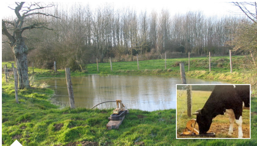
Cet aménagement avec une pompe de prairie rend possible le maintien des mares, petites zones humides riches en terme de biodiversité, et leur utilisation par les éleveurs (eau gratuite qui ne nécessite pas de transport).

Le premier objectif fondamental est d'entretenir un bon état général des animaux et de leur fournir une ration équilibrée. L'impact du parasitisme, qui accapare une partie des ressources nutritionnelles et diminue la résistance aux maladies microbiennes, est d'autant plus important que les animaux sont déjà carencés en nutriments, énergie, vitamines, minéraux ... Inversement, un traitement antiparasitaire seul, dans une situation détériorée sur le plan de l'hygiène ou de la nutrition, n'aura qu'un