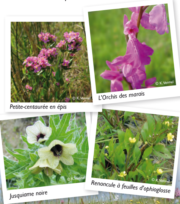
Petite-centaurée en épis