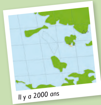
Il y a 2000 ans