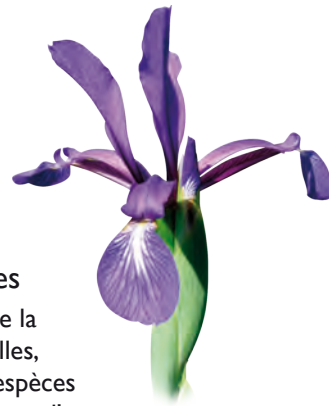
Iris maritime

Les marais sub-tourbeux, les prairies sableuses constituent les biotopes les plus originaux. Ils représentent des échantillons intacts de milieux littoraux en voie de régression ou de disparition sur les côtes centre-atlantiques.