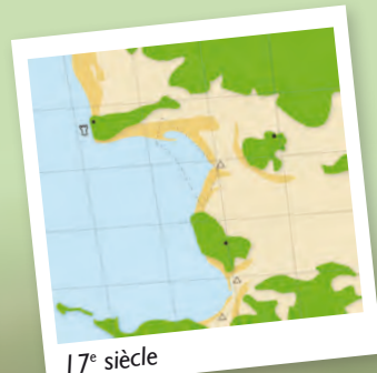
17 e siècle