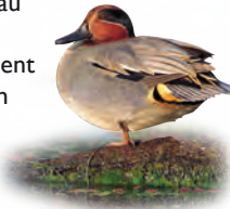
Sarcelle d'hiver

• Le fonctionnement hydraulique de la réserve se calque sur le fonctionnement naturel du marais: un niveau d'eau élevé en hiver sur toute la réserve, puis une baisse régulière à partir du printemps, jusqu'à atteindre un assec quasi-total au milieu de l'été, sur certains plans d'eau. Cette maîtrise des niveaux d'eau est possible grâce à des ouvrages (buses et clapets), positionnés aux extrémités des canaux sillonnant la réserve. Ils permettent, ou empêchent le passage de l'eau selon les besoins des espèces animales et végétales. La gestion hydraulique fait également appel à une pompe photovoltaïque. Ainsi, en hiver, les niveaux d'eau sur la lagune sont maintenus volontairement importants pour favoriser le stationnement des oies, des canards, et autres nombreux limicoles. Au printemps, l'apport d'eau sur la lagune, crée des conditions plus favorables à la nidification des Echasses blanches et des Avocettes élégantes, et évite l'assèchement estival.