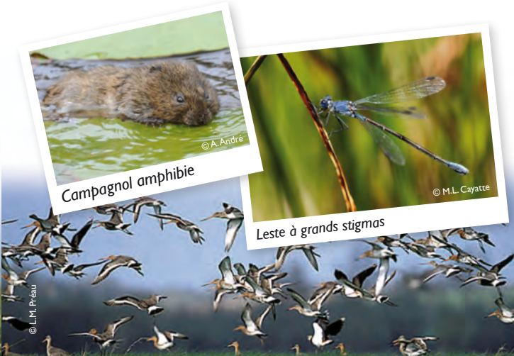
Campagnol amphibie