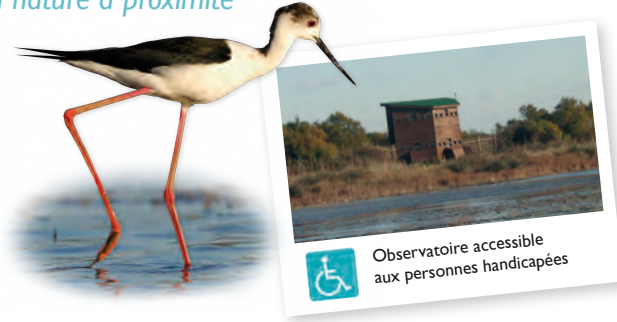
Echasse blanche

Observatoire accessible aux personnes handicapées