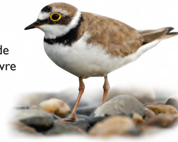
Petit gravelot