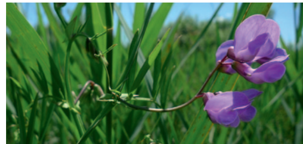
La Gesse des marais recolonise l'Anglade après en avoir presque disparu

Autrefois, le marisque servait en litière, en toitures... usages disparus de longue date. La dynamique végétale naturelle a repris le dessus : cette plante herbacée atteignant 2 m de haut, est devenue dominante, éliminant peu à peu les espèces fragiles et rares.