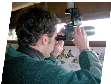
Intérieur de l'observatoire ornithologique de la réserve naturelle nationale «Michel Brosselin» de Saint-Denis-du-Payré.