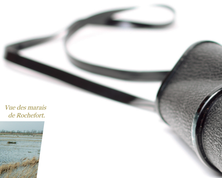
Vue des marais de Rochefort.