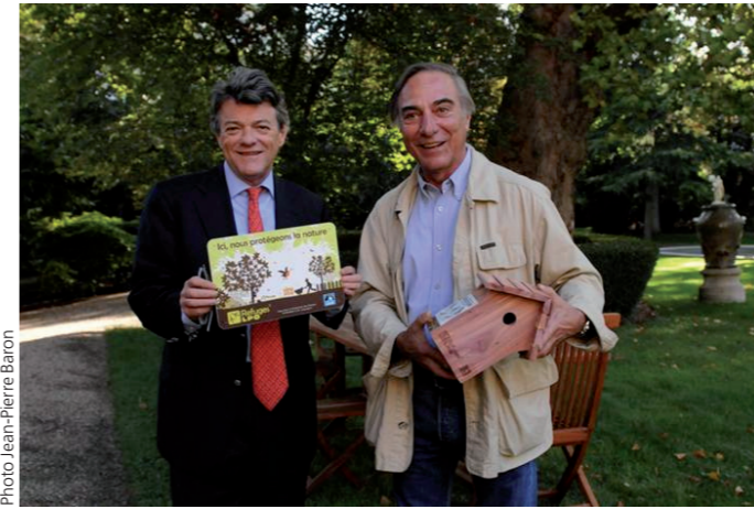
Jean-Louis Borloo et Allain Bougrain Dubourg, lors de la mise en Refuges LPO des jardins du ministère de l'Écologie.

La Poste, en partenariat avec le magazine Image & Nature et la LPO, vient d'éditer 10 000 exemplaires un collecteur de 10 timbres oiseaux vendu dans les bureaux de Poste du Poitou-