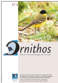
Pages 201 à 288 = n° 27-4