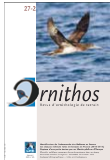
Pages 73-136 = n° 27-2