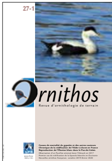
Pages 1 à 72 = n° 27-1

Wroza S. – Un Pouillot oriental Phylloscopus orientalis en 2017 dans l'Hérault : première mention française documentée de l'espèce . . . . . 68-71