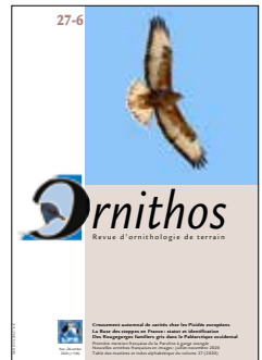
Pages 345 à 400 = n° 27-6