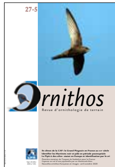
Pages 289 à 344 = n° 27-5