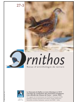
Pages 137 à 200 = n° 27-3