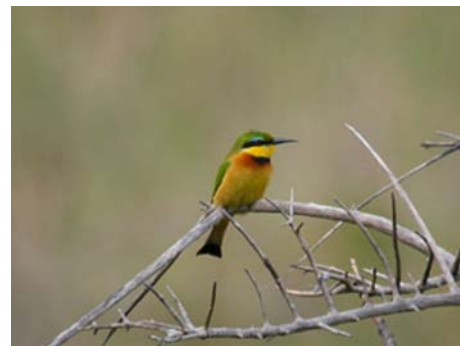
Guêpier nain ( Merops pusillus )

Mammifères : rhinocéros blanc, mangue rayée, vervet, singe de Samango, gnou noir, cobe à croissant, céphalophe du Natal, grand koudou, rhebuck, guib harnaché, zèbre de Burchell, hippopotame, phacochère, buffle, grands dauphins, baleine à bosse.