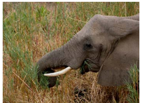
Elephant d'Afrique (Loxodonta africana)

Obs. principales : héron strié, bihoreau, cigogne noire, vautour oricou, aigle des steppes, ravisseur, francolin du Natal, outarde houpette, vanneau à tête blanche, perroquet à tête brune, martinet des palmes, martin-pêcheur géant, guêpier d'Europe, calao à bec rouge, barbican pie, alouette sabota, cratérope fléché, merle litsipsirupa, camaroptère à dos gris, gladiateur souffré, choucadore de Burchell, amarante du Sénégal, beaumarquet melba.