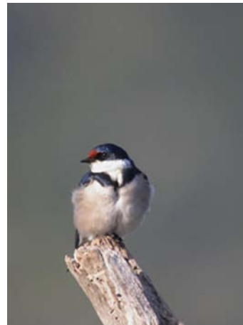
Hirondelle à gorge blanche ( Hirundo albigularis )