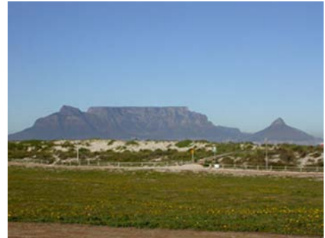
Table Mountain- Capetown