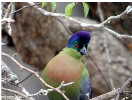
Touraco à huppe splendide ( Musophaga porphyreolopha )