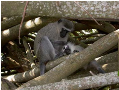
Vervet (Cercopithecus aethiops)

Très peu différente de l'Europe, à base de beaucoup de viande grillée, au demeurant très bonne. Les blancs sont des inconditionnels du barbecue, et tous les emplacements de campings ont le leur. Les repas au restaurant sont très copieux (300 à 500 gr de viande !) et beaucoup moins cher qu'en France (env. 25.00 euros pour 2). Des supermarchés sont présents dans toutes les villes et très bien achalandés, y compris en produits lyophilisés. Les villes du bord de mer ont également beaucoup de poissons. Des bouteilles de gaz (Butagaz) sont trouvables dans les magasins Game, un genre de magasin fourre-tout. Eux-mêmes se trouvent souvent dans des centres commerciaux.