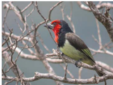
Barbican à collier ( Lybius torquatus )

23/09 : route Himeville-Ste Lucie, avec pique-nique et observations dans la réserve d'Umlalazi, sur la côte. Malheureusement pas de martin-pêcheur des mangroves malgré les recherches. Nuit au camping Sugarloaf à Ste Lucie. Obs. principales : cigogne épiscopale, aigle huppard, sterne voyageuse, barbican à collier, pic laboureur, cossyphé à calotte rousse, sentinelle du Cap, euplecte veuve noire. Mammifères : vervet, céphalophe du Natal, zèbre de Burchell. 24/09 : Journée à Ste Lucie. Matinée de marche sur la « Iphiva trail », puis le long de la plage. Pique-nique devant l'estuaire puis sieste (il fait 36°C !). Observation dans le camping assez riche et sortie en bateau sur le fleuve en fin d'après-midi. Le bateau est très décevant, on ne voit strictement rien de plus que depuis le bord. Et pas de martin-pêcheur des mangroves, il est parti depuis 12 jours! Au camping, nous ferons la seule obs. du séjour du sénégal vert. Au final, il vaut bien mieux payer un guide pour des observations autour de Cape Vidal (les randos seuls sont interdites) que de faire le bateau. Les oiseaux y sont beaucoup plus typiques et présents. Nuit au camping Sugarloaf à Ste Lucie.