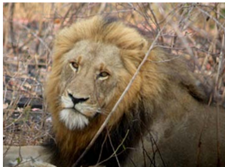
Lion ( Panthera leo )

08/10 : Départ du Kruger pour Jo'burg, en passant par la réserve de Kaapsehoop. Nous passons la matinée dans la réserve de Kaapsehoop à la recherche de l'hirondelle bleue, où il ne reste plus qu'un couple à l'heure actuelle, et 67 individus dans le pays. Nous avons dû attendre 3h avant de pouvoir voir la femelle. Un guide est obligatoire pour circuler dans la réserve. Si l'on a du temps, la réserve accueille quelques espèces intéressantes telles que le trogon narina et le râle à camail. Nous rejoignons ensuite l'aéroport de Johannesburg pour notre retour en France. Départ à 19h20, nuit dans l'avion pour Paris.