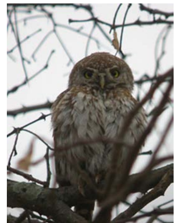
Chevêchette perlée ( Glaucidium perlatum )

Mammifères : genette tigrine, commune, civette, mangouste naine, à queue blanche, écureuil à pattes jaunes, hyène tachetée, céphalophe de Grimm, cobe à