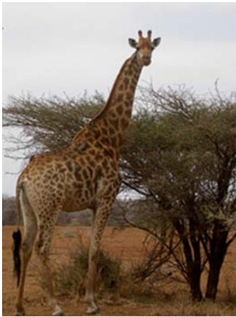
Girafe ( Giraffa camelopardalis )

Obs. principales : anhinga, bec-ouvert, circaète brun, aigle de Wahlberg, outarde kori, perroquet à tête brune, martin-pêcheur géant, brubru africain, choucador à oreillons bleus, de Burchell, souimanga à ventre blanc. Mammifères : lion(7), éléphant, rhinocéros blanc, buffle, girafe, zèbre de Burchell, gnou bleu, impala, koudou, cobe à croissant, steenbok, grysbok de Sharpe, phacochère, écureuil à pattes jaunes, mangouste rouge, babouin, vervet.