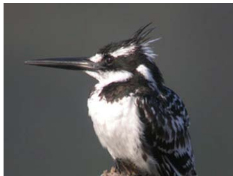
Martin-pêcheur pie (Ceryle rudis)

Mammifères : mangouste jaune, grise du Cap, daman des rochers, springbok, bontebok, élan du Cap, zèbre de montagne, lièvre du Cap, baleine franche.