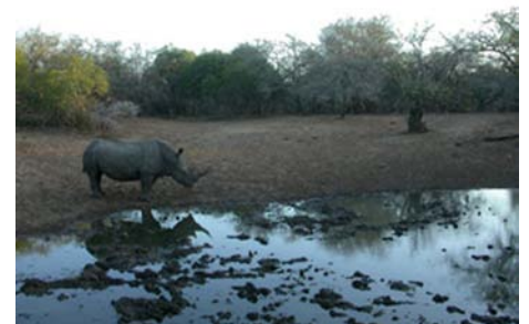
Rhinocéros blanc ( Ceratotherium simum )

Mammifères : rhinocéros blanc, zèbre de Burchell, gnou bleu, impala, nyala, koudou, babouin, vervet, girafe, phacochère, hippopotame, céphalophe de Grimm.