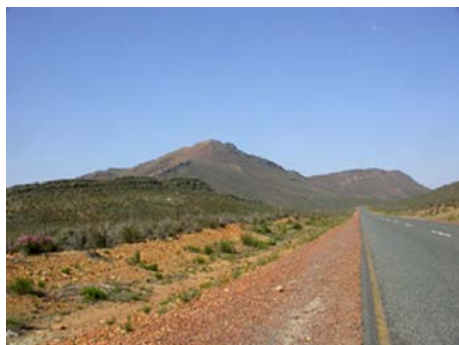
Paysage du Karoo

Obs. principales : anhinga, héron goliath, blongios nain, cigogne noire, talève sultane, autour chanteur pâle, outarde korhaan, tourterelle masquée, grue de paradis, mignard enchanteur, gobe-mouche fiscal, veuve dominicaine, astrild ondulé.