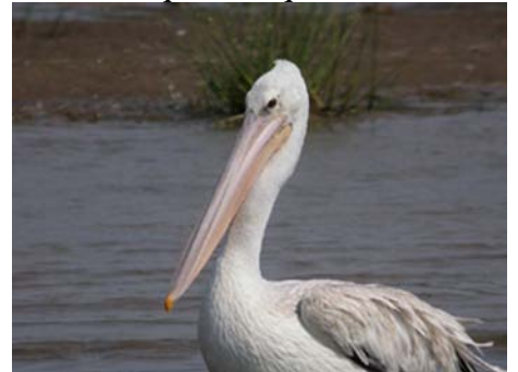
Pélican gris (Pelecanus rufescens)

Mammifères : blesbok, suricate, mangouste jaune.