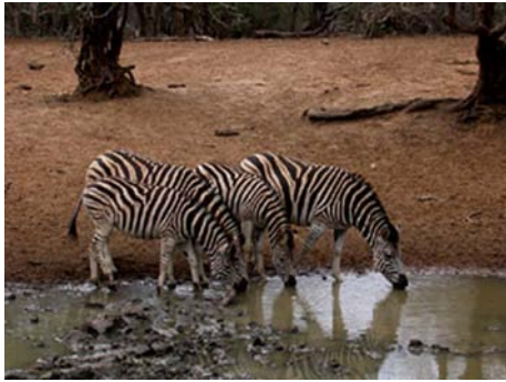
Zèbre de Burchell ( Equus burchelli )

Mammifères : lion(2), zèbre de Burchell, girafe, gnou bleu, cobe à croissant, impala, nyala, koudou, céphalophe de Grimm, rhinocéros blanc, phacochère, hyène tachetée.