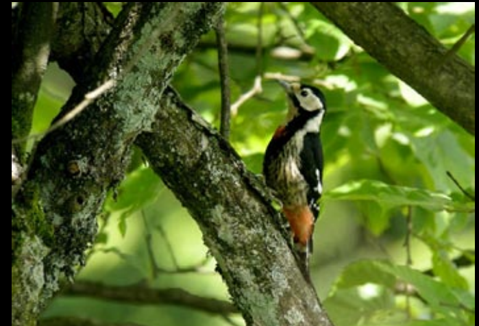
Pic à poitrine rouge vive, 31/05/09, Hunan, Ba da gong shan