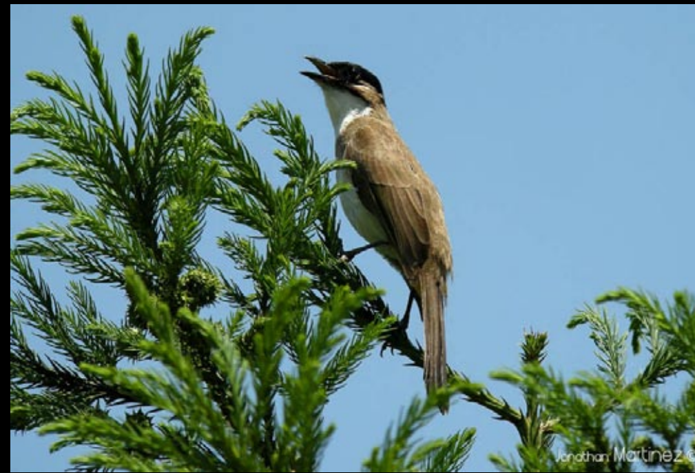
Bulbul à poitrine brune, 03/06/09, Hunan, Zhang Jia Jie