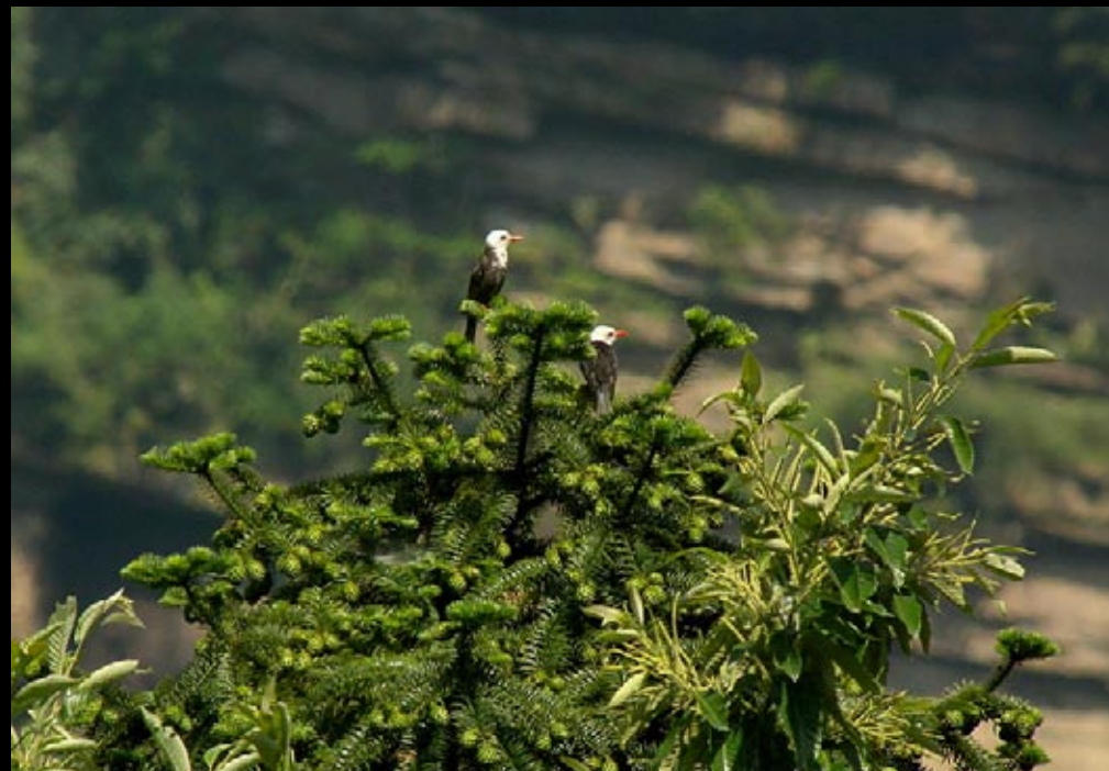
Bulbul noir, 04/06/09, Hunan, Parc des montagnes de Zhang Jia Jie