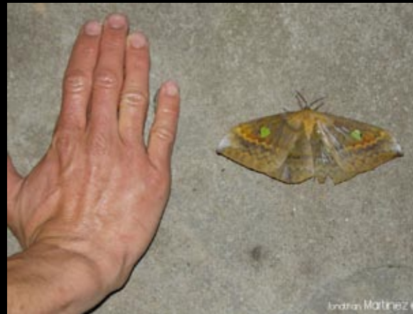
Des papillons de nuit aussi gros que la main...