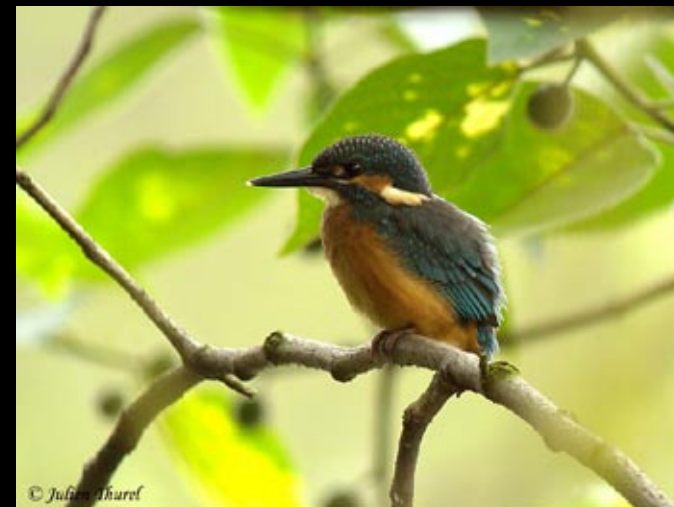
Martin pêcheur, 20/05/09 Hunan, Bin HU