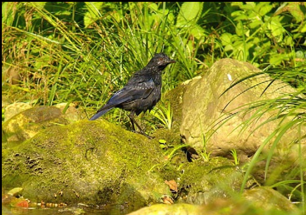
Arrenga siffleur, 04/06/09, Hunan, Parc des montagnes de Zhang Jia Jie