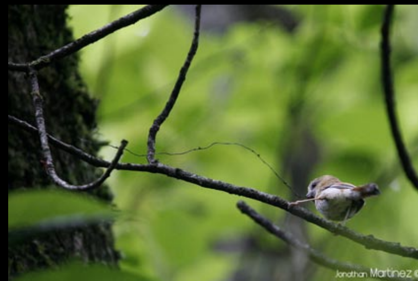
Parodoxornis de Verreaux, 31/05/09, Hunan, Ba da gong shan