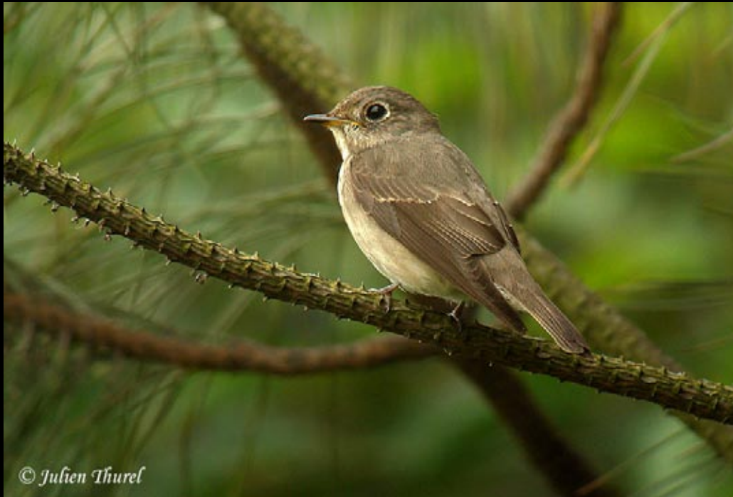
Gobe mouche de la Sibérie, 18/05/09 Hunan, Bin Hu