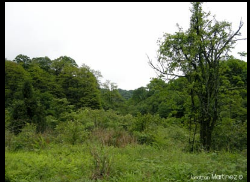
Des milieux super sympas...