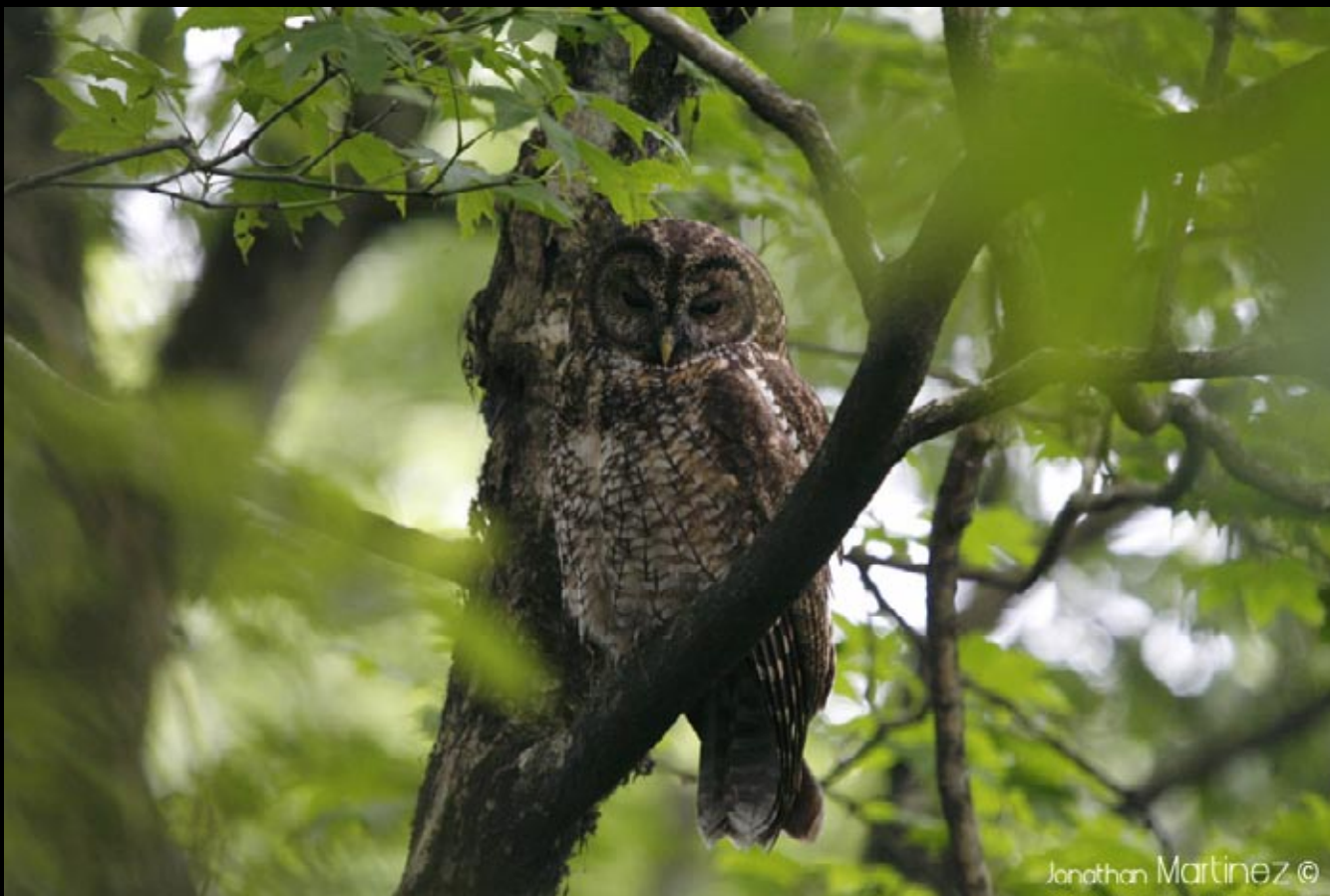
Chouette hulotte de Chine, 31/05/09, Hunan, Ba da gong shan