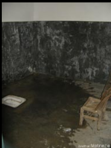
Les toilettes, douches laveries, et sa chaise... tout un pan de culture....