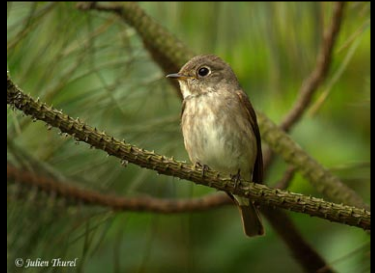
Gobe mouche de la Sibérie, 18/05/09 Hunan, Bin Hu