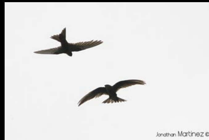
Martinet du Pacifique, 30/05/09, Hunan, Ba da gong shan