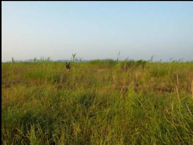
Zone à «fistage» de locustelle.....cherchez pas ce que ça veut dire c'est du Patois Hunanais!