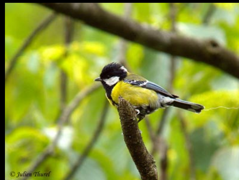
Mésange montagnarde, 02/06/09, Hunan, Ba da gong shan