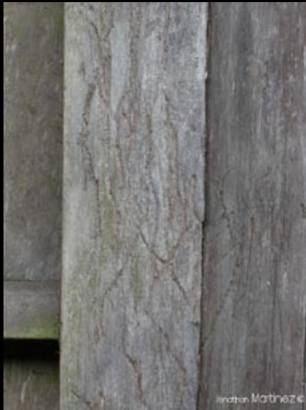
Des griffes d'ours sur les portes des granges...