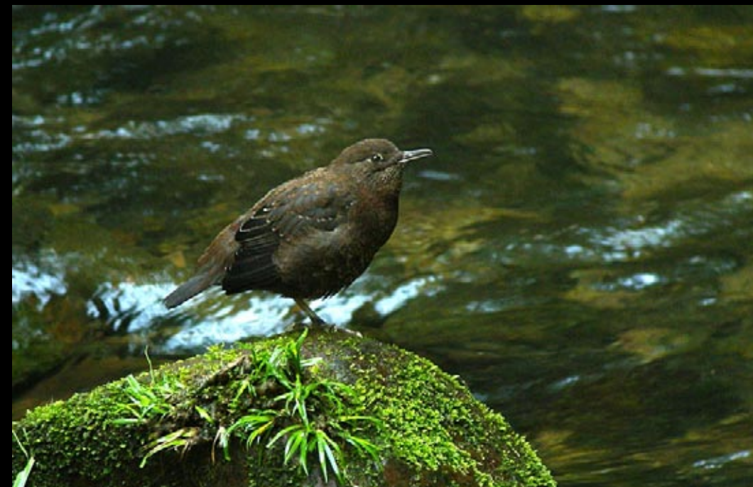
Cingle de Pallas, 04/06/09, Hunan, Parc des montagnes de Zhang Jia Jie