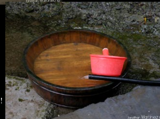
L'eau courante, uniquement s'il y a de l'eau dans la rivière!