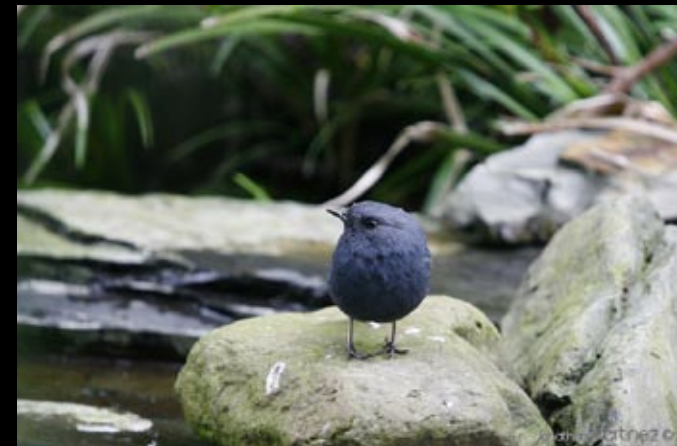
Nymphée fulligineuse, 31/05/09, Hunan, Ba da gong shan