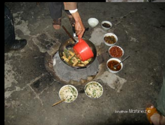
La table de salle à manger et son chauffage intégré, après avoir mangé on pouvait y faire sécher ses chaussettes!!!