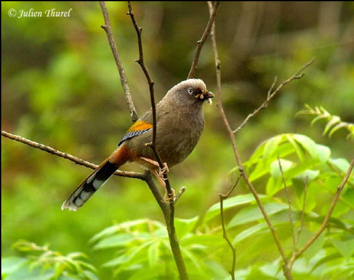
Garrulaxe d'Elioth, 31/05/09, Hunan, Ba da gong shan