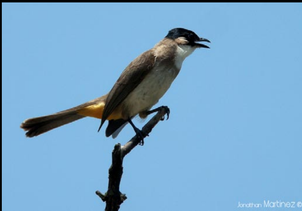
Bulbul à poitrine brune, 03/06/09, Hunan, Zhang Jia Jie