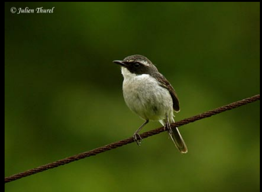
Tarier gris, 30/05/09, Hunan, Ba da gong shan