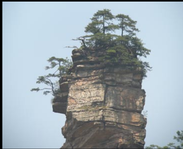
Montagne typique de Zhang Jia Jie...