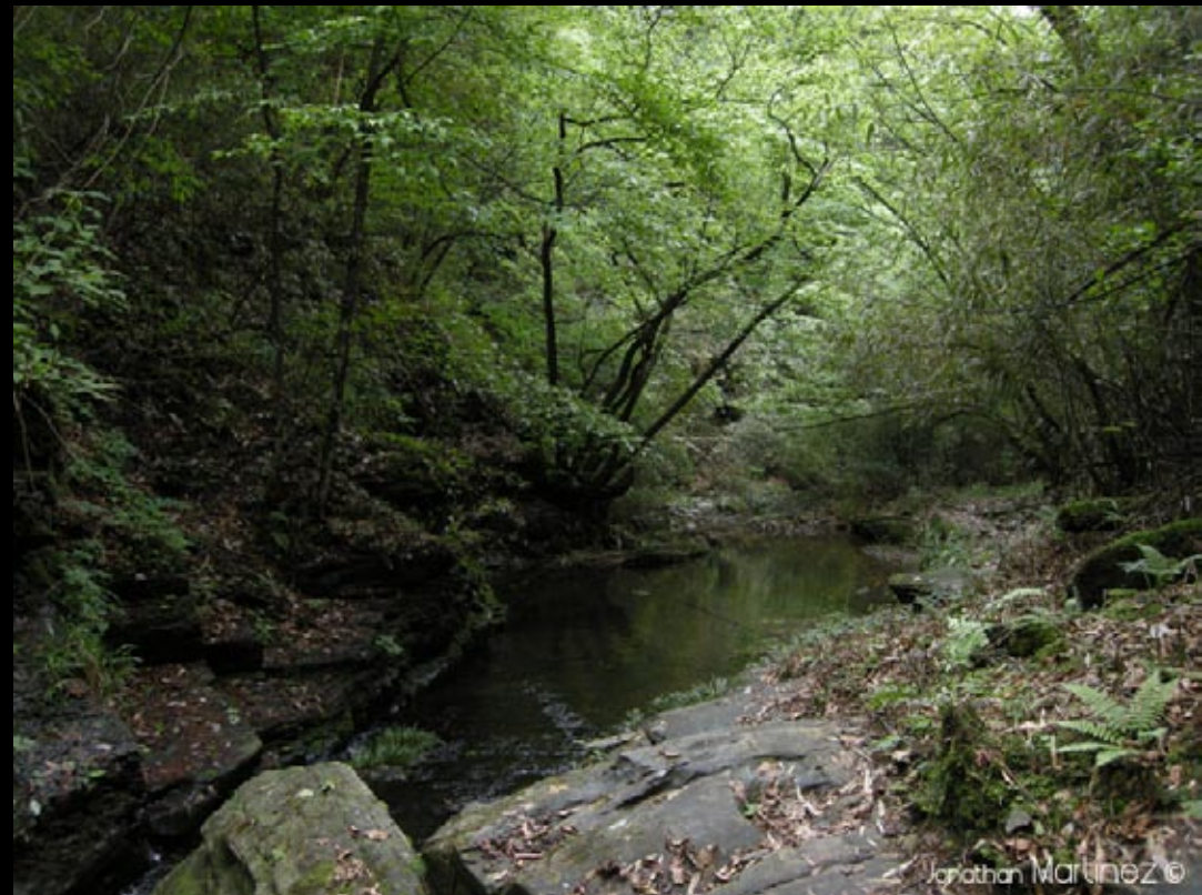
Les torrents de Ba da gong shan, l'univers de la Salamandre géante