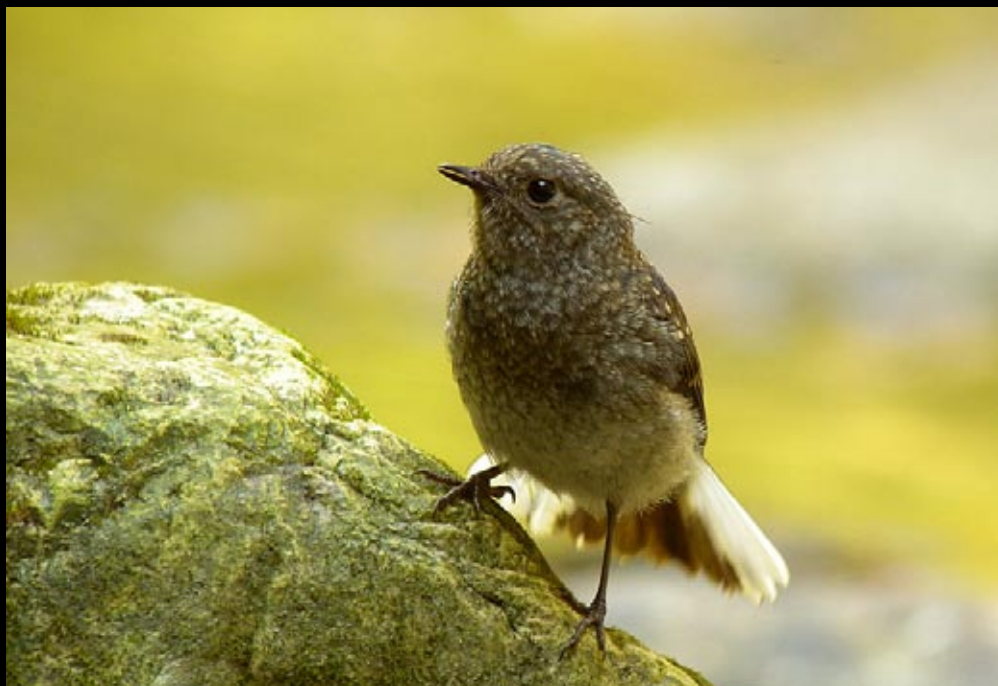
Nymphée fuligineuse, 04/06/09, Hunan, Parc des montagnes de Zhang Jia Jie