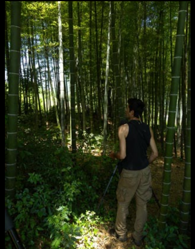
Il est où ce Picumme, b..... de m.....!!!!