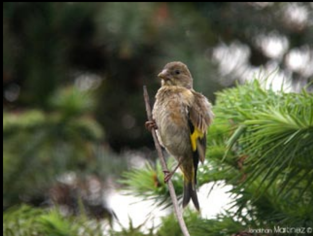
Verdier de Chine, 20/05/09 Hunan, Bin Hu