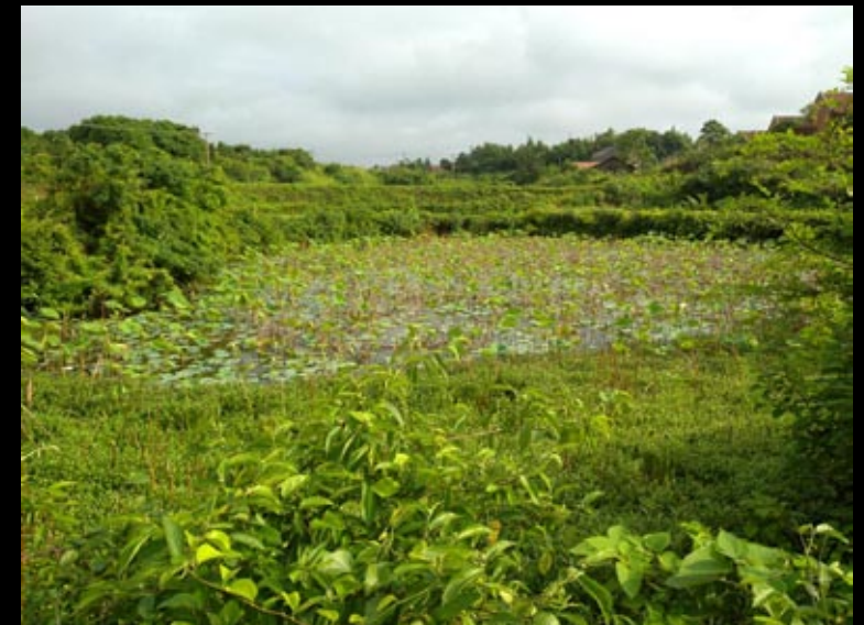
Mare à lotus à Ba Jiao Hu