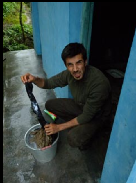
Non, on n'a pas fait que birder comme des sauvages!!!