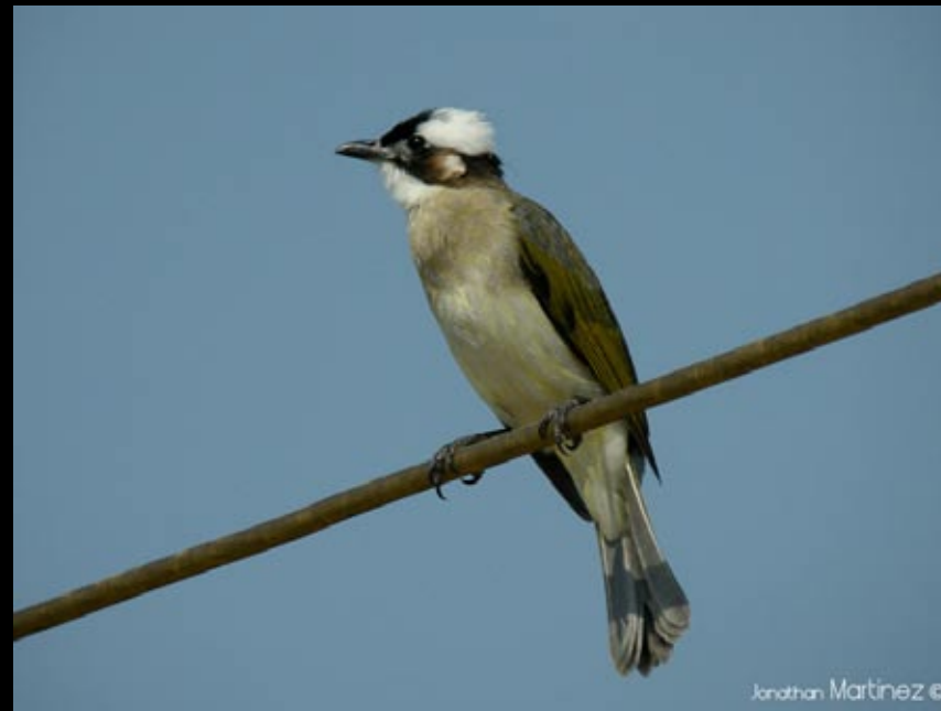
Bulbul de Chine, 06/06/09 Hunan, Ba jiao hu