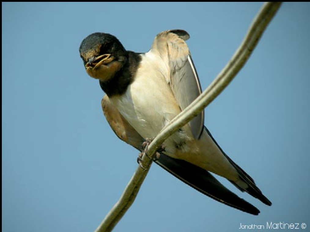
Hirondelle rustique, 06/06/09 Hunan, Ba jiao hu