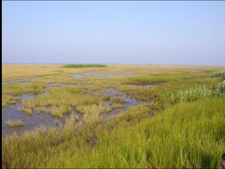
Dong Ding Hu, à gauche.....