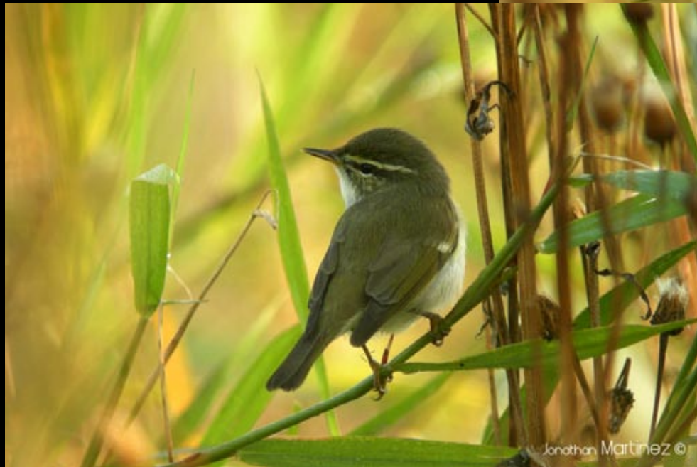
Pouillot boréal, 21/05/09 Hunan, Dong ding hu