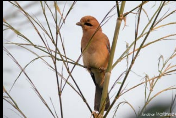
Geai des Chênes «sinensis», 22/05/09 Hunan, Tang wan zu