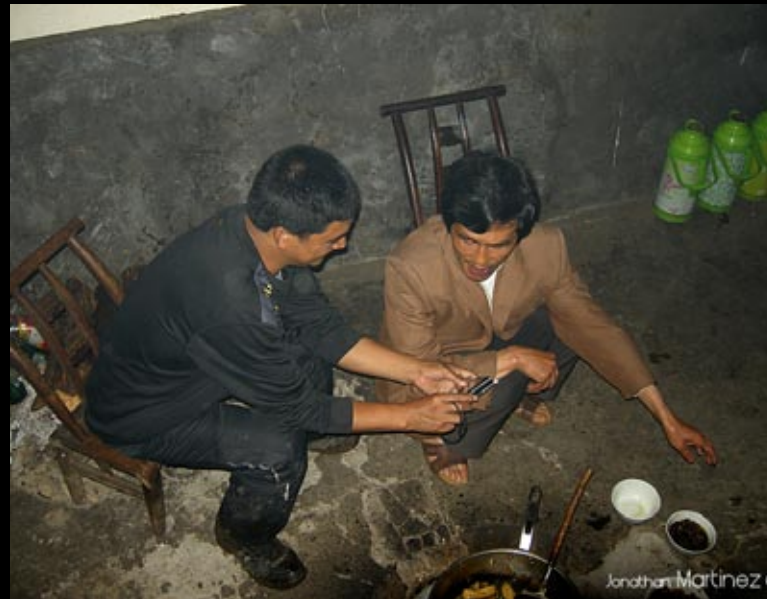
Le soir on compare les digis (ici notre cuisto et notre guide)