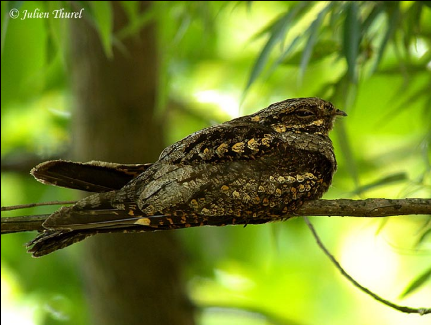
Engoulevent jotaka, 20/05/09, Hunan, Dong Ding Hu