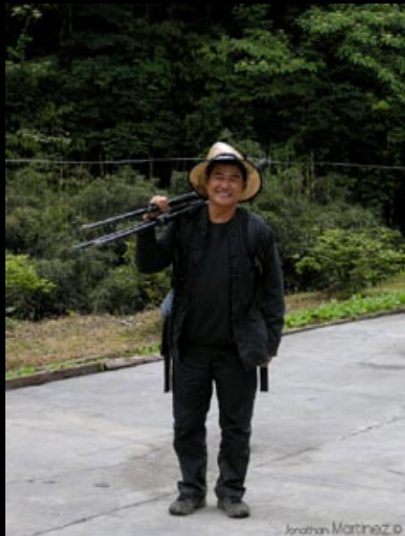
Notre Guide et son éternel bonne humeur