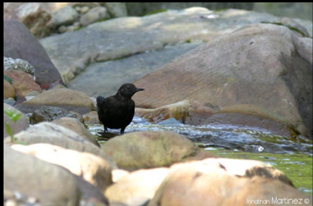
Cingle de Pallas, 03/06/09, Hunan, Zhang Jia Jie