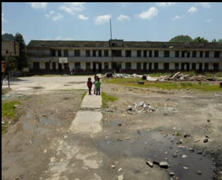
Ancienne école du village de Ba da gong shan, une toute neuve se situe à sa droite