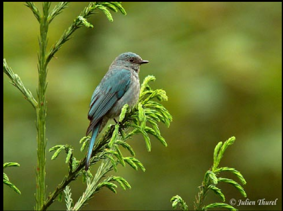
Gobemouche vert-de-gris femelle, 01/06/09, Hunan, Ba da gong shan