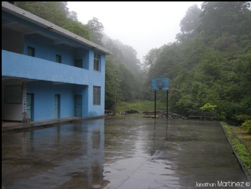
Le dortoir et son terrain de basket