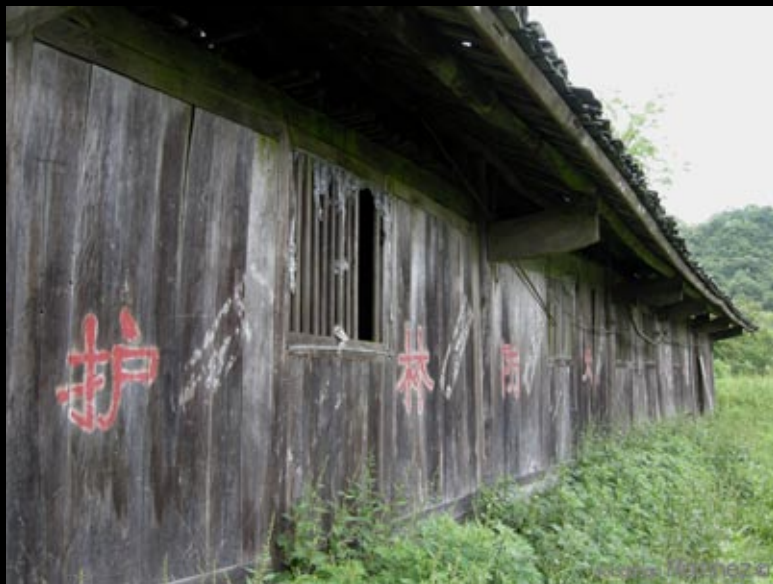
Des granges avec des griffes d'ours sur les portes.... ( je sais je me répète)