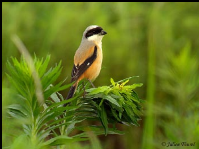
Pie-grièche Schach, mai 2009, Hunan