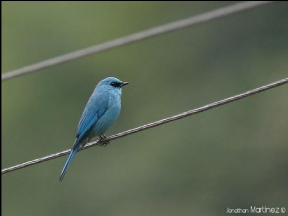
Gobemouche vert-de-gris mâle, 01/06/09, Hunan, Ba da gong shan