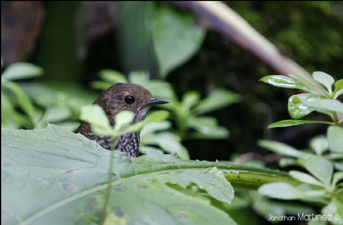
Turdinule maillé, 30/05/09, Hunan, Ba da gong shan