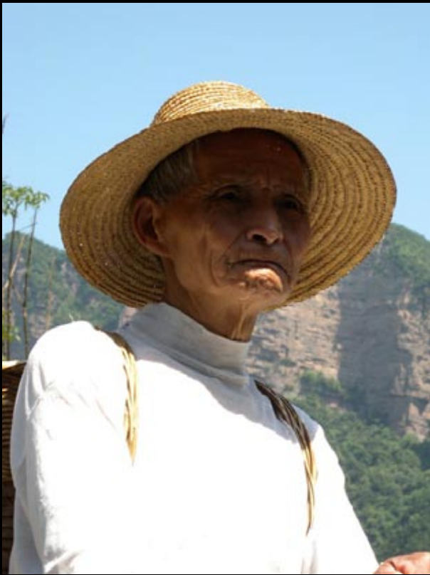
Habitant typique de Zhang Jia Jie...