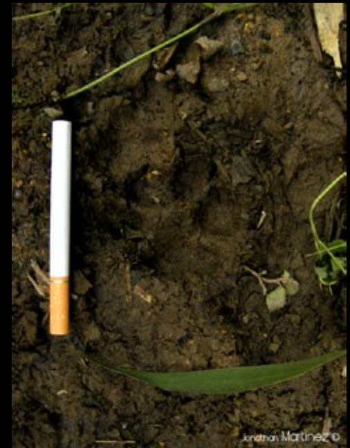
Des gros gros chats qui laisse des traces toutes fraîches ) à moins de 100 mètres du centre...