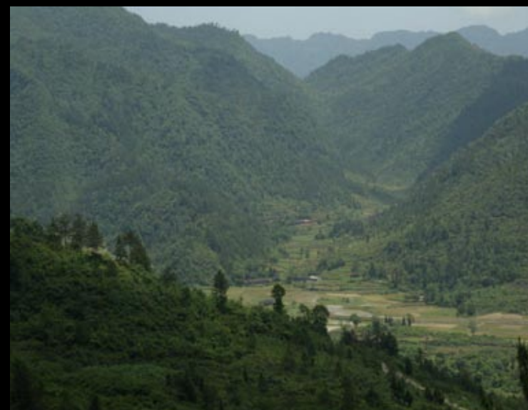
Paysages sur le trajet de Ba da gong shan à Sanzi