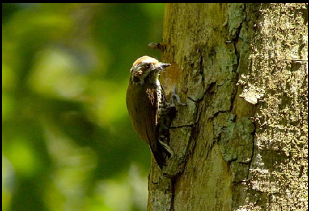
Picumme tacheté, 04/06/09, Hunan, Parc des montagnes de Zhang Jia Jie