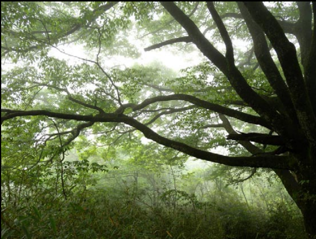
Forêt à 1800 m d'altitude, à la limite du Hupei et du Hunan