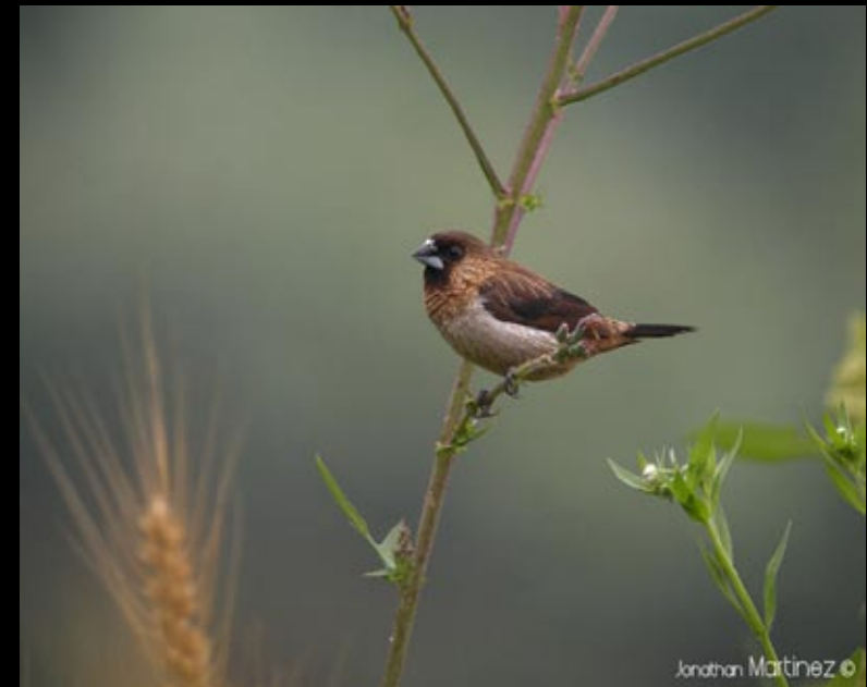
Capucin domino, 20/05/09 Hunan, Bin Hu