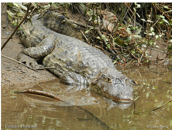
Caïman à lunettes