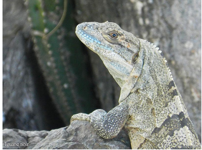
Iguane noir Iguane noir