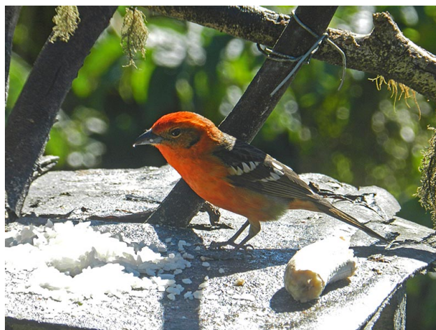
Tangara à dos rayé sur une mangeoire