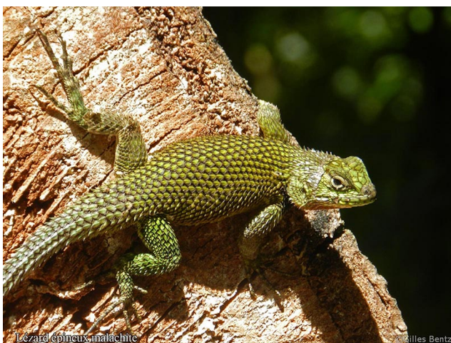
Lézard épineux malachite