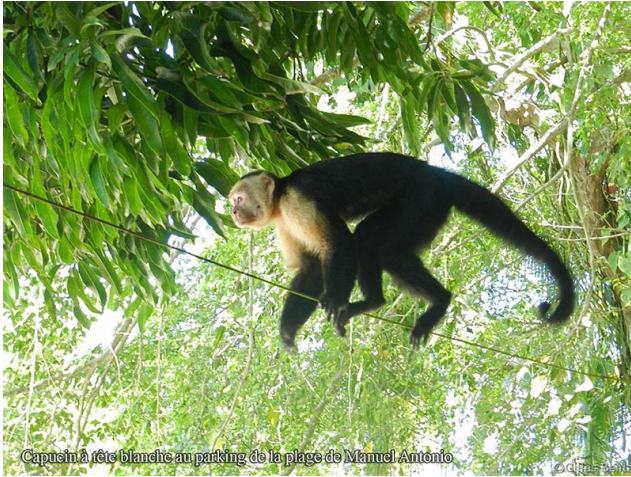
Capucin à tête blanche au parking de la plage de Manuel Antonio Capucin à tête blanche