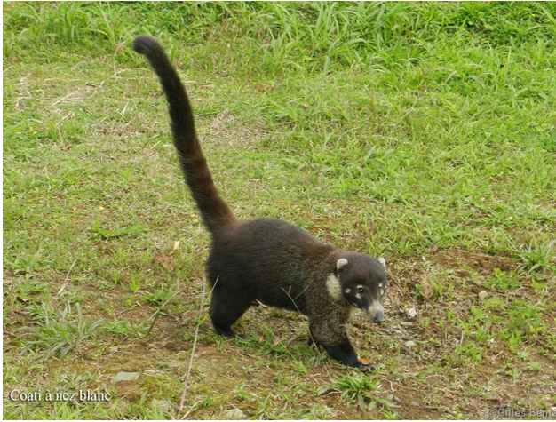
Coati à nez blanc