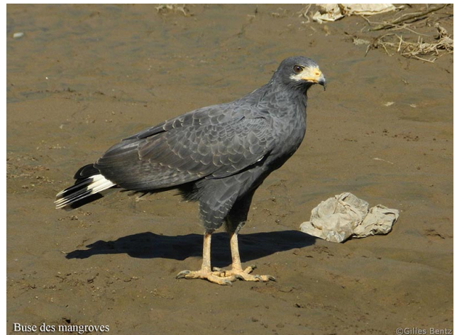
Buse des mangroves