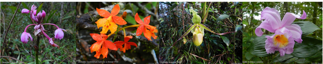
Orchidées dans le sentier Arenal 1968