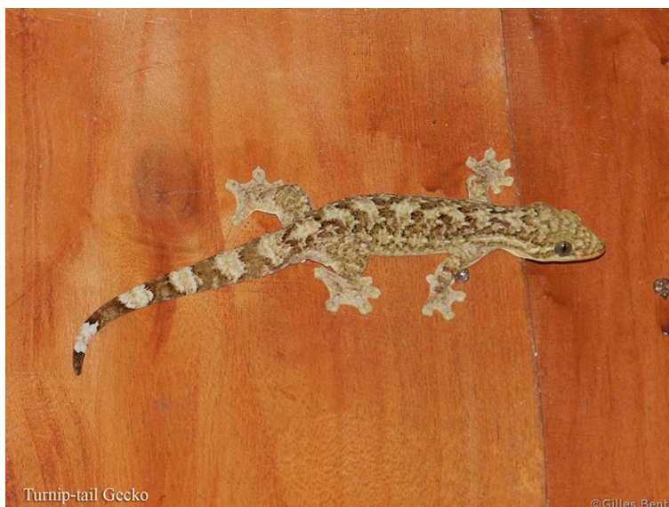
Grand gecko « Turnip-tail » sur la cabina de La Ceiba Ecoadventures à Platanillo.