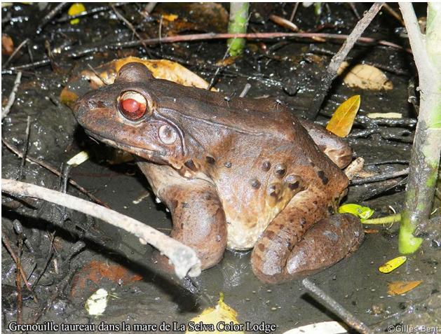
Grenouille taureau dans la mare de La Selva Color Lodge