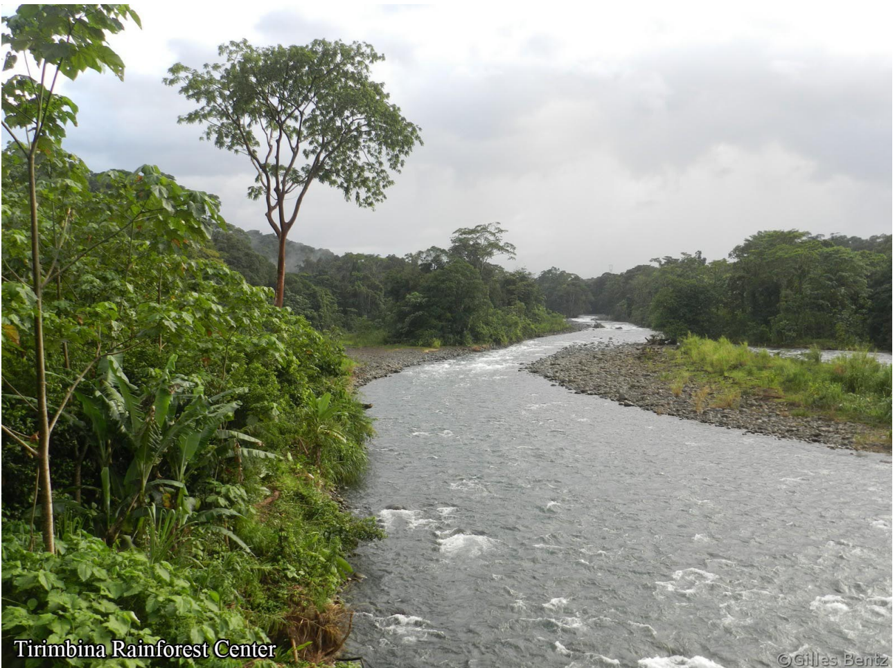
Tirimbina Rainforest Center