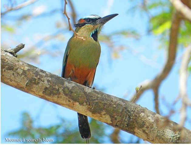
Motmot à sourcils bleus Motmot à sourcils bleus