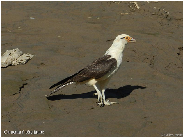
Caracara à tête jaune