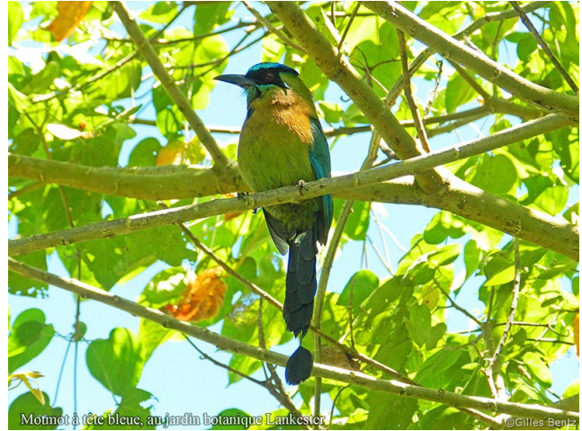
Motmot à tête bleue