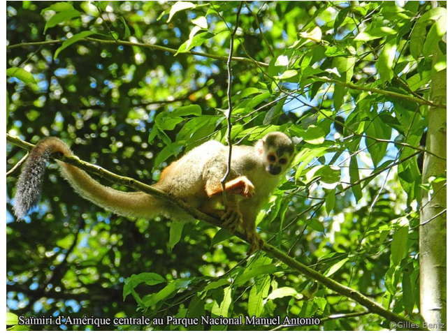
Saïmiri d'Amérique centrale au Parque Nacional Manuel Antonio Saïmiri d'Amérique centrale