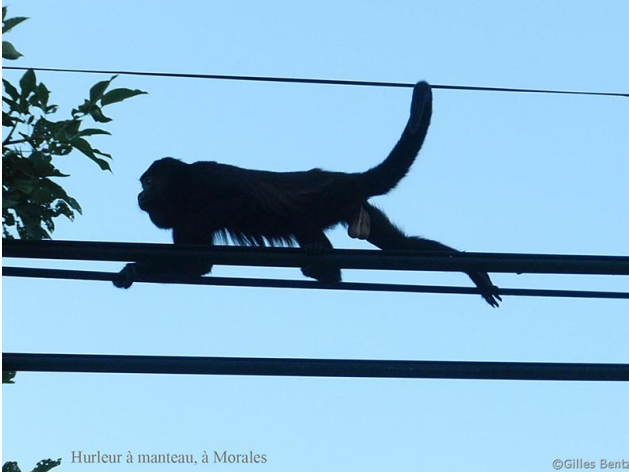
Hurleur à manteau, à Morales