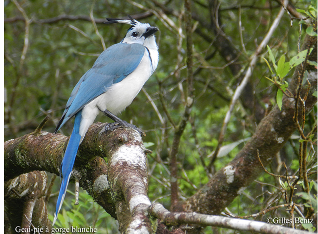
Geai-pie à gorge blanche