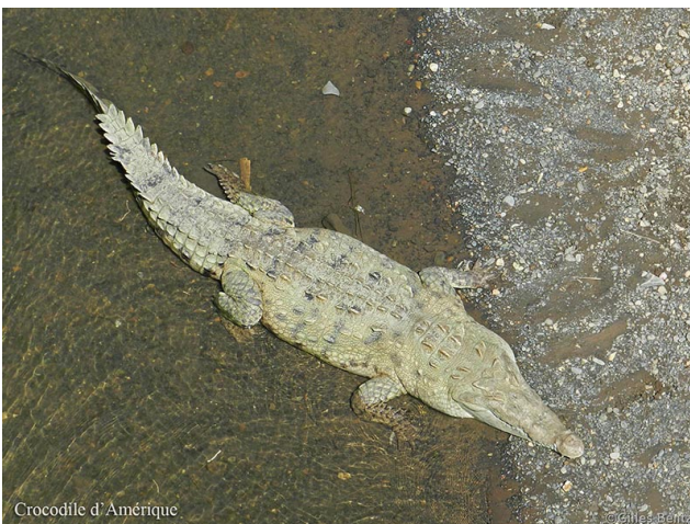
Crocodile d'Amérique Crocodile d'Amérique