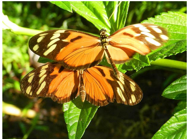
Heliconius ismerius clarescens