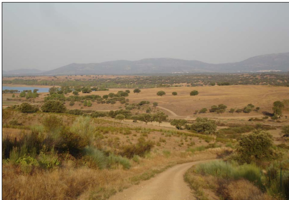
Embalse de Borbollón, Estrémadura