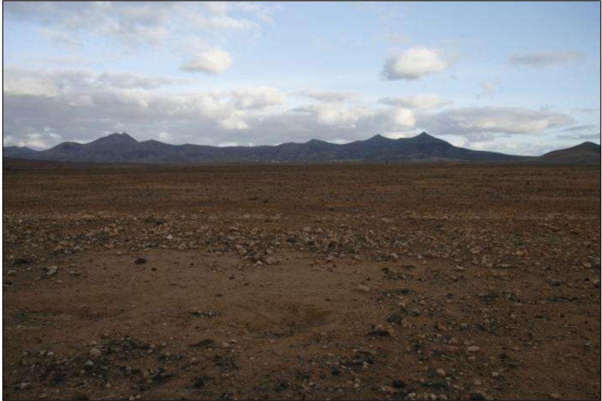
Couleurs de fin de journée à Las Parcelas