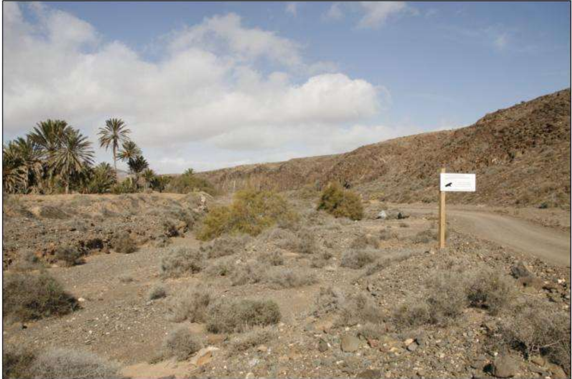
Réserve ornithologique du Barranco de la Torre, Salinas del Carmen