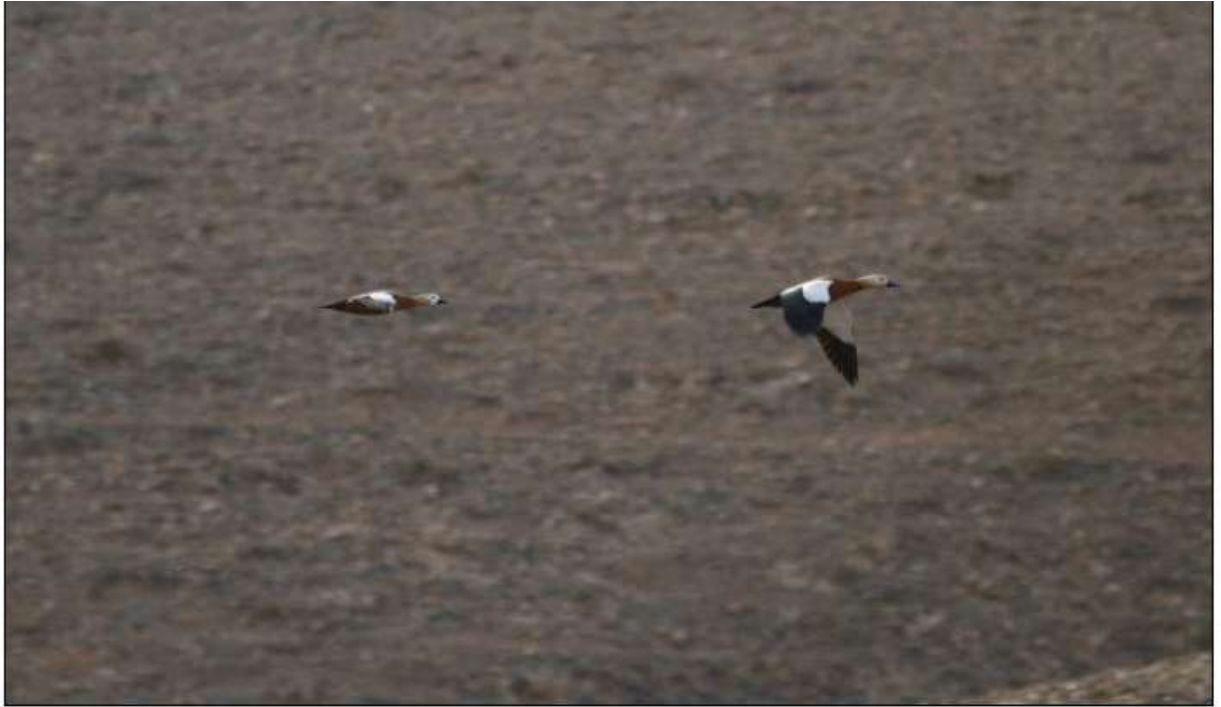
Tadornes casarca, Los Molinos