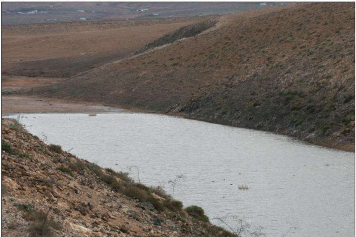
Retenue de Los Molinos, le seul plan d'eau permanent de l'île