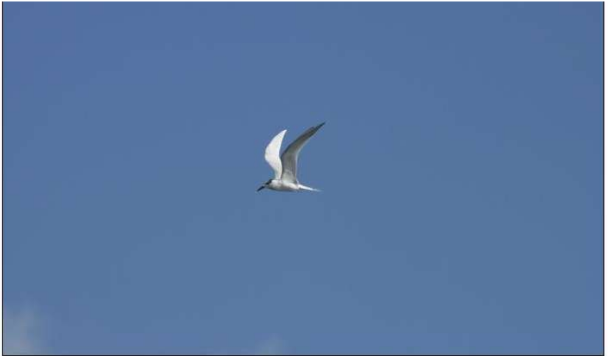
Sterne caugek, Caleta de Juste