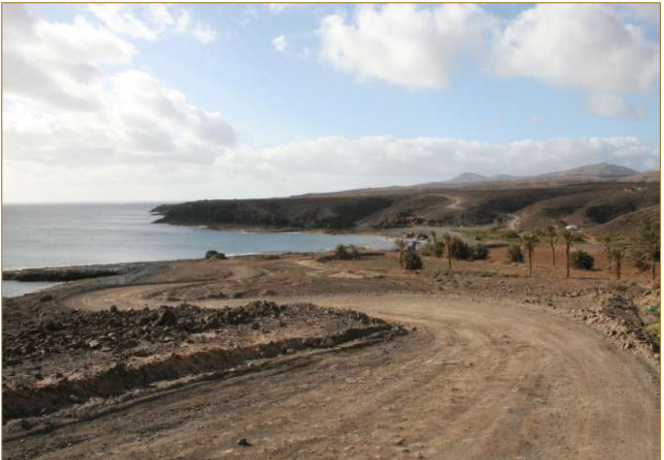
Embouchure du Barranco de la Torre, Salinas del Carmen (Côte Orientale)

Yohann BROUILLARD (textes)