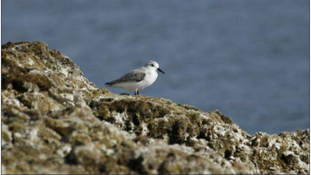
Bécasseau sanderling, Caleta de Fuste