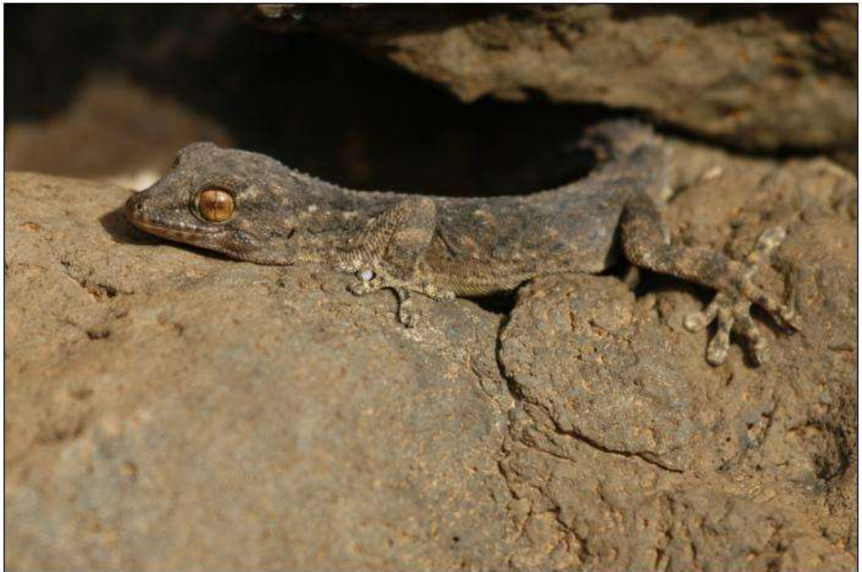
Gecko ou Tarente, espèce indéterminée, Los Molinos

Le 8, Aurore observe et photographie cet animal (voir photo ci-dessous) dans les enrochements de la rive orientale du barrage de Los Molinos. Faute de référence, nous n'avons pas, pour le moment, pu identifier cette espèce.