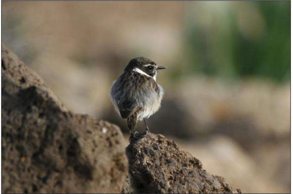
Jarier des Canaries, Los Molinos. Espèce endémique de Fuerteventura