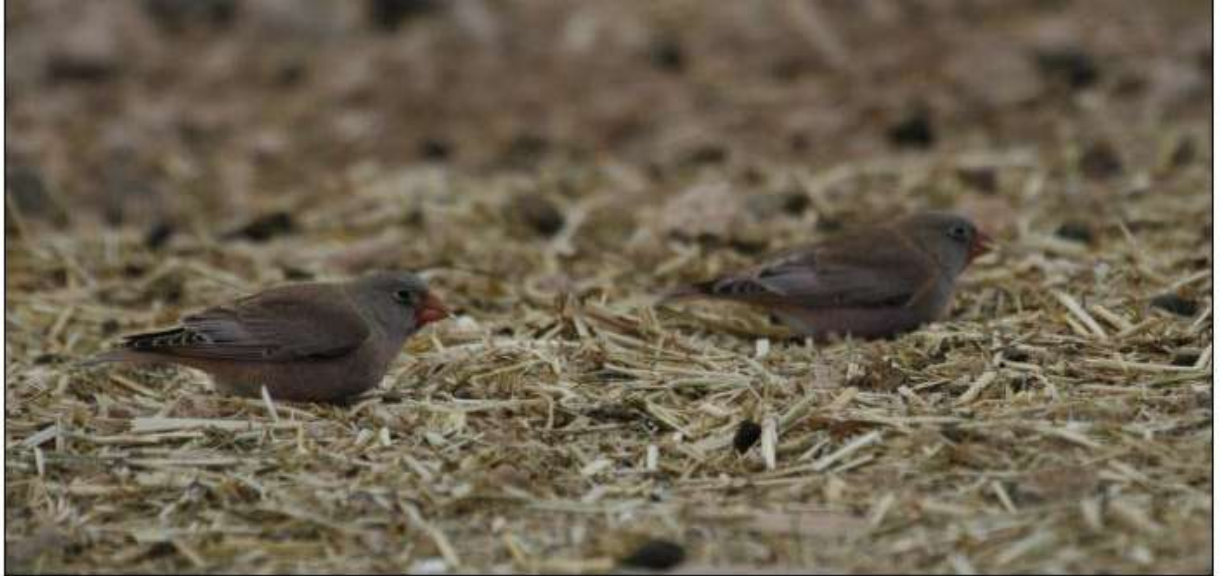
Roselins githagines, Las Parcelas