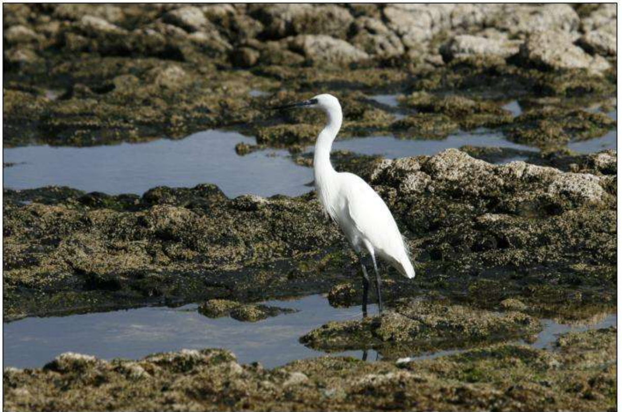
Aigrette garzette, Caleta de Fuste

6 en vol vers le nord le 8 à Caleta de Fuste, en 45 minutes (7h20-8h05).