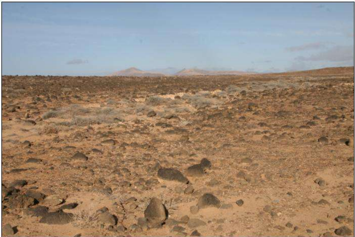
Arrière-pays de Caleta de Fuste

Terrain en solo l'après-midi pendant 2 heures sur le littoral et dans la steppe désertique située entre Caleta de Fuste et Nuevo Horizonte (village également appelé « Costa Antigua »).