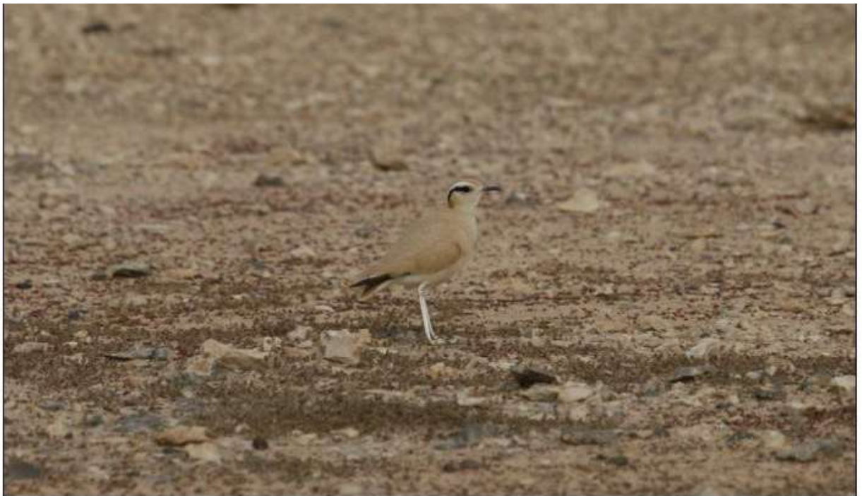
Courvite isabelle, El Cotillo

Le 6, 10 individus en 2 groupes (7+3) observés de près dans d'excellentes conditions dans la steppe sableuse au sud de El Cotillo, site classique pour l'espèce.