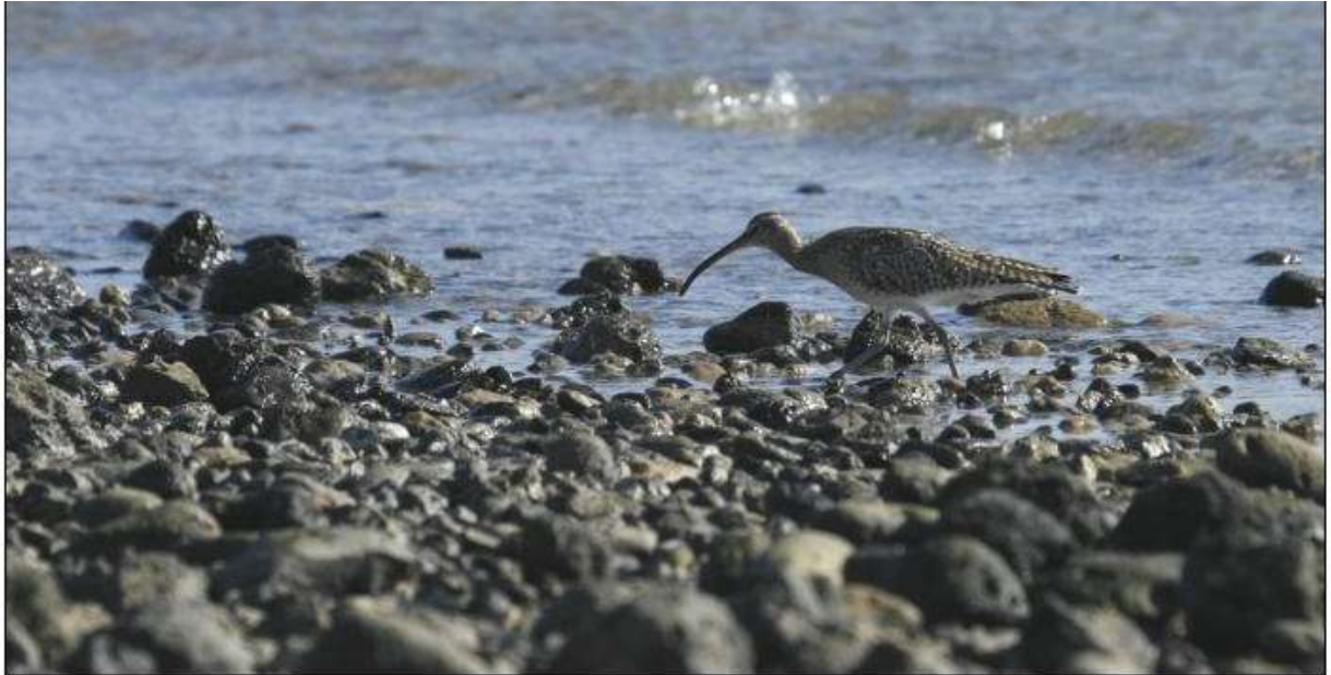
Courlis corlieu, Caleta de Fuste

Le 3, 1 ind. est observé dans la steppe sèche à plus de 500 m du rivage au sud du village de Nuevo Horizonte.