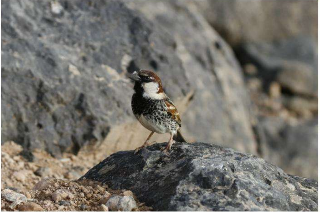
Moineau espagnol, Caleta de Fuste