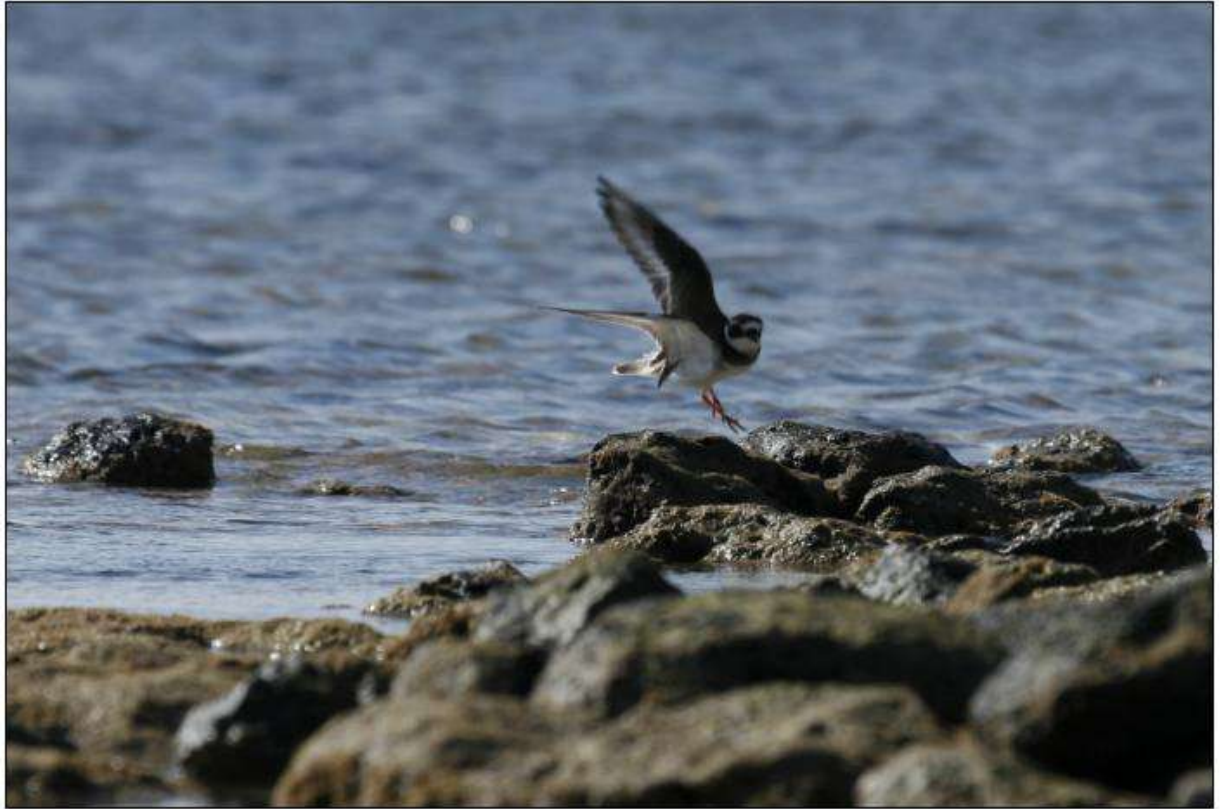
Grand Gravelot, Caleta de Juste