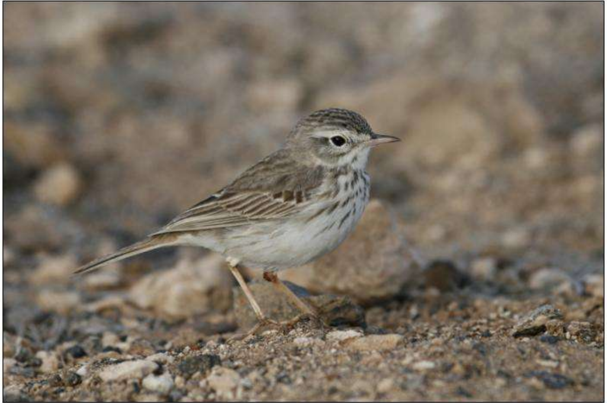
Pipit de Berthelot, espèce endémique des Canaries et de Madère, Caleta de Juste