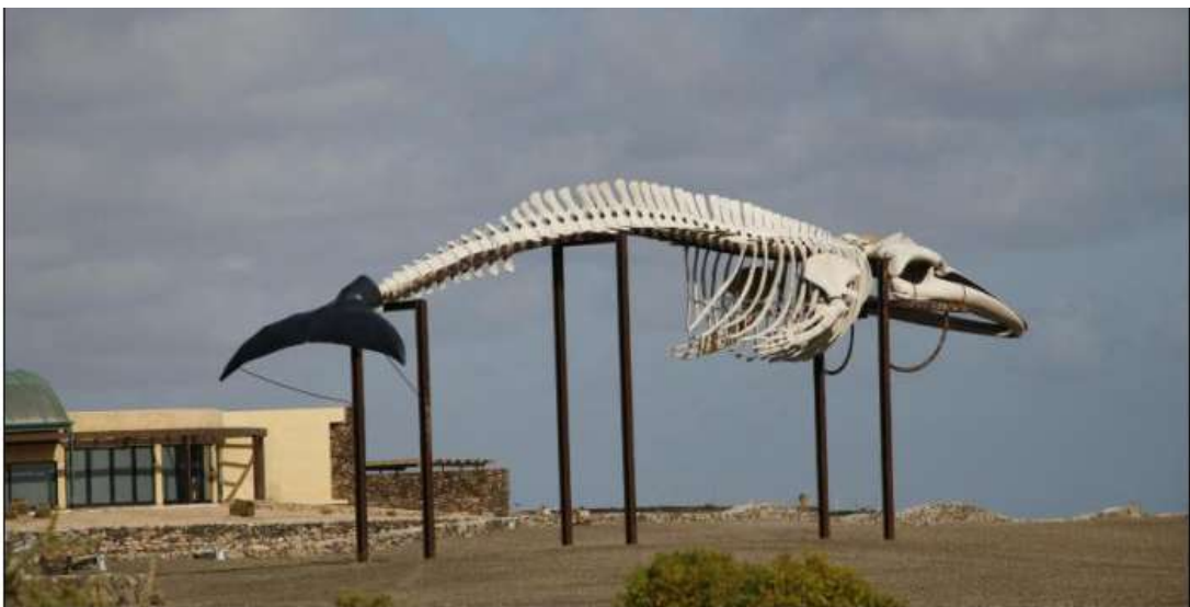
Squelette reconstitué de Baleine long de 20 m, Salinas del Carmen

Indices de présence le long du Barranco de la Torre, 1 ou 2 individu(s) vus à Catalina Garcia, terriers aux abords du barrage de Los Molinos, 1 à Triquivijate.