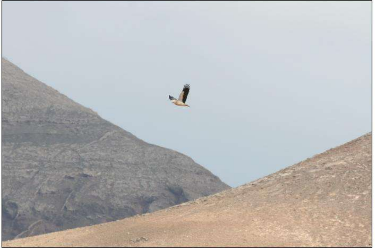
Vautour pernoptère, Barrage de Los Molinos