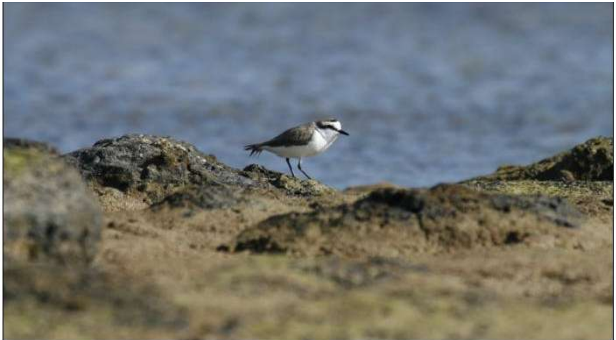
Gravelot à collier interrompu, Caleta de Juste