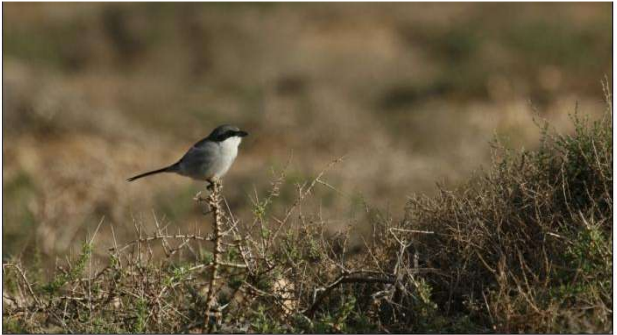
Pie-grièche méridionale, El Cotillo

Le 8, 1 près du barrage de Los Molinos puis 1 autre près de Las Parcelas.