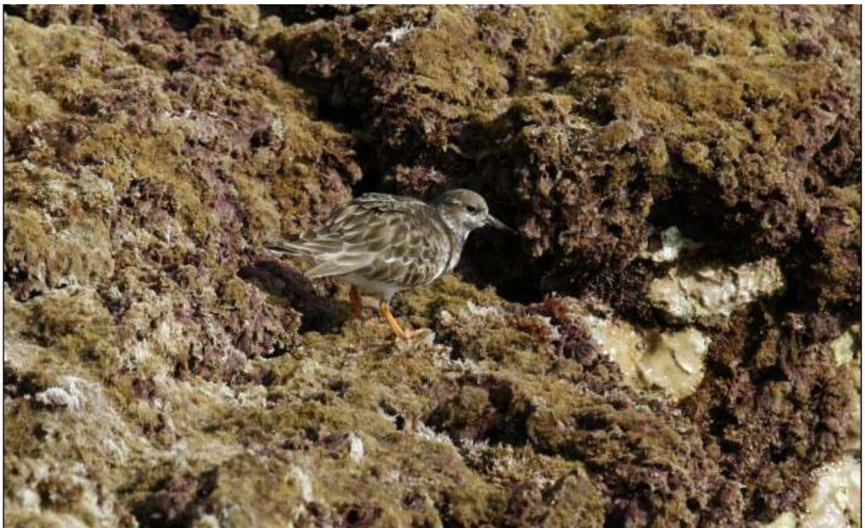
Tournepierre à collier, Caleta de Fuste

Maximum de 8, le 8, à Caleta de Fuste et de 4 à El Cotillo, le 6.