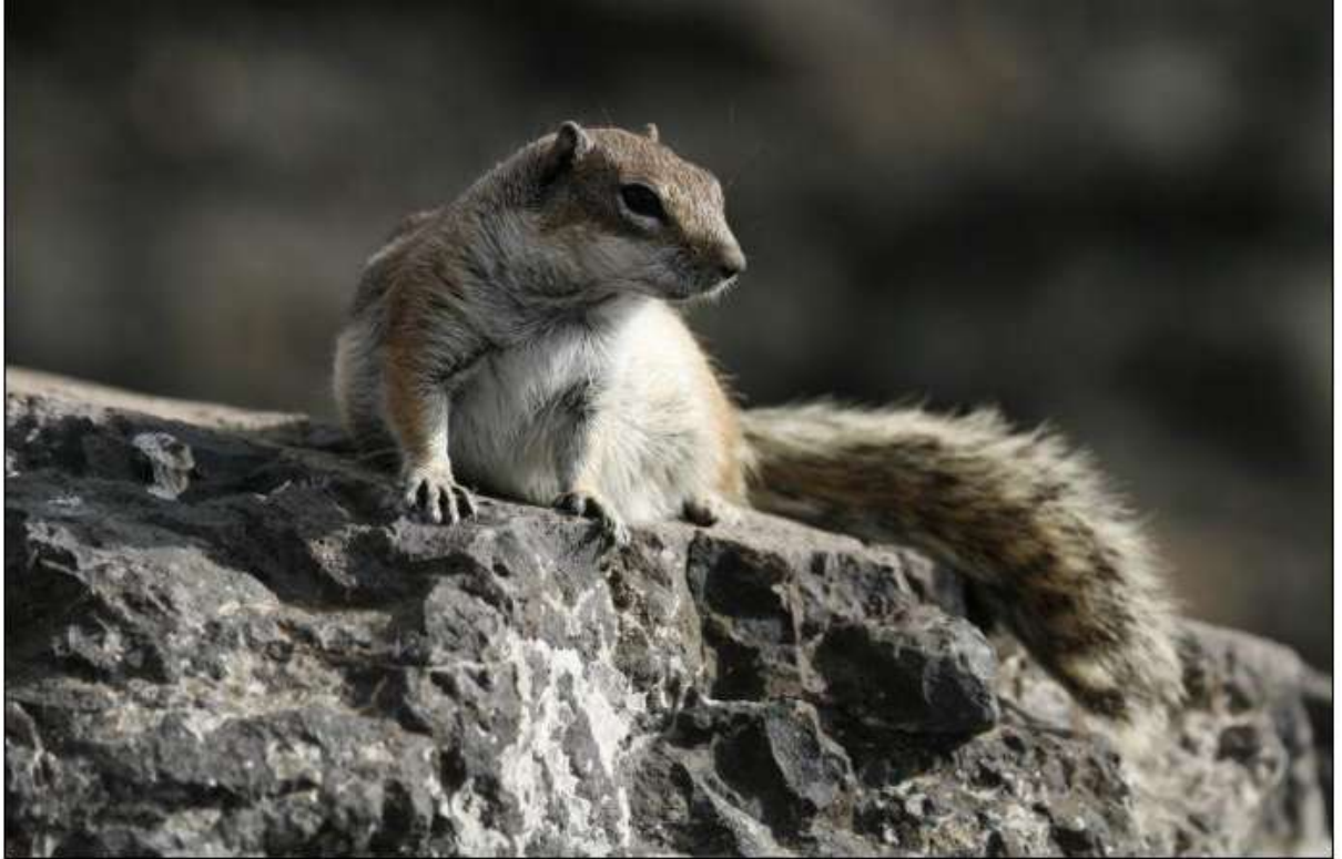
Écureuil de Berbérie, Caleta de Fuste