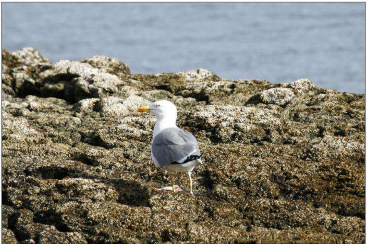
Goéland leucophée atlantique, Caleta de Fuste

Le 8, au moins 200 ind. au barrage de Los Molinos.