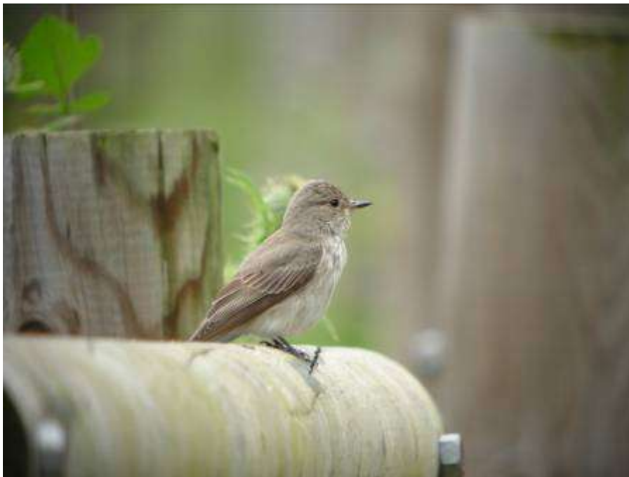
Gobemouche gris, adulte, El Cortalet, Aiguamolls, 5 mai 2007