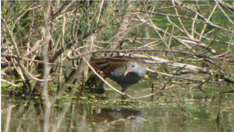
Marouette poussin, mâle adulte, Estany de Vilaüt, Los Aiguamolls, 5 mai 2007