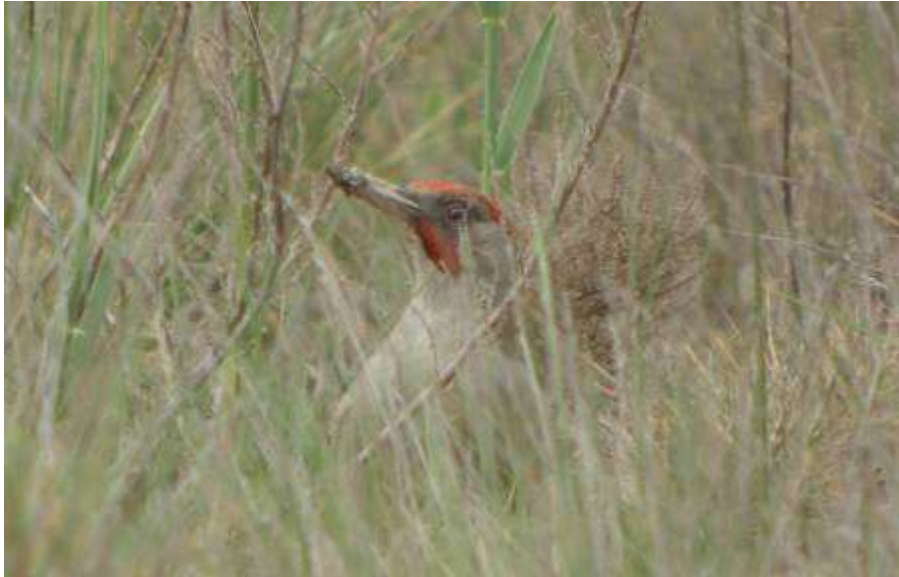
Pic vert de Sharpe, adulte, Etang de Canet, St-Cyprien-Plage, 2 mai 2007