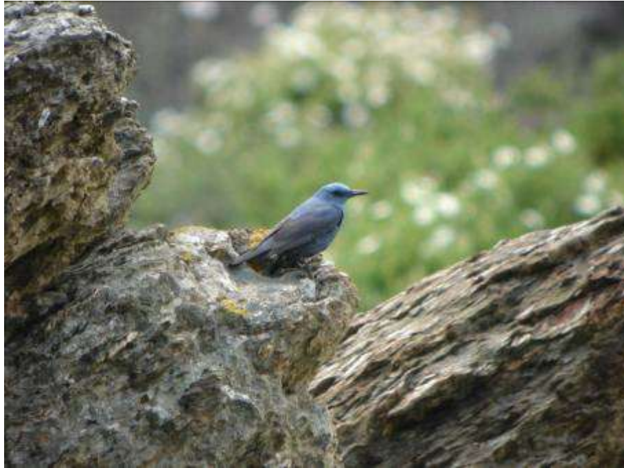
Monticole bleu, mâle adulte, Cap Béar, Port-Vendres, 2 mai 2007