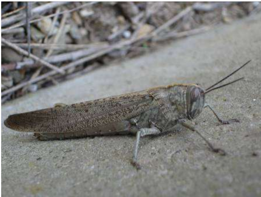
Criquet égyptien, adulte en fin de vie, Montagne de la Clape, le Réc d'Argent, 29 avril 2007