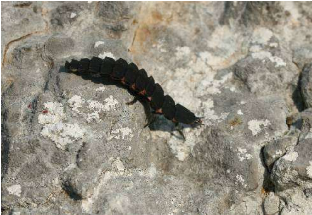
Staphylin sp. , Ile St-Martin, Gruissan, 6 mai 2007