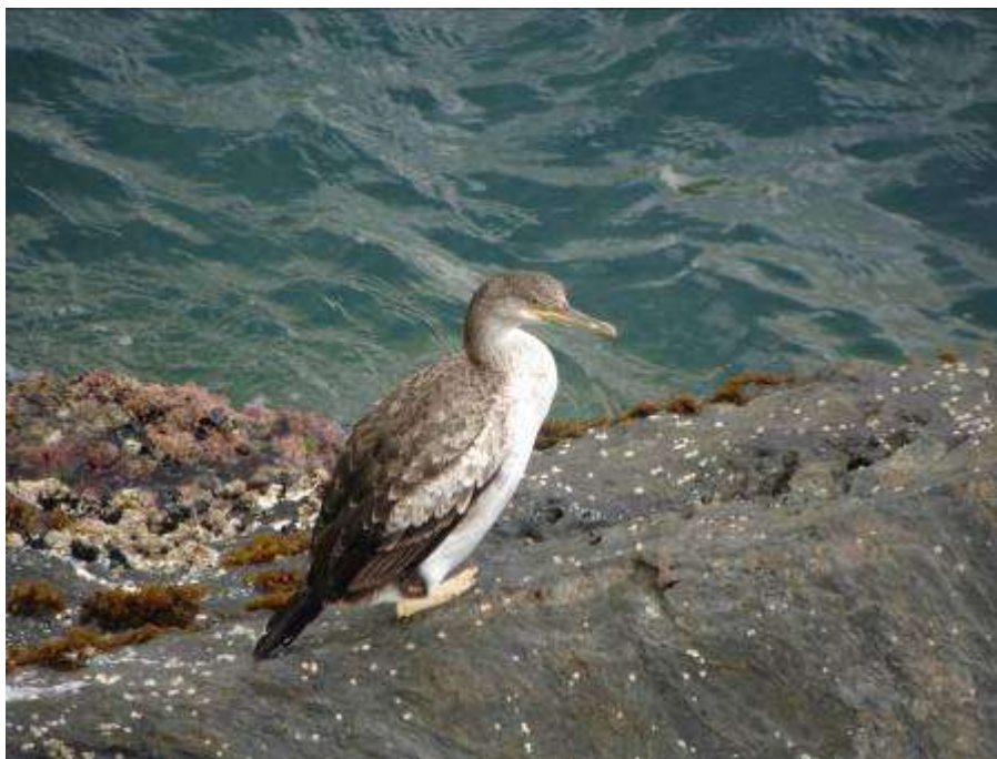
Cormoran huppé de Méditerranée, imm. de 1 ère année, Cap Béar, 2 mai 2007