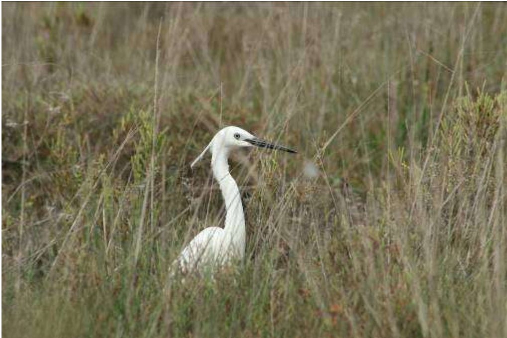
Aigrette garzette, adulte nuptial, Marais de Pissevaches, 29 avril 2007