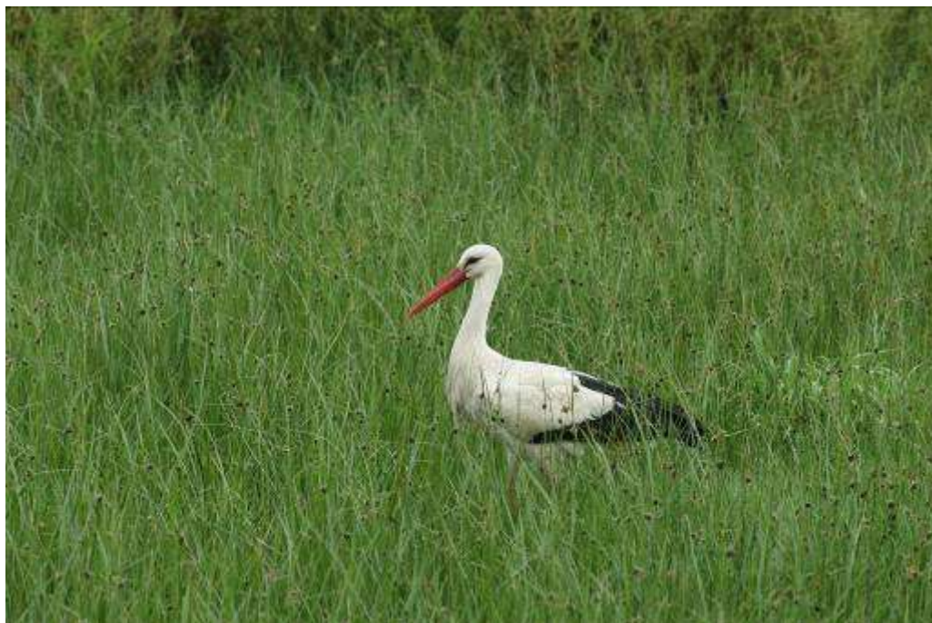
Cigogne blanche, adulte, Estany de Europa, Los Aiguamolls, 3 mai 2007