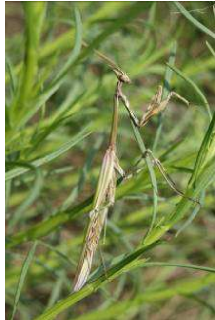
Mante empuse, femelle ( ? ) adulte, Montagne de la Clape, Armissan, 29 avril 2007