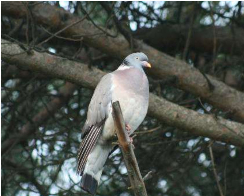
Pigeon ramier, adulte, camping La Laguna, Los Aiguamolls, 3 mai 2007