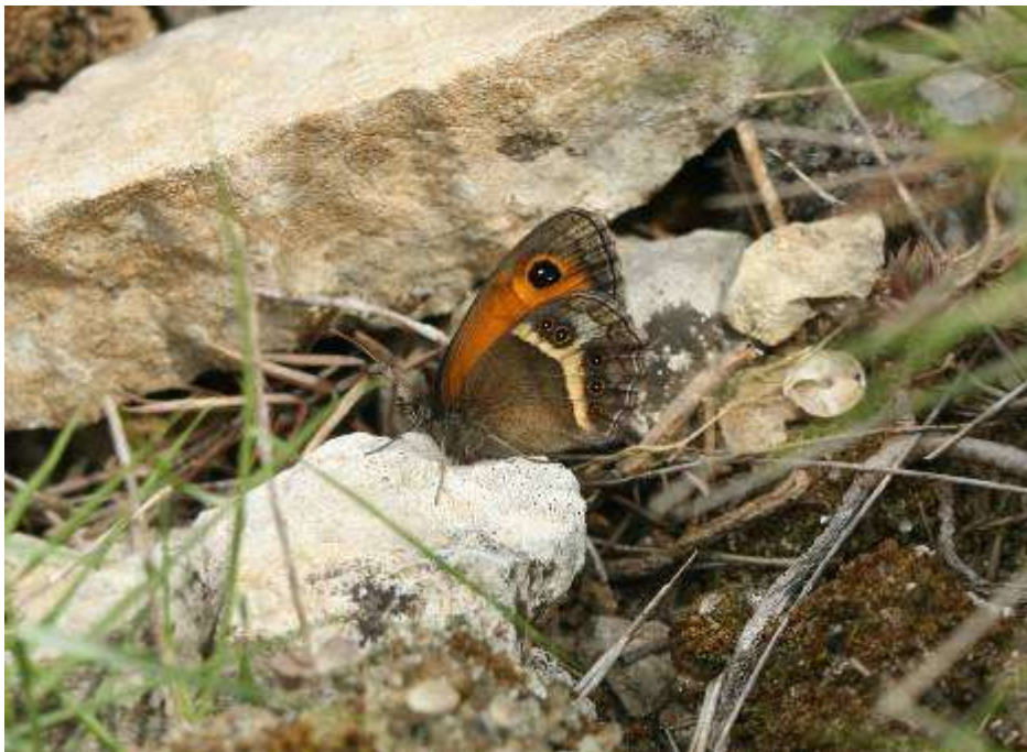
Tityre, femelle, Montagne de la Clape, Armissan, 29 avril 2007