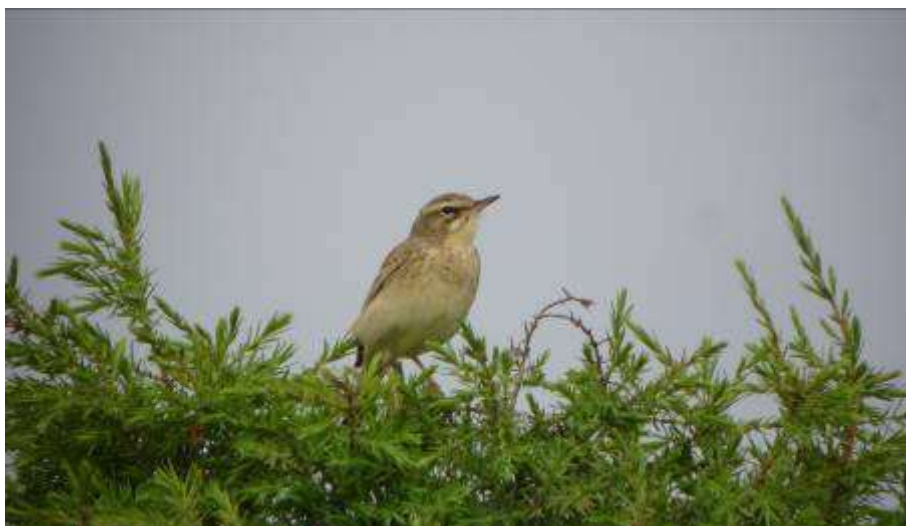
Pipit rousseline, mâle adulte, parc éolien de Fitou, 1 er mai 2007