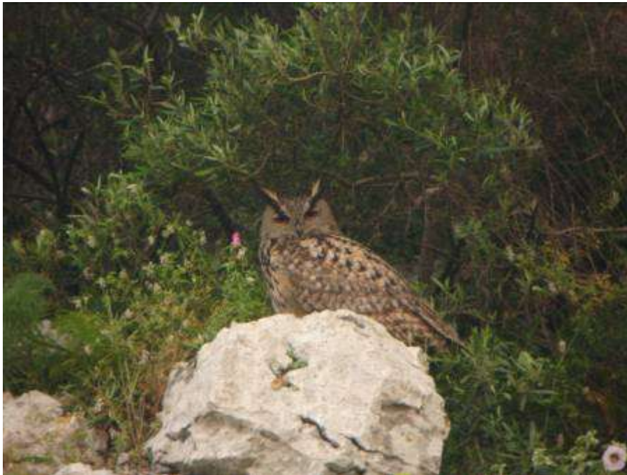
Grand-duc d'Europe, adulte, Montagne de la Clape, Le Réc d'Argent, 5 mai 2007