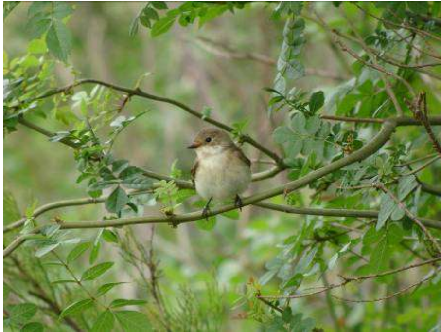
Gobemouche noir, femelle adulte, Mas del Matar, Los Aiguamolls, 4 mai 2007