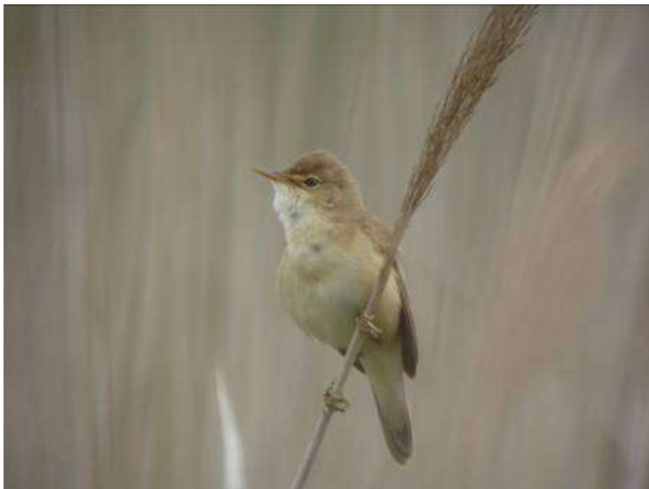
Rousserolle effarvate , mâle adulte, Etang de Canet, St-Cyprien-Plage, 2 mai 2007