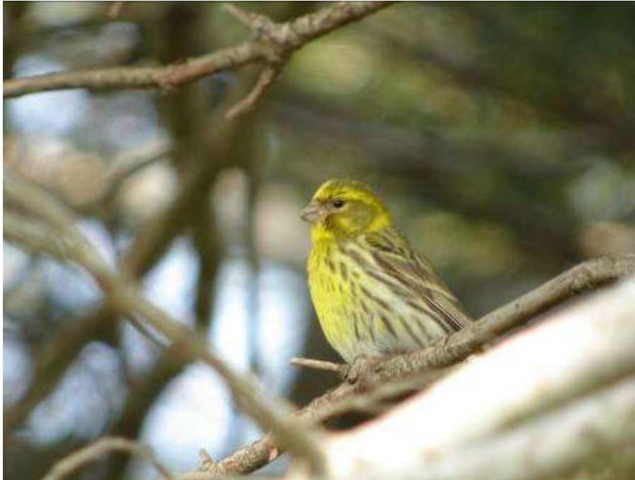
Serin cini, mâle adulte, Ile St-Martin, Gruissan, 6 mai 2007