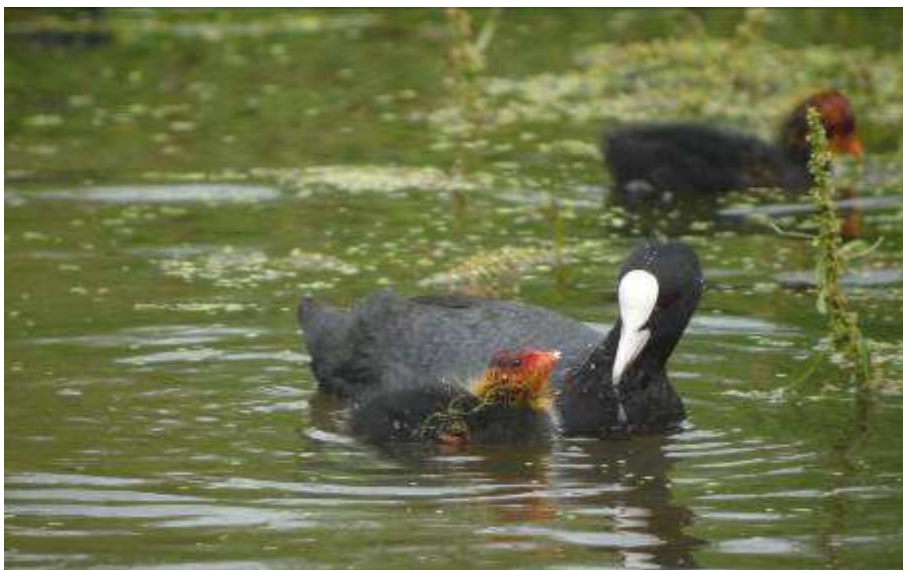
Foulque macroule, adulte et poussin, Estany de Europa, Los Aiguamolls, 3 mai 2007