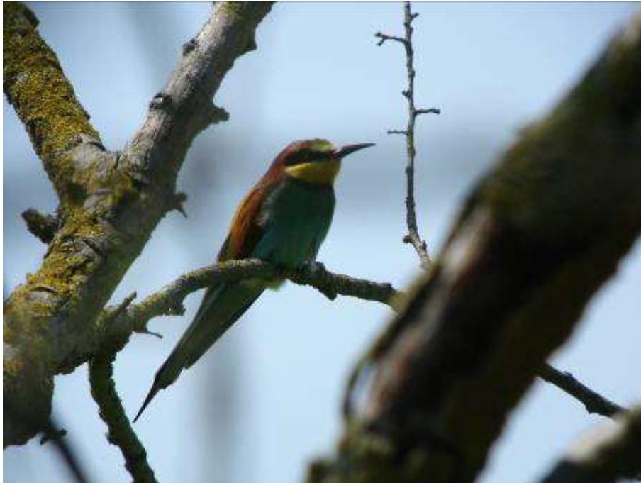
Guêpier d'Europe, adulte, El Cortalet, Los Aiguamolls, 5 mai 2007