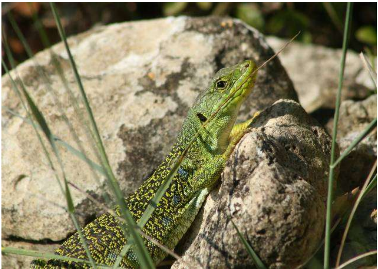
Lézard ocellé, femelle adulte, Ile St-Martin, Gruissan, 30 avril 2007

Yohann BROUILLARD (textes)