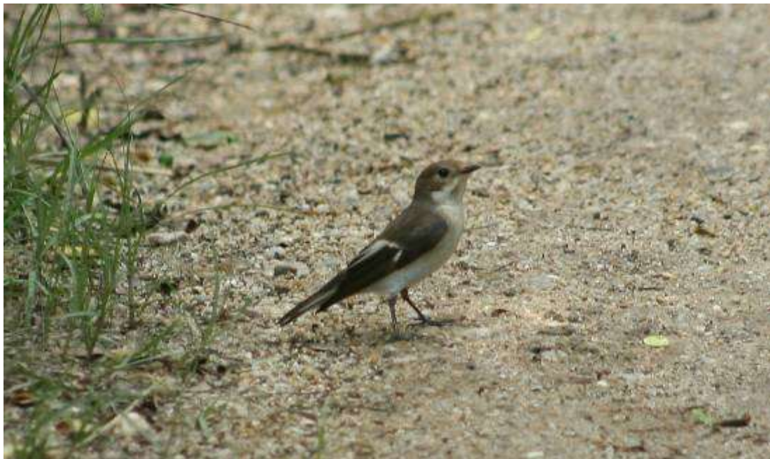
Gobemouche à collier, femelle adulte, Mas del Matar, Los Aiguamolls, 5 mai 2007