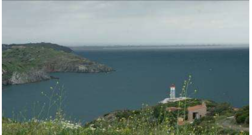
Panorama autour du Phare de Port-Vendres, 2 mai 2007