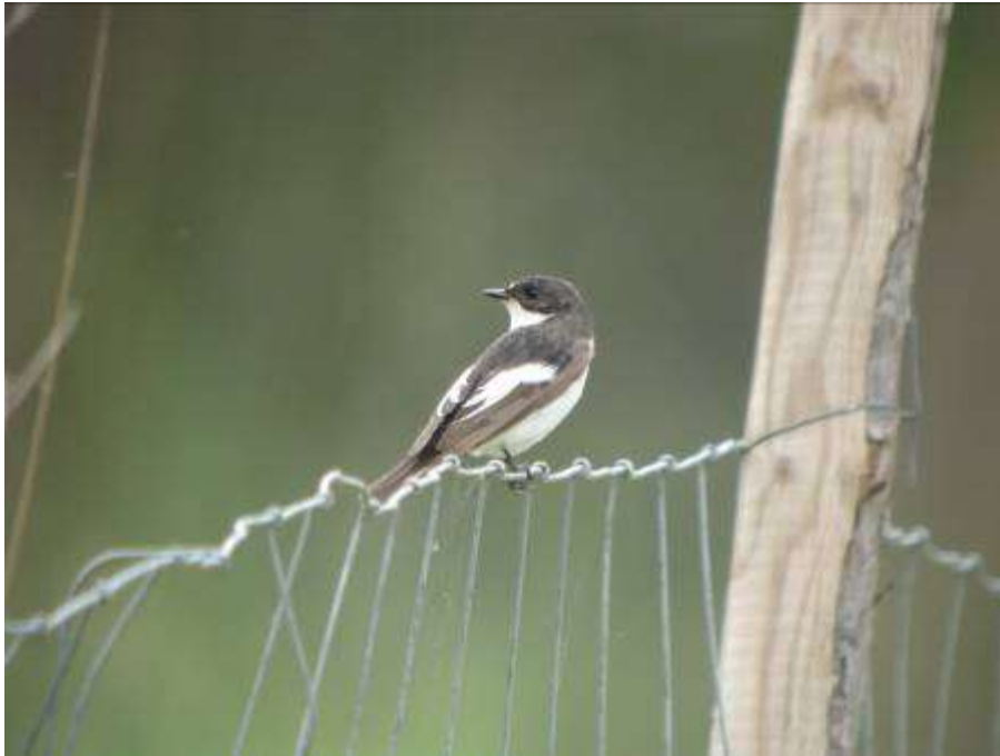
Gobemouche noir, mâle adulte, Mas del Matar, Los Aiguamolls, 3 mai 2007