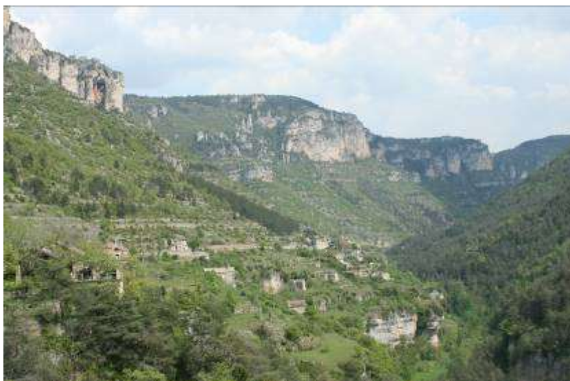
Les Gorges de la Jonte, Belvédère du Rozier, Lozère, 28 avril 2007