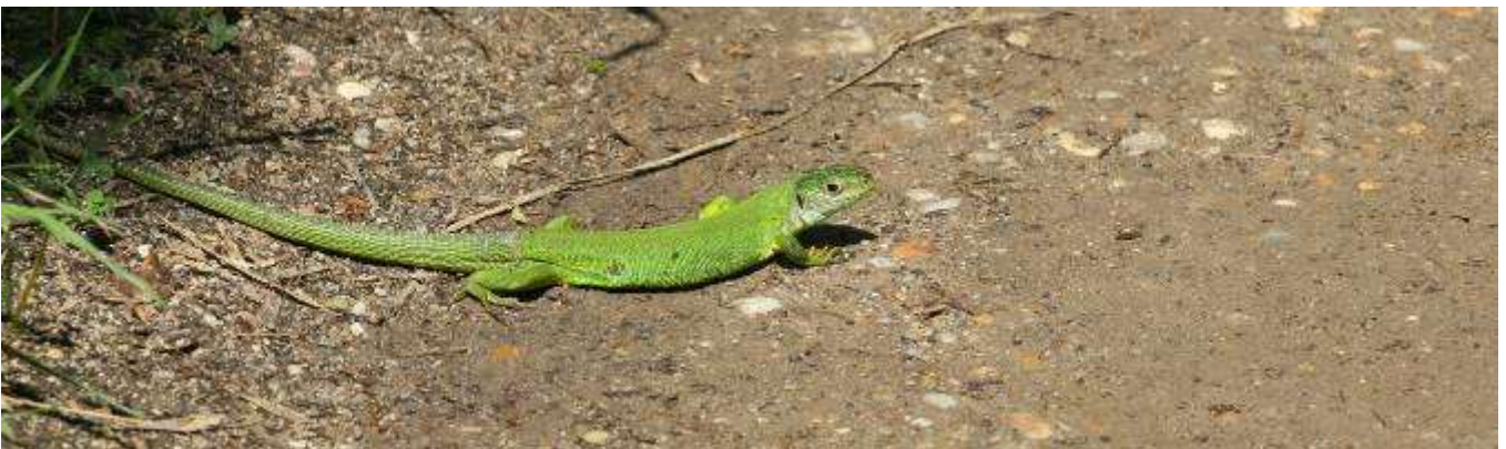
Lézard vert, adulte, El Cortalet, Los Aiguamolls, 5 mai 2007