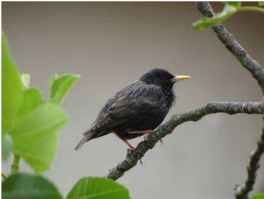
Etourneau unicolore, mâle adulte, centre du village de Caves, 1 er mai 2007