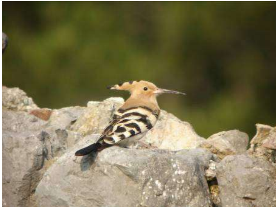
Huppe fasciée, mâle adulte chanteur, Ile St-Martin, Gruissan, 6 mai 2007