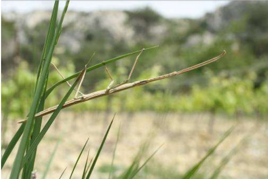
Phasme rossius , adulte, Montagne de la Clape, Armissan, 29 avril 2007