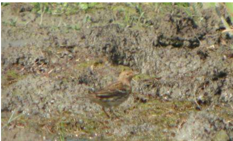
Pipit à gorge rousse, mâle adulte, Estany de Vilaüt, Los Aiguamolls, 5 mai 2007