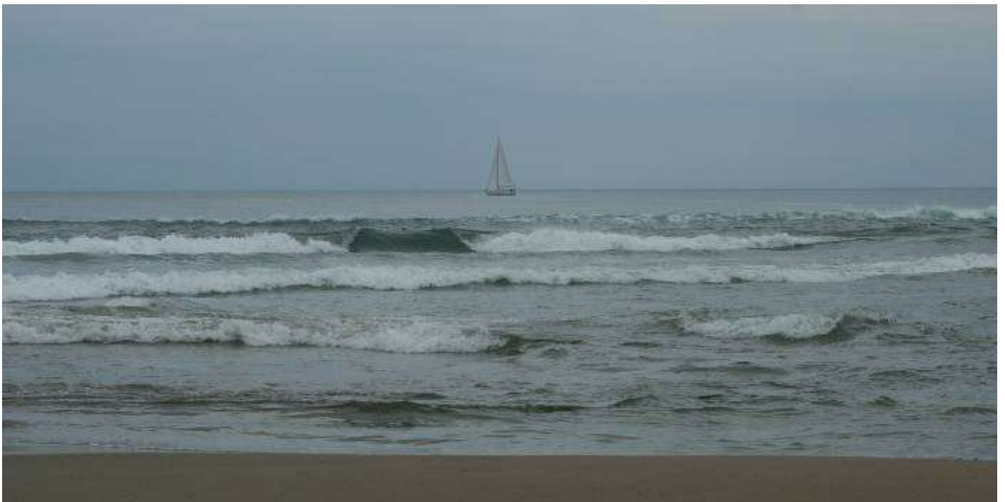
Bateau à voile dans la Baie de Roses, Catalogne espagnole, 4 mai 2007 en fin de journée