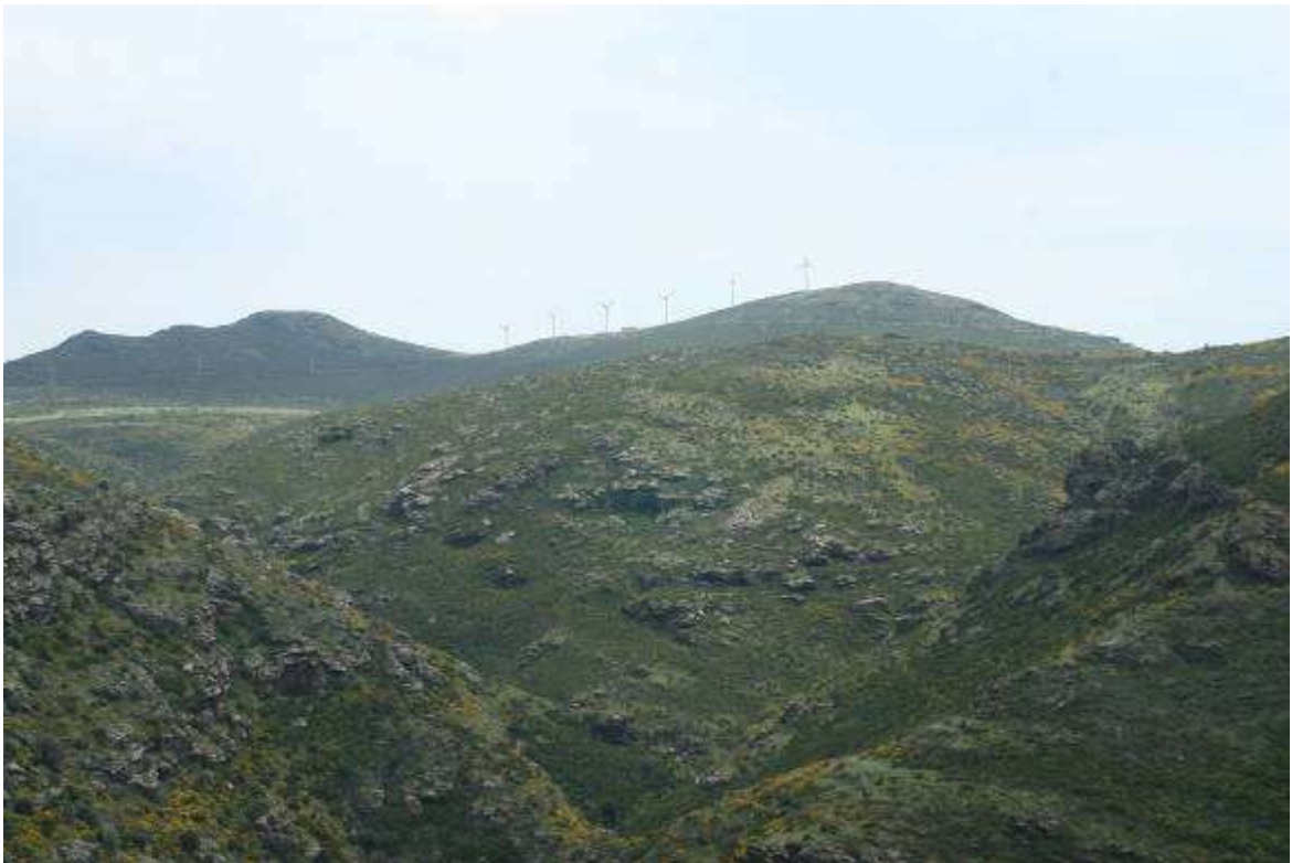
Cap de Creus depuis la route entre Cadaques et le Port de la Selva, 5 mai 2007