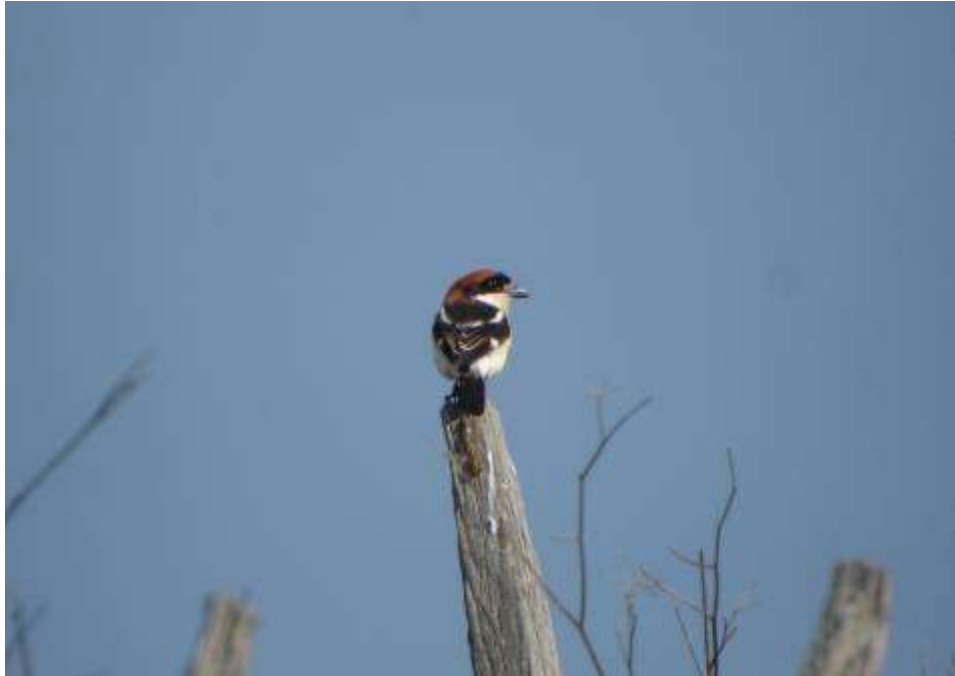
Pie-grièche à tête rousse, mâle adulte, Estany de Vilaüt, Los Aiguamolls, 5 mai 2007