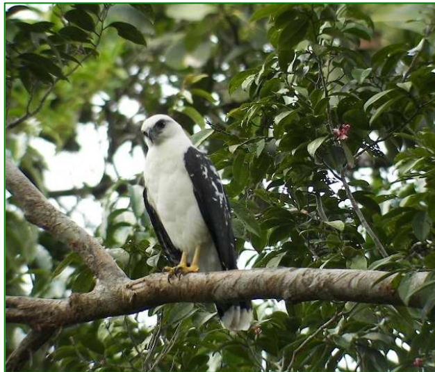
Buse blanche Leucopternis albicollis

364. Organiste nègre Euphonia cayennensis - Golden-sided Euphonia Commun en forêt.