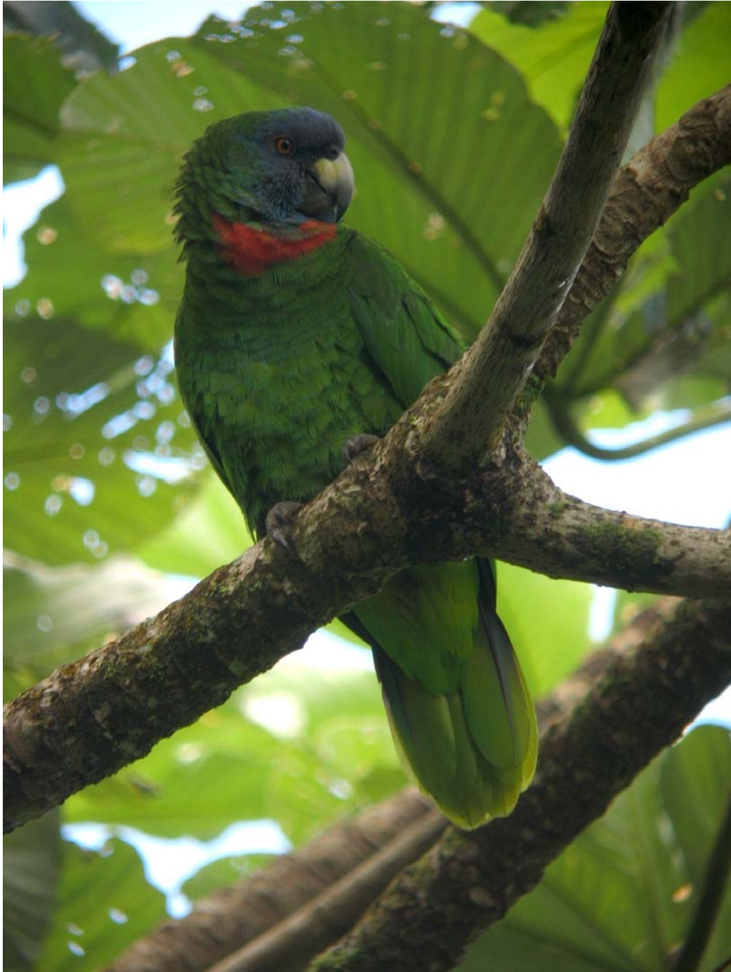
Amazone de Bouquet - Syndicate Estate, Morne Diablotin N.P., Dominique

Sainte-Lucie - Saint-Vincent - Montserrat - Antigua