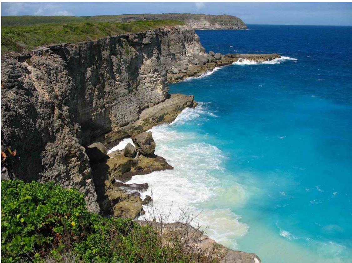
Pointe de la Grande Vigie en Guadeloupe