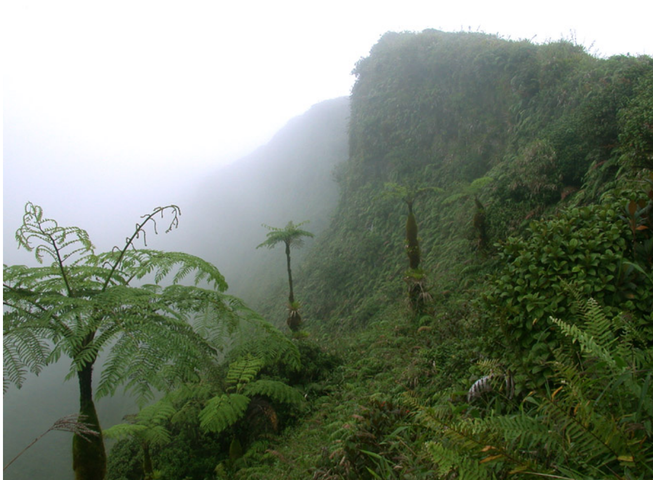
Cratère du volcan de la montagne Pelée, commune du Morne Rouge, Département de la Martinique