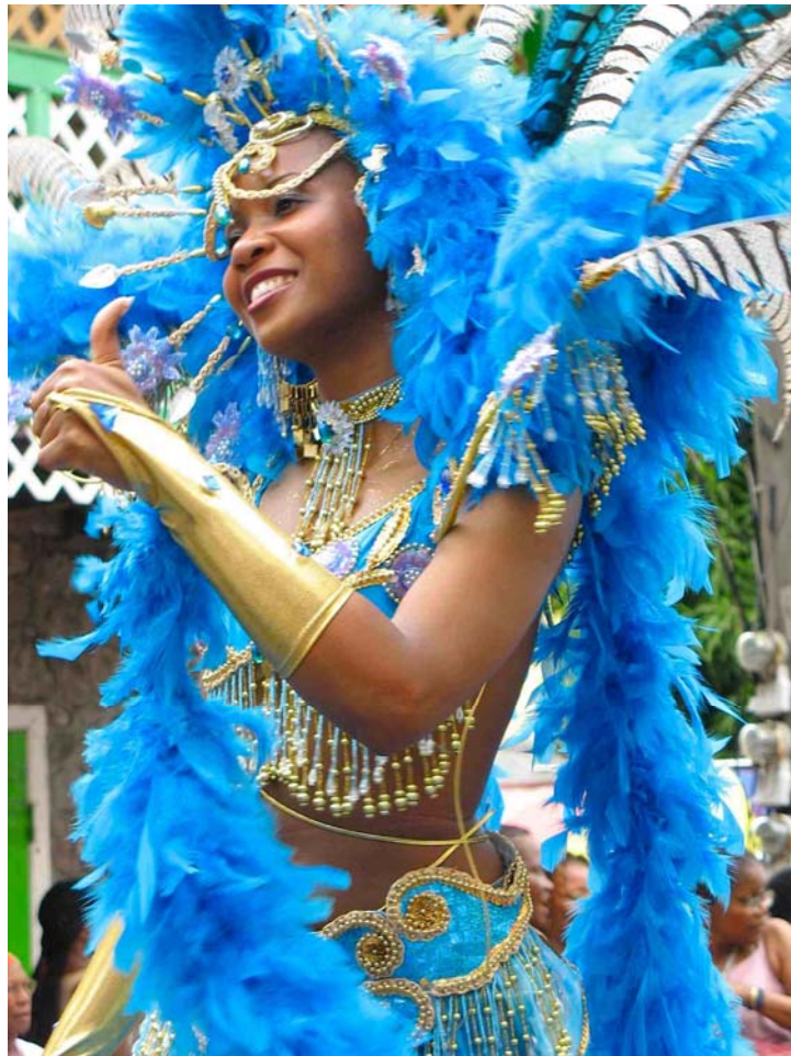
Grande parade à Roseau, Dominique