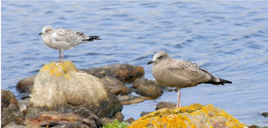
Avec un G. à bec cerclé dans le fond

Goéland brun Larus fuscus . Un oiseau de 2 E année civile (probablement graellsii ) sur le stade à proximité du centre culturel de St-Pierre le 4.