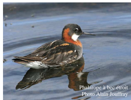
Phalarope à bec étroit