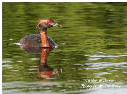
Grèbe esclavon

Plongeon imbrin - Gavia immer entendu puis aperçu sur le lac très loin