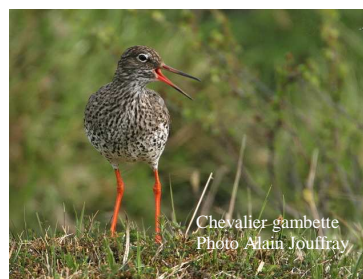
Chevalier gambette