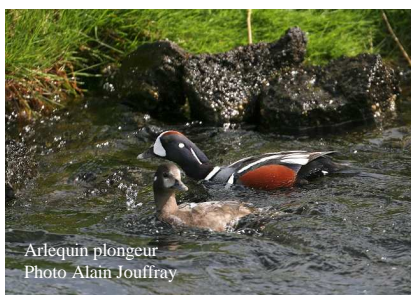
Arlequin plongeur

Rivière Laxa (parking côté nord du pont de la route 848)