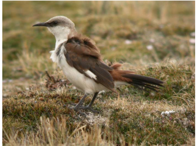
White-bellied Cinclodes, une des espèces les plus rares au Monde !

Nous y observons de nombreux oiseaux d'eau et notamment des milliers de Franklin's Gull venant hiverner sur les côtes péruviennes. Parmi les centaines de canards, grebes, herons, foulques et mouettes, nous observons même un adulte de Red-gartered Coot... un accidentel originaire du sud de l'Amérique du sud (première mention péruvienne) !!