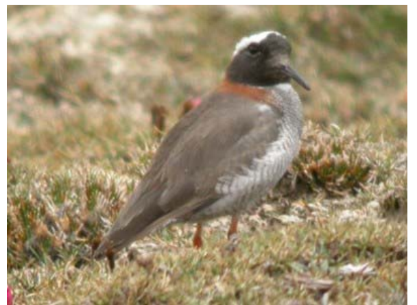
Le Diademed Sandpiper-plover, ou Pluvier des Andes, espèce mythique des Hautes-Andes.