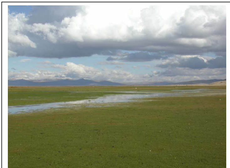
Les abords du lac Junin

Lors de notre visite, le niveau d'eau du lac est particulièrement bas, et il faut marcher près de 3 km, parfois dans la boue ou dans les roseaux, pour arriver sur la rive du lac où nous observons 2 individus du grèbe si rare !