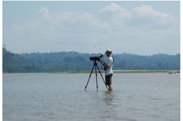
Digiscoping en Amazonie.

Pour plus de renseignement, consulter http://www.kolibriexpeditions.com