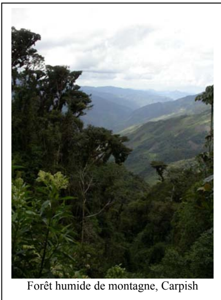
Forêt humide de montagne, Carpish

Nous arrivons à Tingo Maria à la tombée de la nuit, et nous passons la nuit au Jennifer Lodge.