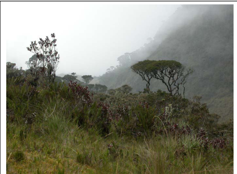
Le Bosque Unchog, un des rares endroits au monde où il est possible d'observer le Golden-backed Mountain-tanager, une des espèces endémiques "cibles" de ce voyage.