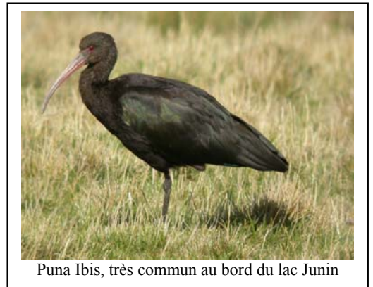
Puna Ibis, très commun au bord du lac Junin

Un Parc Naturel a été créé pour tenter de préserver la richesse de ce lac, mais la pollution continue et la population de Grebe de Junin ne montre pas de signe d'augmentation.