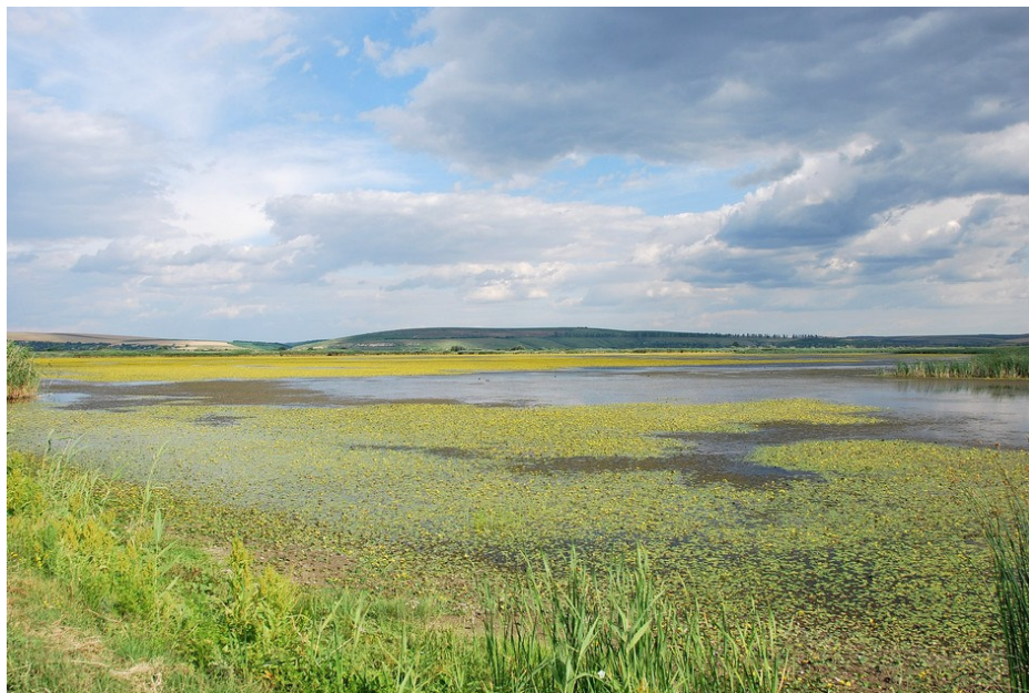
Annexe du lac Bugeac

Le site accueille notamment le Fuligule nyroca, le Grèbe jougris, le Cormoran pygmée et l'Ibis falcinelle.