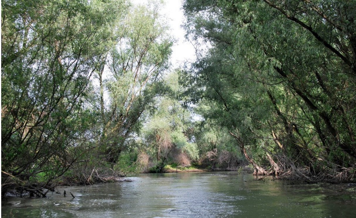
Bras secondaire du Danube au nord de Murighiol