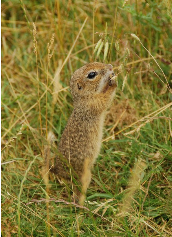
Souslik peu farouche dans la vallée de Cheia

Lièvre d'Europe Lepus europaeus European Hare : 1 au lac Bugeac, 3 ensemble sur la route entre Braila et Buzau, 1 au volcan Noroiosi et 2 à Viscri.