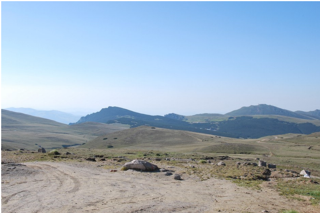
Pelouses sommitales près de Baba Mare dans les Monts Bucegi – ces pelouses accueillent notamment l'Alouette haussecol

Les pelouses accueillent l'Alouette haussecol et les parois rocheuses le Faucon pèlerin et le Tichodrome échelette. Nous ne les y avons pas trouvés mais le Monticole de roche et l'Accenteur alpin sont à rechercher. En forêt, nous avons seulement observé le Gobemouche à collier, mais la physionomie de celle-ci laisse présager la présence de pics. Par ailleurs, nous avons vu le Pic cendré au sein même du village et contacté le Gobemouche nain à plusieurs reprises en périphérie. Enfin, l'Ours semble plutôt commun dans la vallée tant les indices de sa présence sont nombreux.