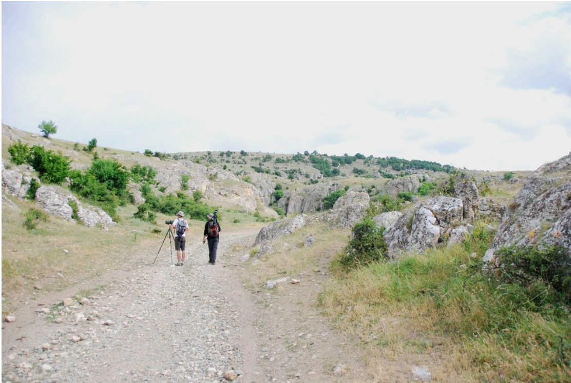
Notre arrivée dans la vallée de Cheia

Le Traquet pie est la principale attraction du site, mais sont également présents les Traquets isabelle et oreillard, l'Aigle botté, la buse féroce, l'Epervier à pied court et la Pie-grièche à poitrine rose.