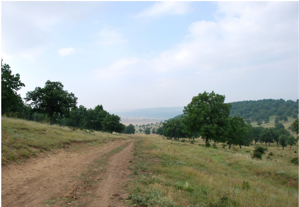
Chênaie claire en lisière de la forêt de Babadag, l'habitat de la Mésange lugubre

Mésange lugubre Poecile lugubris Sombre Tit : Observée en lisière de la forêt de Babadag : 2 côté Slava Rusa et 1 entre Enisala et Jurilovca.