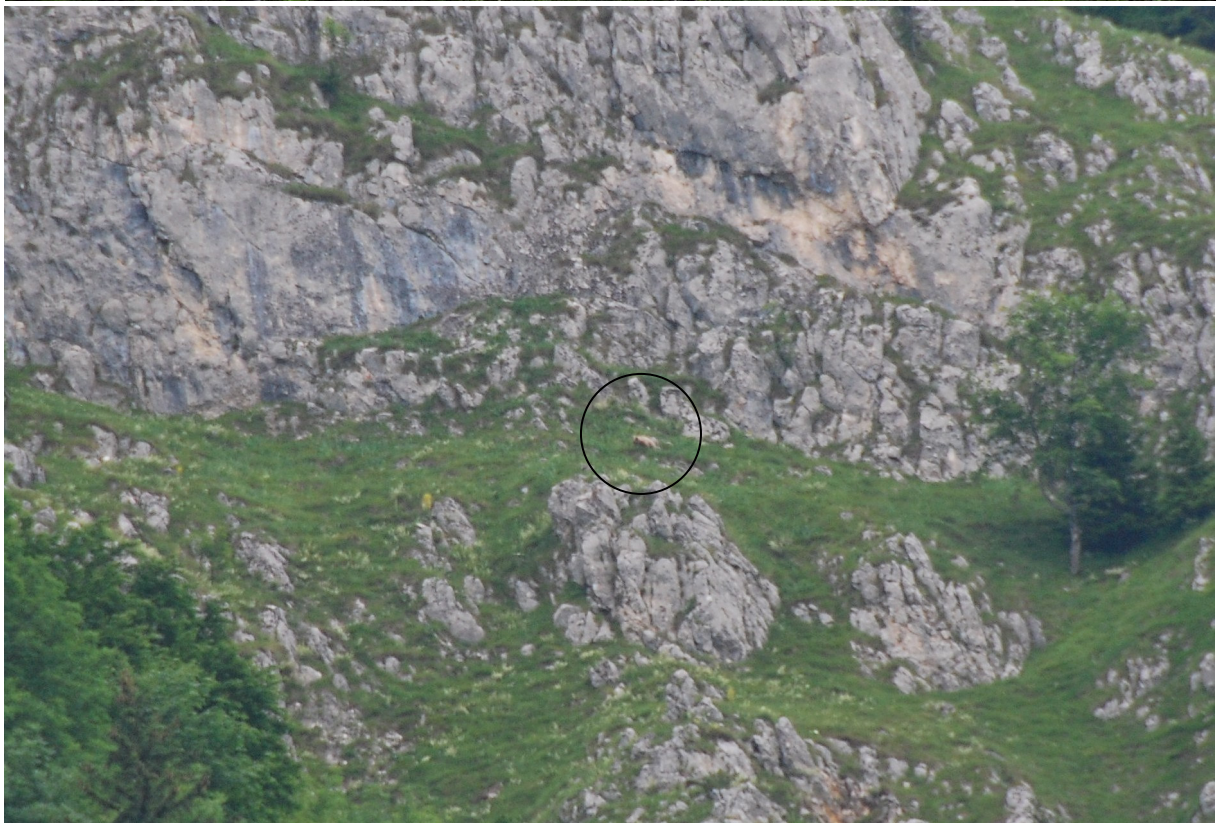
Notre observation d'Ours brun dans les Monts Piatra Craiului

Chevreuil européen Capreolus capreolus European Roe Deer : 2 à Histria.