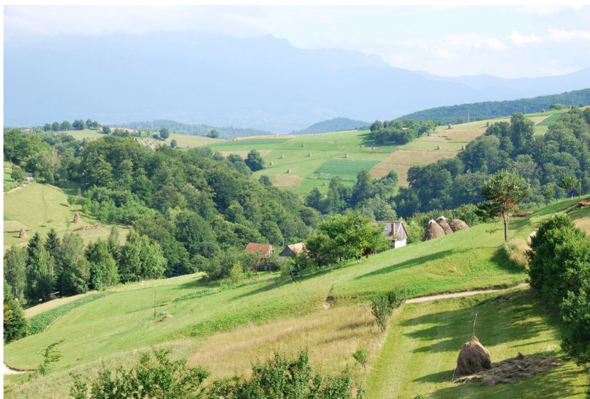
Région de Poiana Marului dans les Carpates