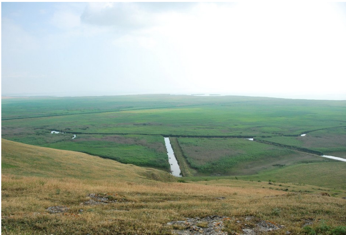
Les immenses roselières qui bordent le Lac Razim vues depuis le château d'Enisala

La vallée de Cheia est située sur la route 222 entre Gradina et Targusor. Le village de Cheia marque l'entrée nord de la vallée.