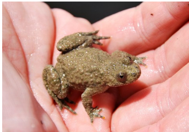
Dans le sens de la lecture : Pélobate brun, Pélobate syriaque, Sonneur à ventre de feu, Sonneur à ventre jaune