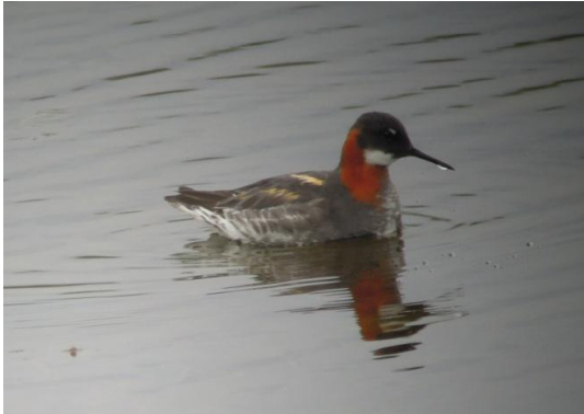
Phalarope à bec étroit

Avant diner, aller-retour vers Nesseby. Arrêt au fond du fjord, à Varangerbotn à l'observatoire : huitrier-pie, oie cendrée, chevalier gambette, grand gravelot. A l'église blanche de Nesseby : macreuses, bécasseau minute au milieu du varech.