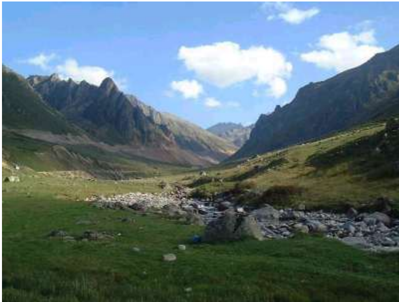
Magnifique panorama dans les Alpes Pontiques.

Le centre de dépense le plus important est sans nul doute la location de la voiture et surtout l'essence dont le prix est équivalent à celui pratiqué en France.