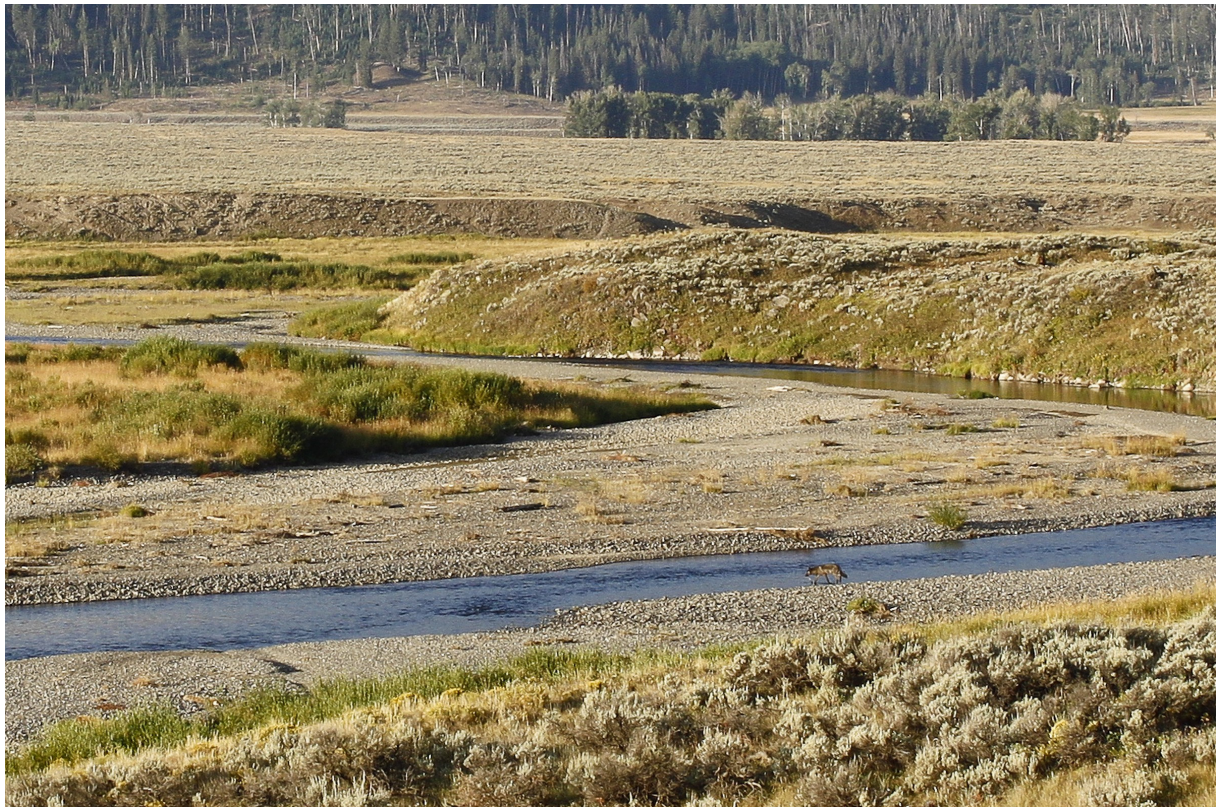
Loup gris, Lamar Valley, Yellowstone NP

Gray Wolf Canis lupus Loup gris : 2 observations à Yellowstone NP. 1 noir dans la Lamar Valley. Descend le versant, traverse la route puis maraude au bord de la rivière, à 100-150 m, pendant qu'un ranger tient les observateurs à distance. Puis 1 blanc avec 1 gris dans la Hayden Valley. Très loin, de l'autre côté de la vallée, se tiennent à l'orée du bois. Là encore, des américains nous prêtent une longue-vue pour les observer.