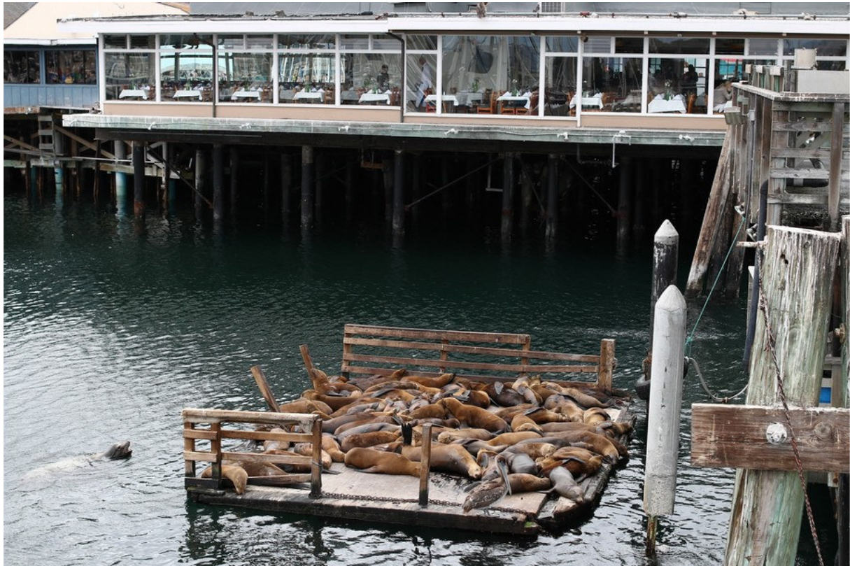
Lions de mer de Californie, Fisherman's Wharf, Monterey

Californian Sea Lion Zalophus californianus Lion de mer de Californie : Colonie (bruyante) à Point Lobos SR. 1 mâle seul puis un groupe d'une 50aine sur les pontons de Fisherman's Wharf à Monterey.