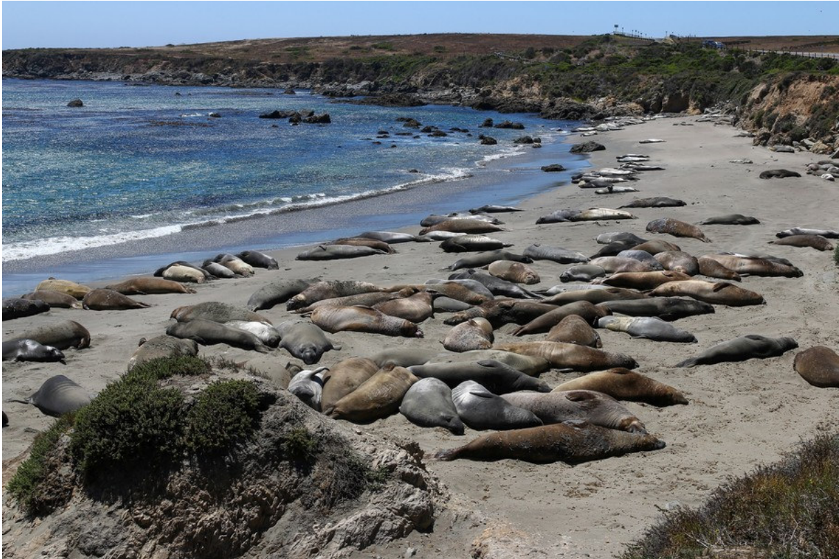
Eléphants de mer boréaux, Piedras Blancas

White-tailed Prairie Dog Cynomys leucurus Chien de prairie à queue blanche : Nombreux dans les prairies de part et d'autre de la route 40 entre Vernal, UT, et Rangely, CO.