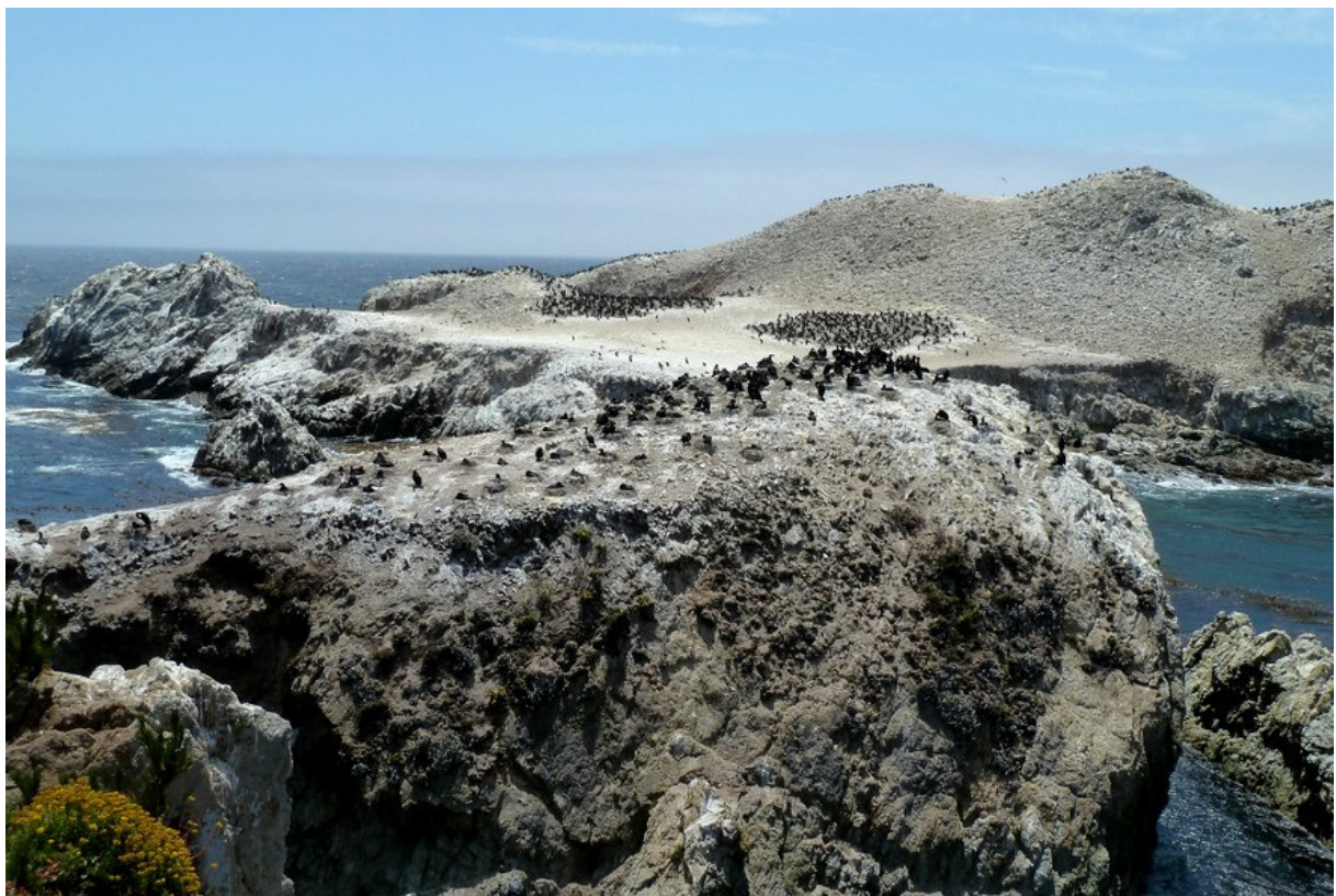
Cormorans de Brandt, Point Lobos SR

Brandt's Cormorant Phalacrocorax penicillatus Cormoran de Brandt : Colonie à Point Lobos SR.