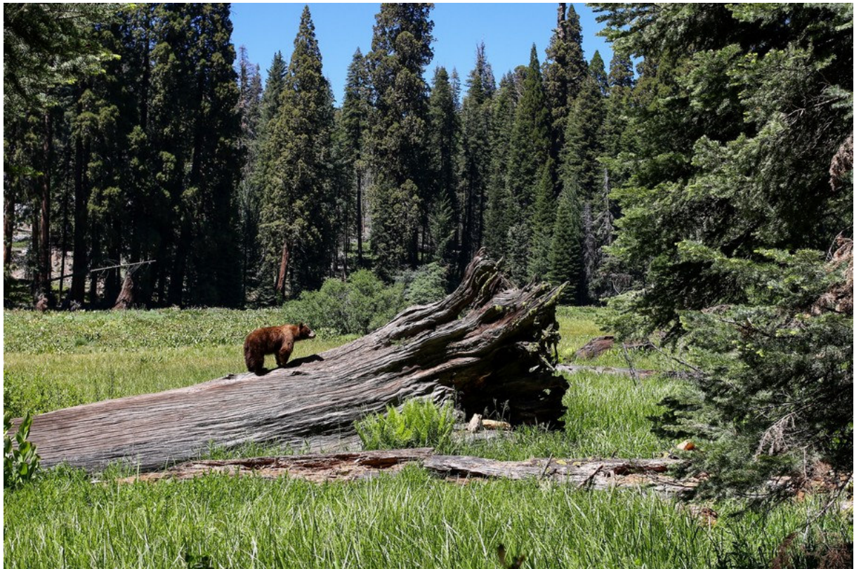
Ours noir, Crescent Meadow, Sequoia NP

American Black Bear Ursus americanus Ours noir : En 2012, 1 femelle avec 2 jeunes à Dunraven Pass, Yellowstone NP. Sur le versant opposé, à l'ouest du col. Traînent un moment dans une clairière puis disparaissent en forêt. Des américains nous prêtent une longue-vue pour les observer. En 2014, plusieurs observations à Sequoia NP. D'abord 1 femelle avec 2 jeunes au General Sherman. A une 15aine de mètres du sentier, la femelle soulève l'écorce des arbres couchés à la recherche de nourriture, tandis que les oursons essaient de l'imiter, grimpent aux arbres... Au bout de quelques minutes, un ranger arrive pour maintenir les visiteurs trop téméraires à distance. Puis 5 individus à Crescent Meadow (site signalé dans le Routard). Encore 1 femelle avec 2 jeunes, 1 adulte puis 1 jeune seul (!?).