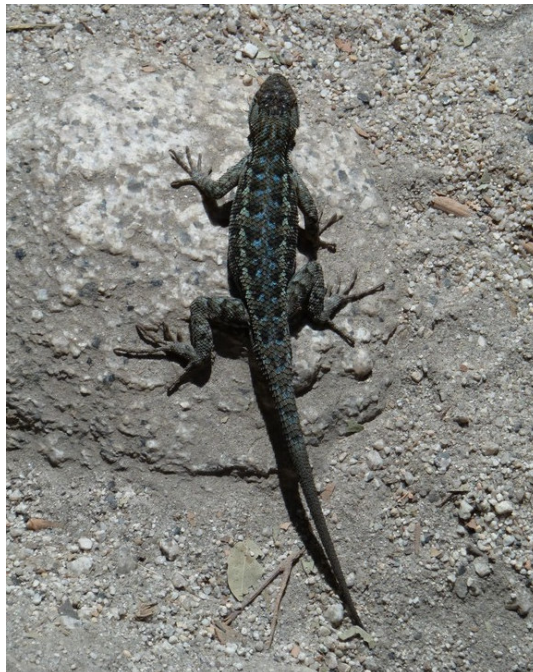
Western Fence Lizard, Nevada Fall, Yosemite NP

Western Fence Lizard Sceloporus occidentalis : 1 près de Nevada Fall, Yosemite NP.