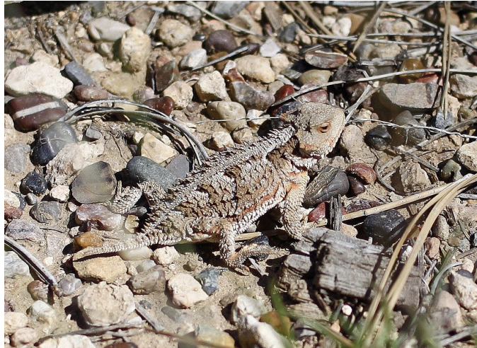
Greater Short-horned Lizard, Bryce Canyon NP

Greater Short-horned Lizard Phrynosoma hernandesi : 2 ensemble au sommet de la Fairyland Loop, Bryce Canyon NP.