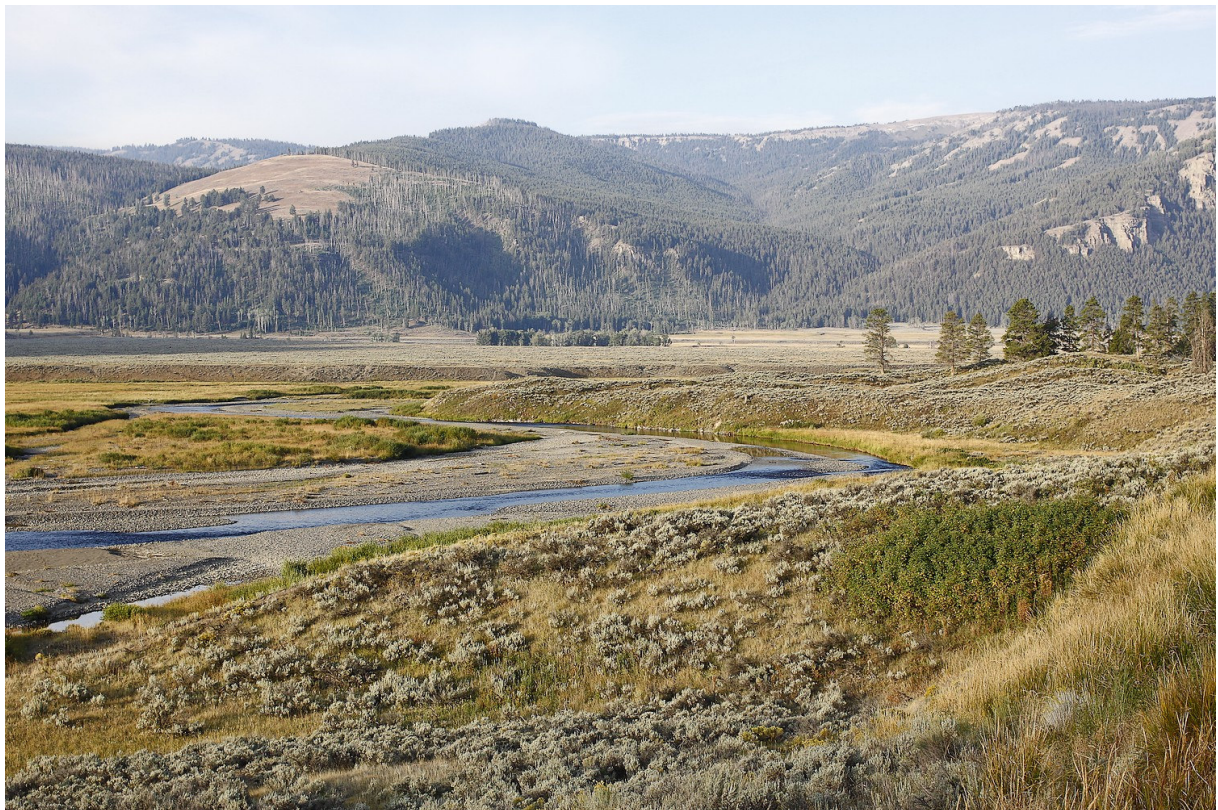
Lamar Valley, Yellowstone NP

Compte rendu de deux voyages effectués du 26 août au 14 septembre 2012 et du 16 juin au 06 juillet 2014