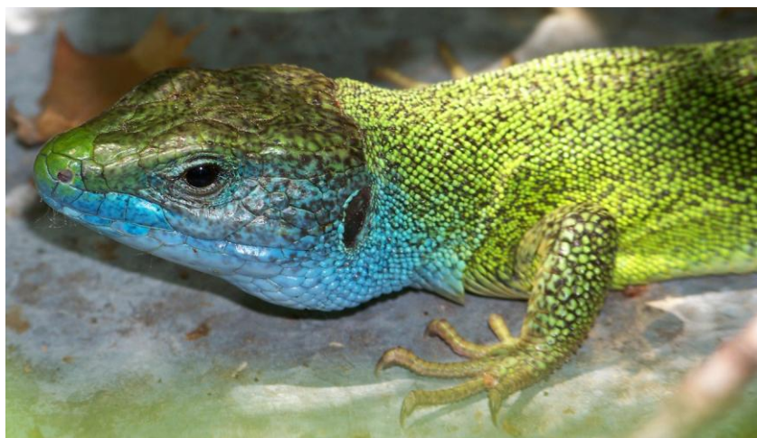
En toute probabilité, lézard à trois raies Lacerta trilineata à gauche ( Dadia ) et lézard vert Lacerta viridis à droite (gorges du Nestos ).

On notait sur le premier, les critères plus ou moins diagnostiques du contact de la narine avec l'écaille rostrale, du plus grand nombre d'écailles temporales, de la gorge jaune...l'individu ici photographié présentant en outre une teinte bleue sur les côtés de la gorge et sur les flancs plutôt rare mais connue chez certains sujets grecs. A contrario on relevait sur le lézard vert, outre sa flamboyante gorge bleue, une narine frôlant, mais sans l'atteindre, l'écaille rostrale, des écailles temporales moins nombreuses que chez son congénère... Difficile en revanche de confirmer les autres critères, à commencer par ces invisibles granules supraciliaires qu'aucun grossissement ne nous dévoila.