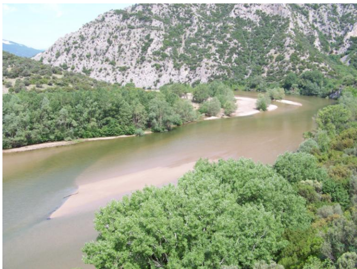
Gorges du Nestos.

L'accès aux gorges se fait depuis Toxotes, petit village situé au bord et au nord de la E90. Suivre le panneau « Narrows of Nestos » jusqu'au parking, au bout duquel part le sentier (site 1a) qui remonte les gorges en rive gauche du Nestos, surplombant la voie ferrée. Pour le site 1b, intéressant pour les rapaces, le point de vue... suivre, toujours à Toxotes, le panneau « Scenic drive ».