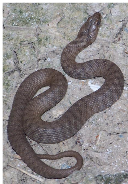
Couleuvre tessellée Natrix tessellata . Delta de l' Evros .

Fauvette épervière Sylvia nisoria Barred Warbler : Au lagunage de Prespa, 3-4 chanteurs avec brèves obs. de (une ou deux ?) fem. et obs. prolongée d'un mâle.