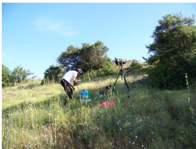
Ci-dessus extrême nord-ouest du delta de l' Evros (en sa part la plus verte et humide) – à droite, colline de Loutros (rive droite) : Hypolaïs des oliviers, p-grièche masquée, F. orphéane... ; Epervier à pieds courts, Cigogne noire et pomarin en migration ; reptiles...