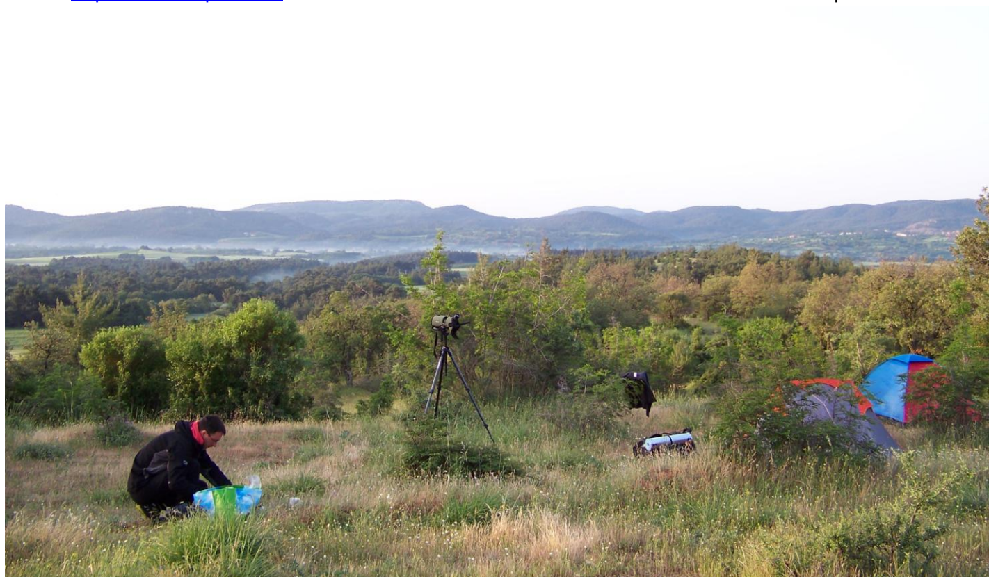
Petit-déjeuner dans les derniers lambeaux brumeux de Dadia et la compagnie mélodieuse d'une fauvette orphéane -qui se laissera longuement admirer.

Les étapes de ce voyage ont été largement inspirées par l'ouvrage de Steve Mills « Birdwatching in northern Greece » dont on trouvera les références ou que l'on ira commander sur la toile (on pouvait également se le procurer au centre d'information de Loutros –voir plus loin). Il est consacré à la région ornithologiquement la plus richement dotée du pays, pour laquelle nous avons naturellement opté. Nous avons extrait de cet opuscule les sites majeurs, décidant également au gré de nos priorités