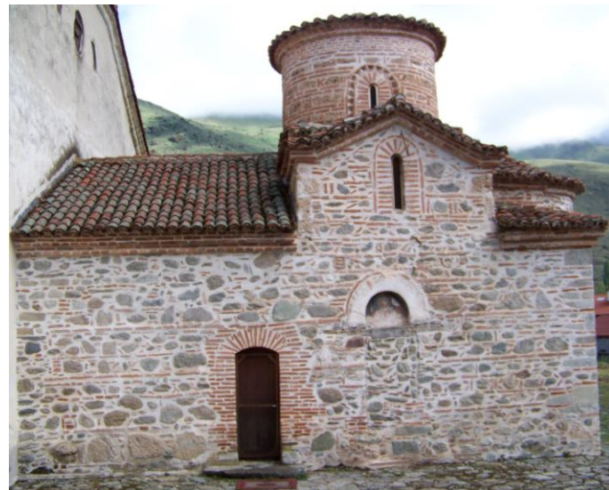
Prespa – village d'Agios Germanos. A gauche notre gîte d'un soir, le Traditional Hotel.

Situé dans l'extrême Nord-Ouest du Pays, à la frontière avec l'Albanie et la (République de) Macédoine 2 , ce site comprend 2 lacs : le Petit Prespa, au Sud, presque intégralement en Grèce, et le Grand Prespa, au Nord, étendu sur 3 pays. Autour des lacs, s'étendent des montagnes avec des sommets à plus de 2000 m.