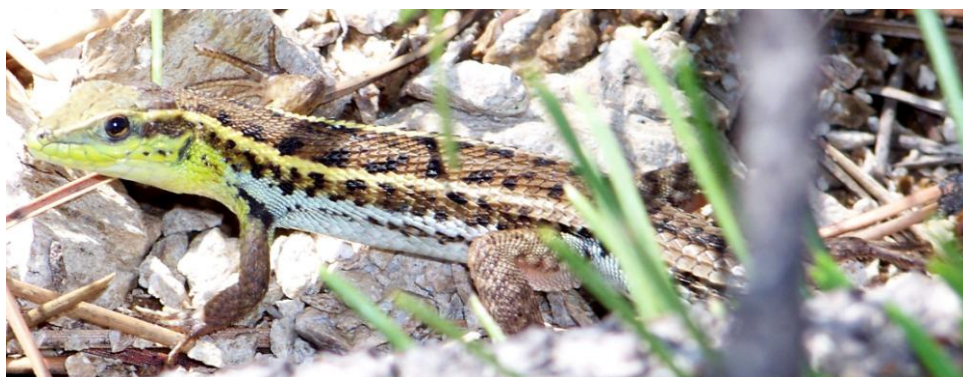
Le zoom aidant, nous pûmes relever l'absence de paupières (visibles) et de collier de cet Ophisops élégant Ophisops elegans . Dadia