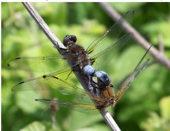
Libellules fauves Libellula fulva , forêt alluviale du Nestos .

Ajoutons des traces probables de cervidés sur le mont Sfika.