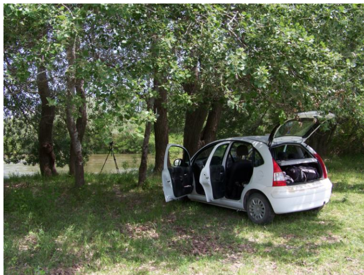
Nestos – forêt alluviale, près de l'embouchure.