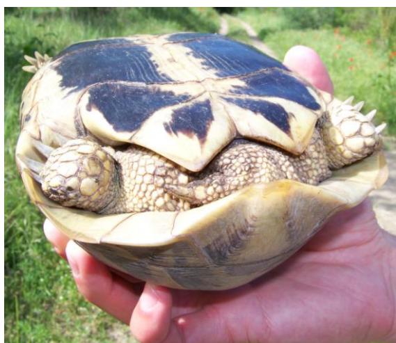
Tortue d'Hermann Testudo hermanni (noter le tubercule, l'absence des éperons de la t. grecque...) ne présentant qu'une seule écaille supra-caudale. Delta du Nestos