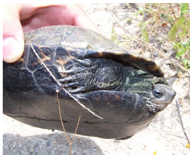
Emyde des Balkans Mauremys rivulata . Ismarida