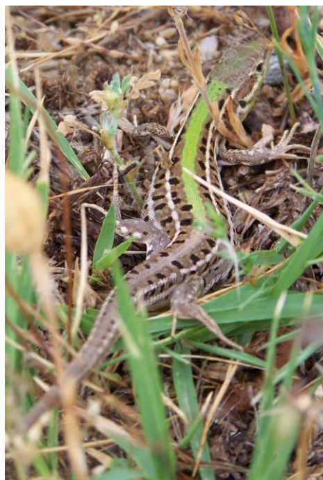
Cyrtodactyle de Kotschy Cyrtopodion kotschyi ( Chalcidique ) - Lézard de Tauride Podarcis taurica à droite ( Kerkini ) - jeune Lézard à trois raies Lacerta trilineata ci-dessous (route Loutros- Dadia )