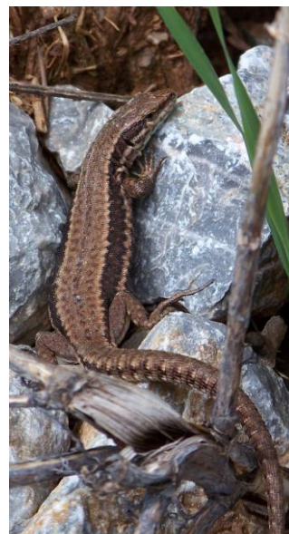
Noter en particulier la ligne vertébrale claire du Lézard égéen Podarcis erhardii ci-dessus et celle plus sombre du Lézard des murailles Podarcis muralis de droite (plus marquée que les dorsolatérales) ; accessoirement les marques noires et blanches de la queue du second... Prespa