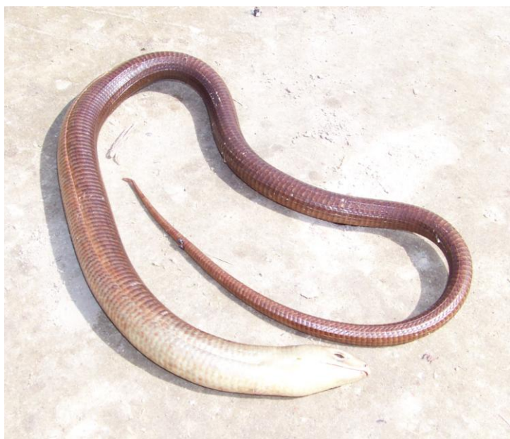
Orvet géant des Balkans Pseudopus apodus fraîchement défunt sur une piste de la forêt alluviale du Nestos .

Monticole bleu Monticola solitarius Blue Rock Thrush : 5 dans les gorges du Nestos.