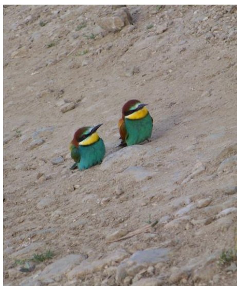
Deux Guêpiers Merops apiaster empoussiérant leurs teintes multicolores sur une des pistes bordant le lac d' Ismarida .

Bondrée apivore Pernis apivorus European Honey-Buzzard : 1 dans la forêt alluviale du Nestos, 1 au lac Ismarida et 3 sur la colline de Loutros en rive droite de l'Évros.