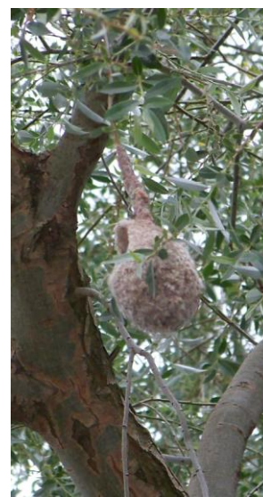
Nid de Rémiz penduline Remiz pendulinus Lac Kerkini