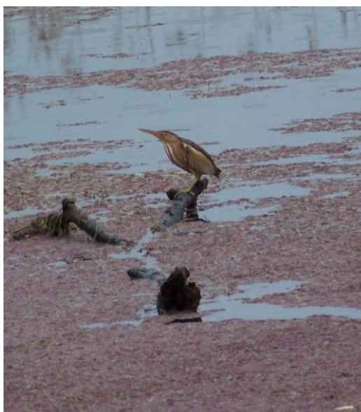
Blongios nain Ixobrychus minutus Lac Kerkini