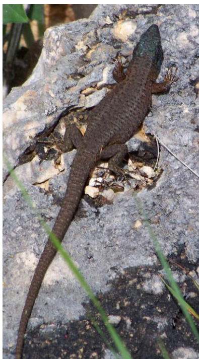
Mâle d'Algyroïde à points noirs Algyroides nigropunctatus à gauche et femelle à droite ; on relevait sur le premier les grandes écailles dorsales carénées et ce bleu qui outrepassé la gorge (et les yeux) à laquelle le guide le cantonnait, pour couvrir la tête. Prespa